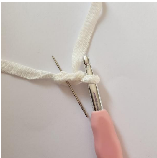
1. Haak 2 L, start in de 2e L vanaf de haaknaald.

Sluit af met 2 Hv. Knip de draad af en hecht af.