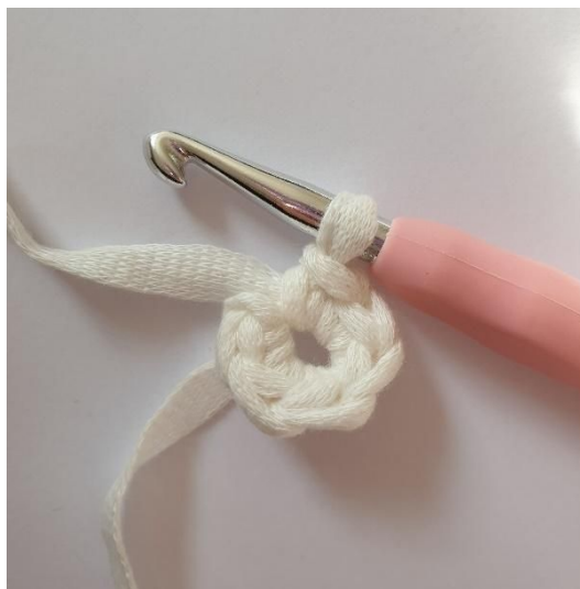
2. Haak 6 V in deze steek.