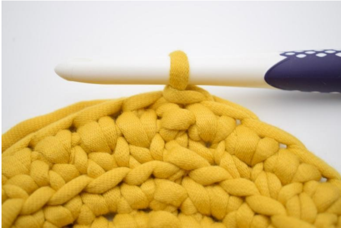
13. Herhaal met ks de toer rond, en sluit af met 1 hv.