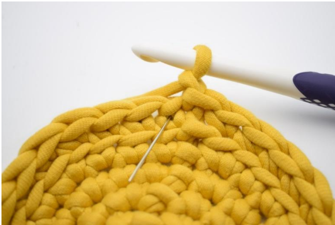
9. Haak nu ks. Ks is en gewone vaste, die gehaakt wordt in de "v" onder de lussen van de vaste. De naald wijst de "v" aan, waarin de vaste gehaakt wordt.