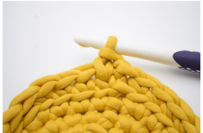
10. Zoals hier. Er is nu 1 ks gehaakt.