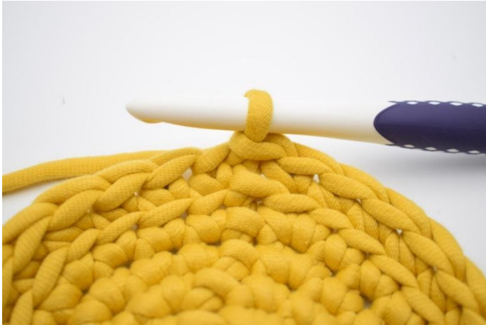
7. Haak v in Al de toer rond en sluit af met 1 hv.