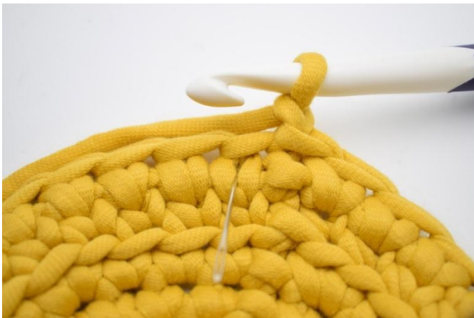
15. Haak 1 ks in de eerste "v".