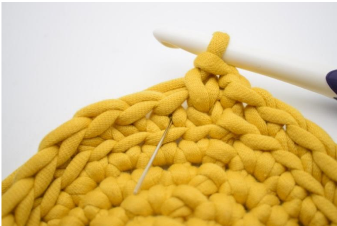
11. Haak 1 ks in de volgende "v". De naald wijst hier de volgende "v" aan, waarin gehaakt wordt.