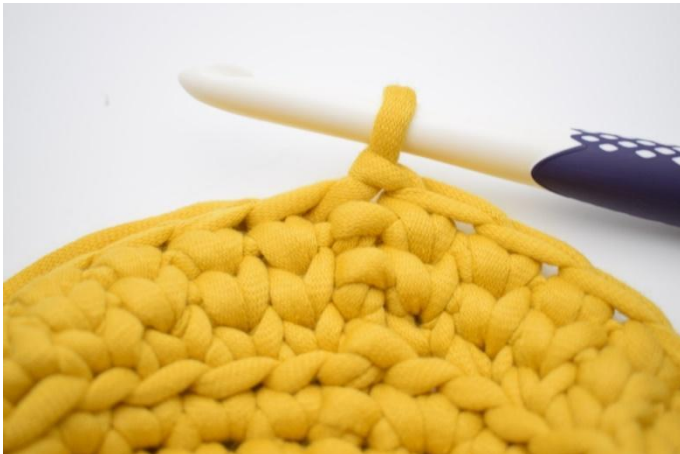
17. Haak ks de toer rond en sluit af met 1 hv.