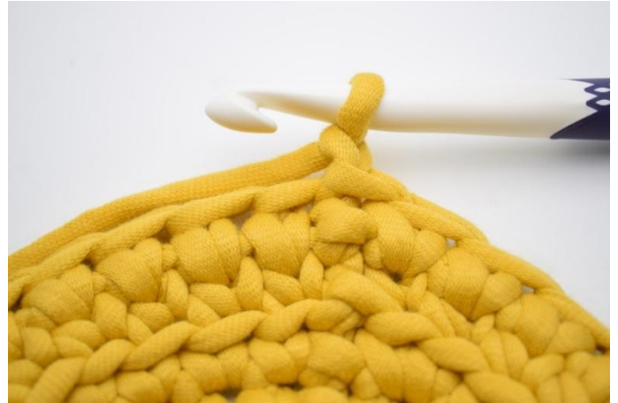
14. Herhaal de toeren op deze manier. Haak 1 l.