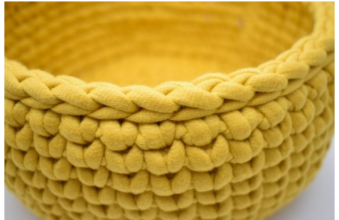
Herhaal de toeren met ks, zoals beschreven in het patroon. Sluit af met 1 toer hv. Knip de draad en hecht af.