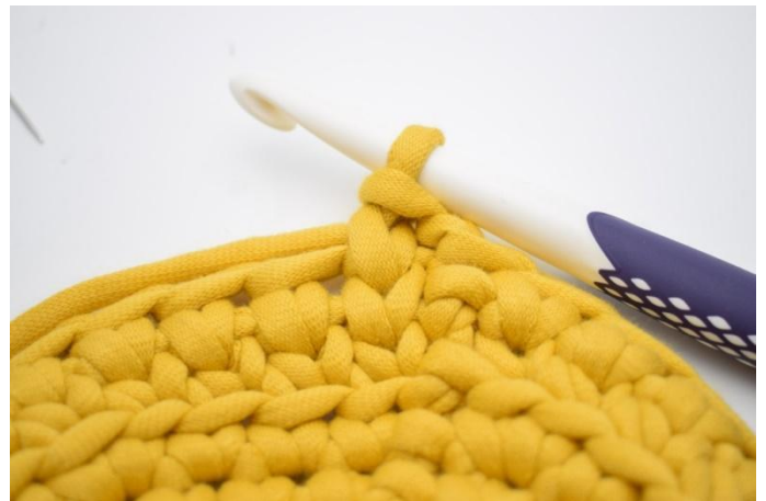
16. Zoals hier.