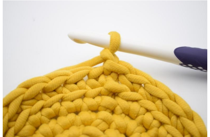
8. Haak 1 l.