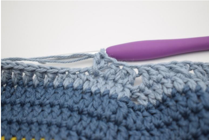
13. Sla 1 steek over en haak 1 Stk. Haak 1 Stk in de overgeslagen steek.