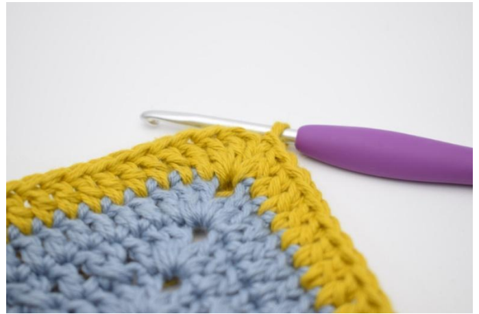
8. Herhaal op alle 4 zijden. Haak 1 Stk in de L-boog van begin. Sluit met 1 Hv in 3e L.