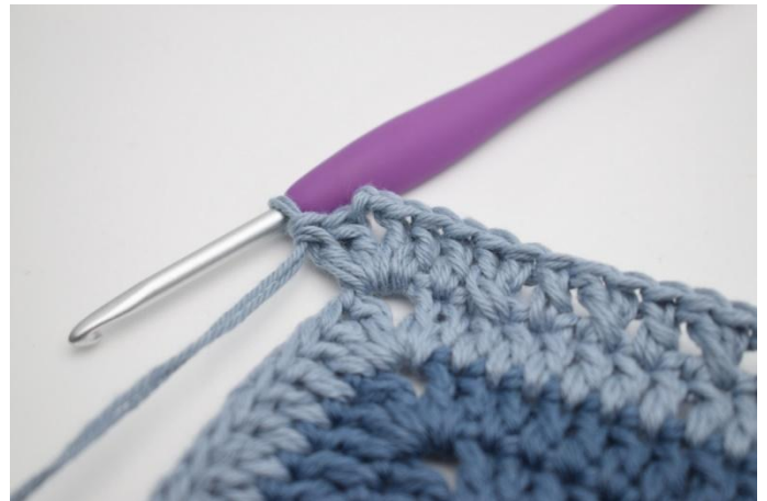
16. Haak 2 Stk, 2 L en 2 Stk in de volgende L-boog)