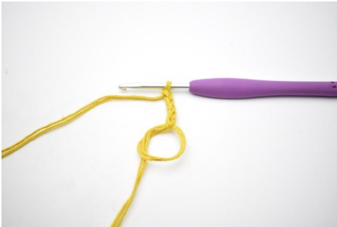
1. Met kleur A. Maak een magische ring. Haak 5 L.