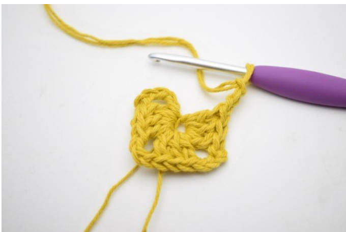
3. Herhaal *tot* in totaal 3x.