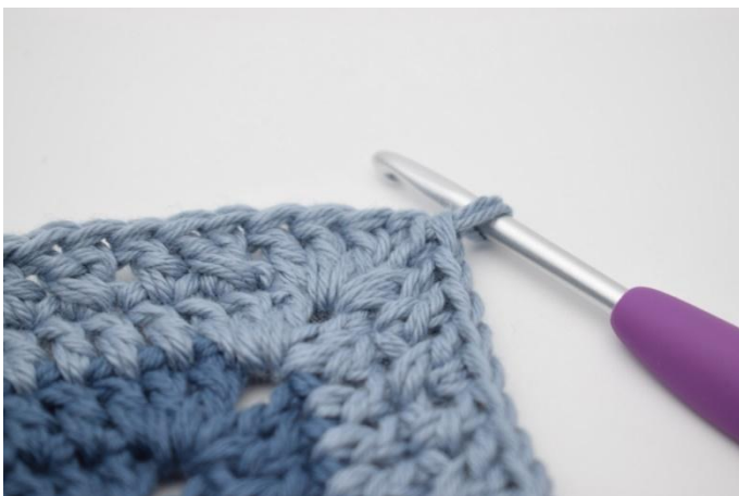
17. Herhaal dit op alle 4 zijden. Haak 1 Stk in de L-boog van begin. Sluit met 1 Hv in 3e L.