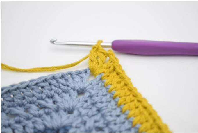
7. Haak 2 Stk, 2 L en 2 Stk in de volgende L-boog.