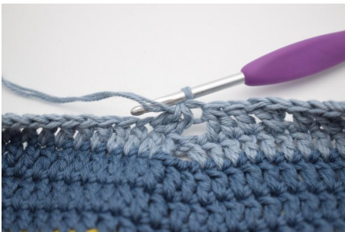
11. Haak 2 Stk samen.