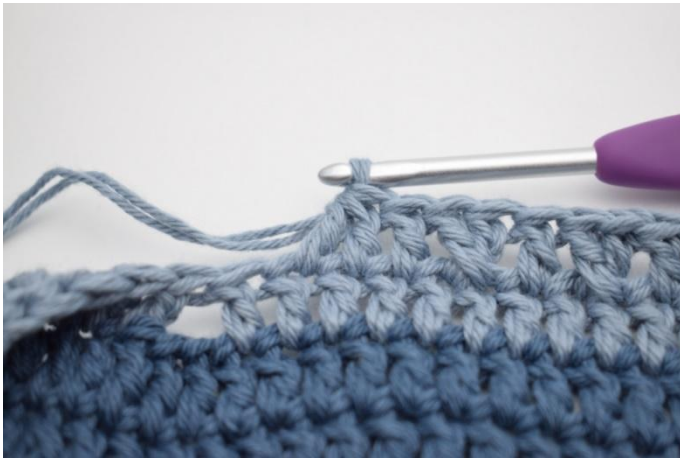
9. Haak 2 Stk samen.