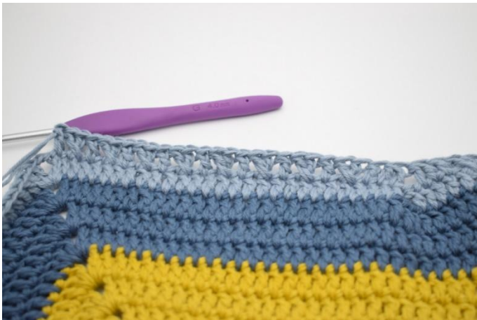
15. *Sla 1 steek over en haak 1 Stk. Haak 1 Stk in de overgeslagen steek. Haak 1 Stk in de volgende steek*. Herhaal *tot* 8 keer.