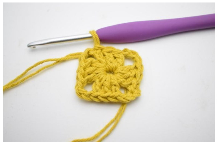
4. Haak 2 Stk. Sluit met 1 Hv in de 3e L van het begin.