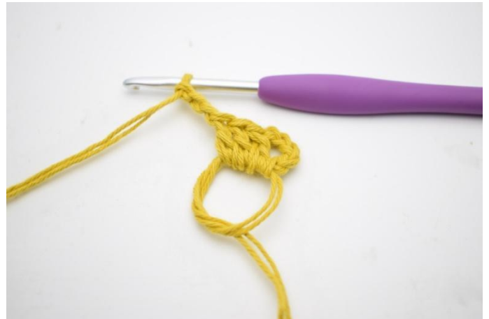
2. Haak *3 Stk en 3 L*.