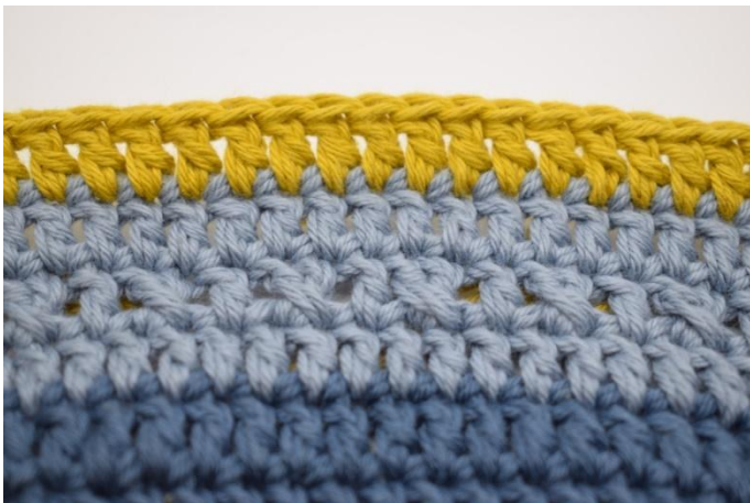
9. Er is nu 1 toer gehaakt met patroon en 2 toeren met Stk.