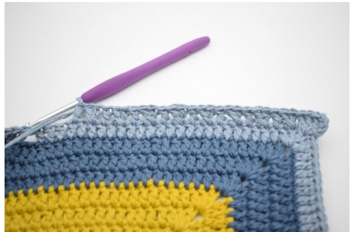
8. *Sla 1 steek over en haak 1 Stk. Haak 1 Stk in de overgeslagen steek. Haak 1 Stk in de volgende steek*. Herhaal *tot* 8 keer.