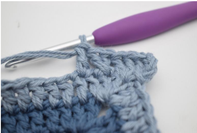
7. Haak 1 Stk in de volgende steek.