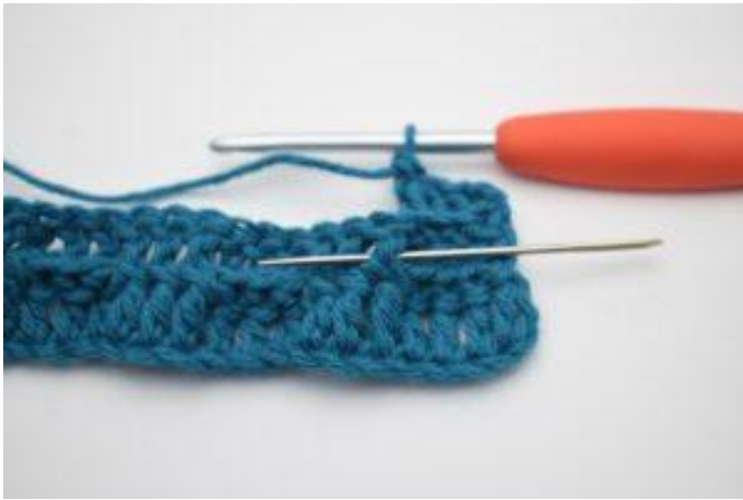
5. Haak 1 RstkV om het volgende Stk.