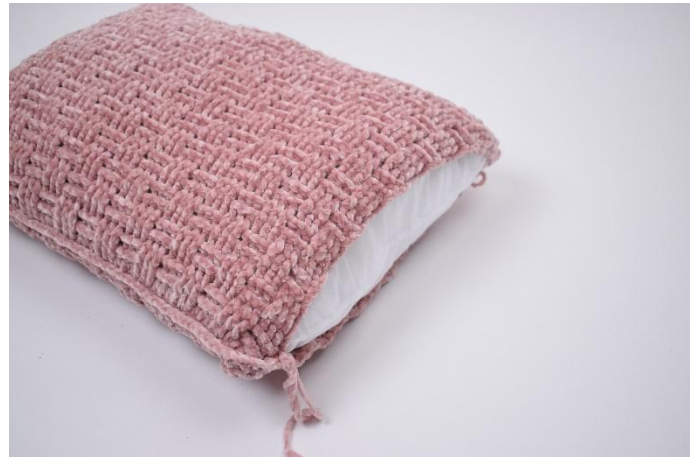
6. Doe het kussen erin voordat je helemaal rond bent.