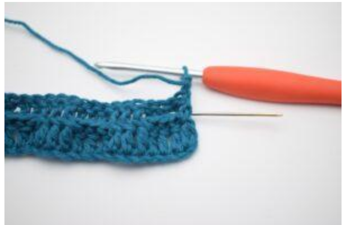
2. Haak 1 RstkA om het eerste Stk.