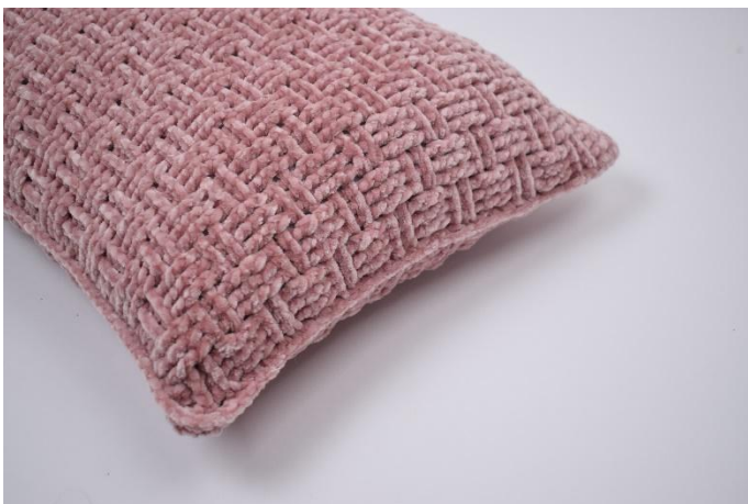
7. Knip het garen af en hecht af.