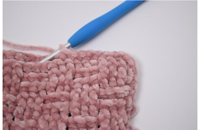
4. Haak verder met V.