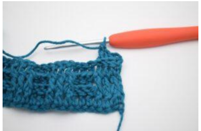
4. Haak 1 RstkA om de volgende 2 Stk.