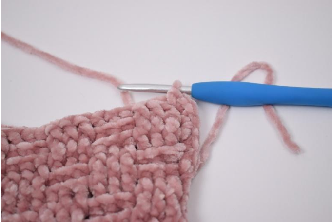
3. Haak V tot de hoek. In de hoek worden 3 V gehaakt.