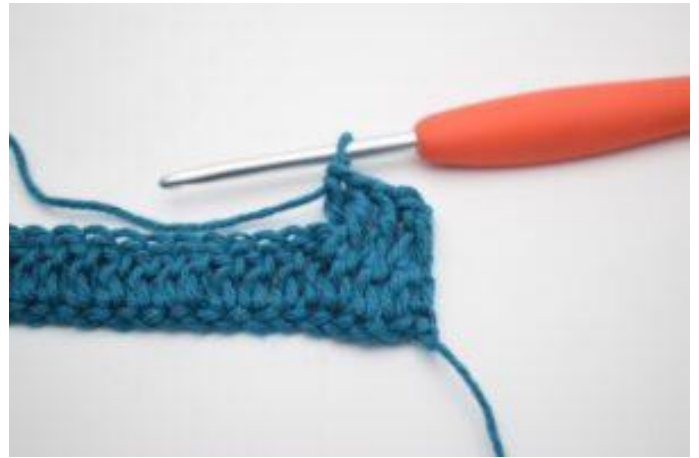
6. Zodanig. Nu is er 1 RstkA gehaakt.