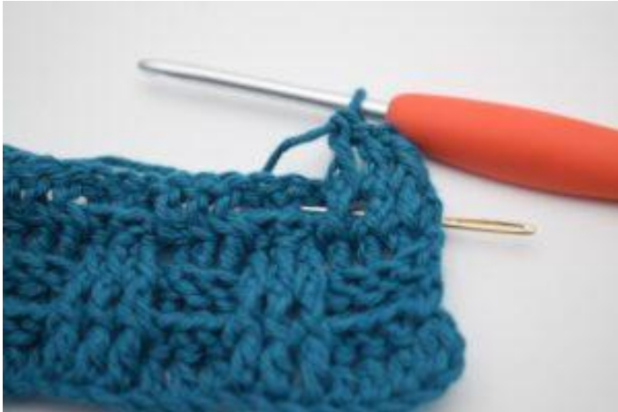
5. Haak 1 RstkA om het volgende Stk.