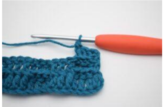
4. Haak 1 RstkA om de volgende 2 Stk.