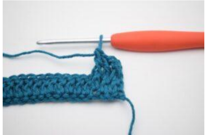
4. Haak 1 RstkV om de volgende 2 Stk.