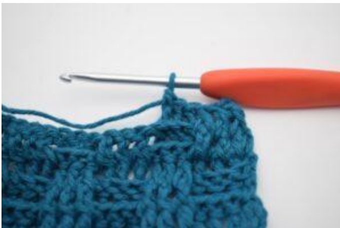
7. Haak 1 RstkA om de volgende 2 Stk.