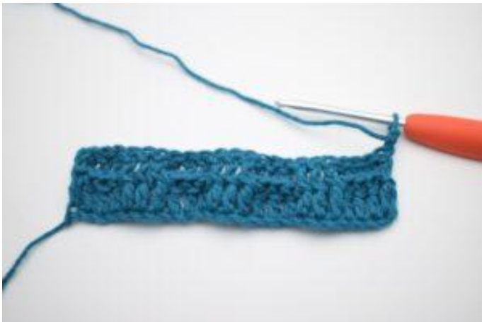
1. Keer met 2 L.