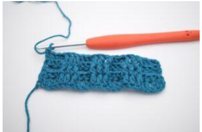
8. Herhaal om en om 3 RstkA en 3 RstkV de gehele toer. De toer stopt met 3RstkA. In de laatste steek wordt er 1 gewoon Stk gehaakt.