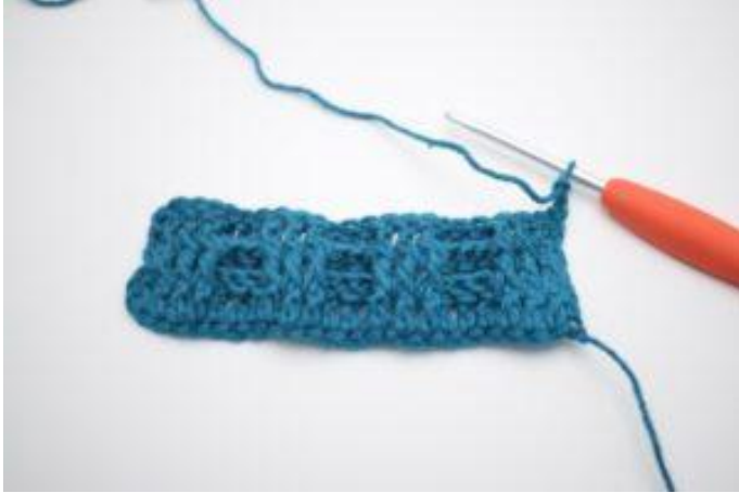
1. Keer met 2 L.