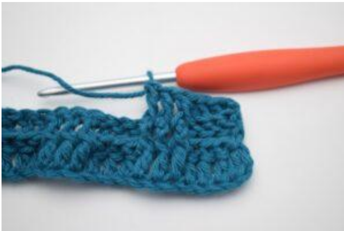
7. Haak 1 RstkV om de volgende 2 Stk.