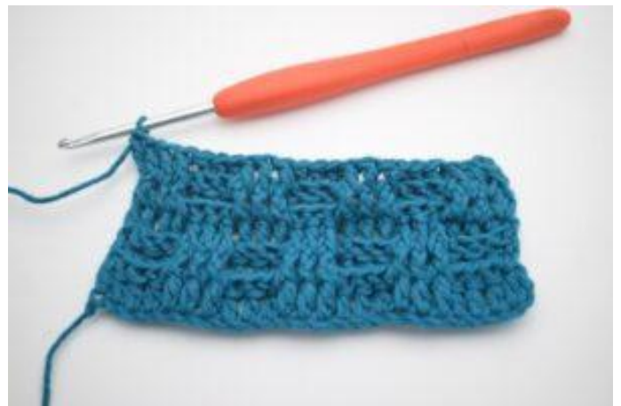
8. Herhaal om en pm 3 RstkV en 3 RstkA de gehele toer. De toer eindigt met 3 RstkV. In de laatste steek wordt er 1 gewoon Stk gehaakt. Herhaal toer 2-5 zoals beschreven in het patroon.