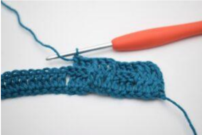
9. Haak 1 RstkA om de volgende 3 Stk.