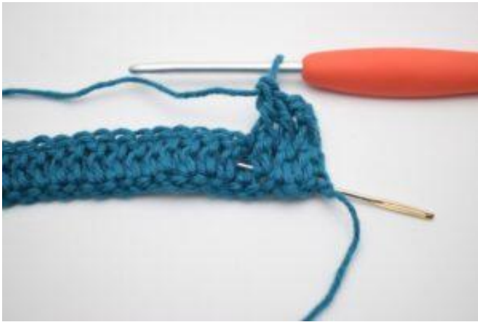
5. Haak 1 RstkA. Een RstkA is een Stk dat wordt gehaakt vanaf achter om het Stk van de vorige toer. De naald markeert hier het Stk waar je de RstkA omheen haakt.