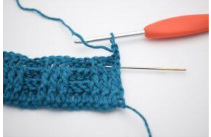
2. Haak 1 RstkA om het eerste Stk.