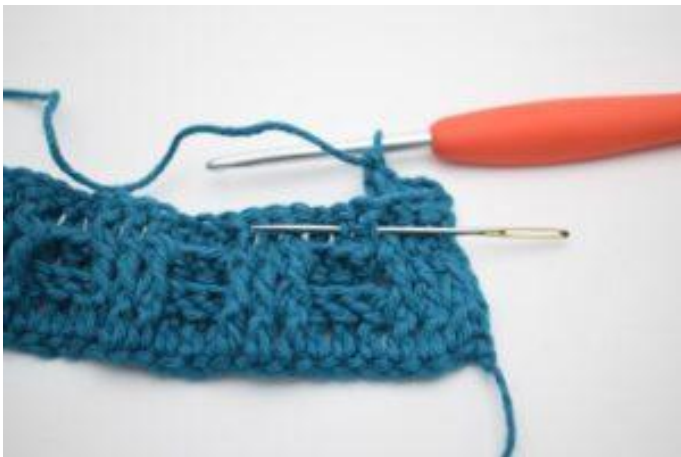
5. Haak 1 RstkV om het volgende Stk.