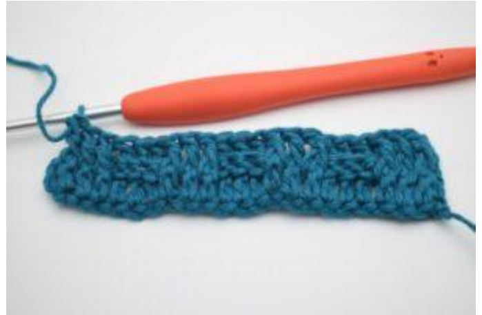
10. Herhaal om en om 3 RstkV en 3 RstkA de gehele toer. De toer eindigt met 3 RstkV.