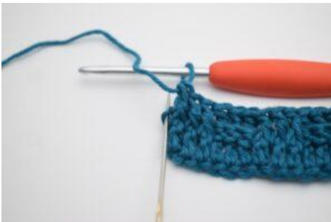
11. In de laatste steek wordt er 1 gewoon Stk gehaakt.