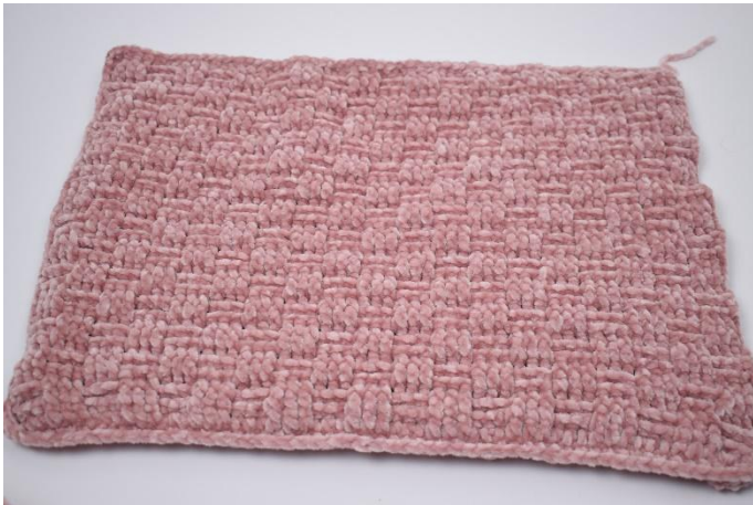
5. Haak V aan alle zijden.