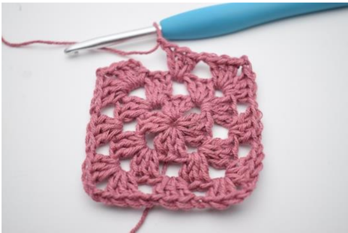
7. Herhaal "tot" in totaal 3x.