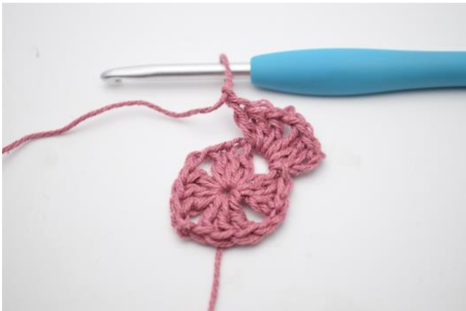
3. Haak 3 L, haak 2 Stk, 2 L, 3 Stk en 1 L in de L-boog.