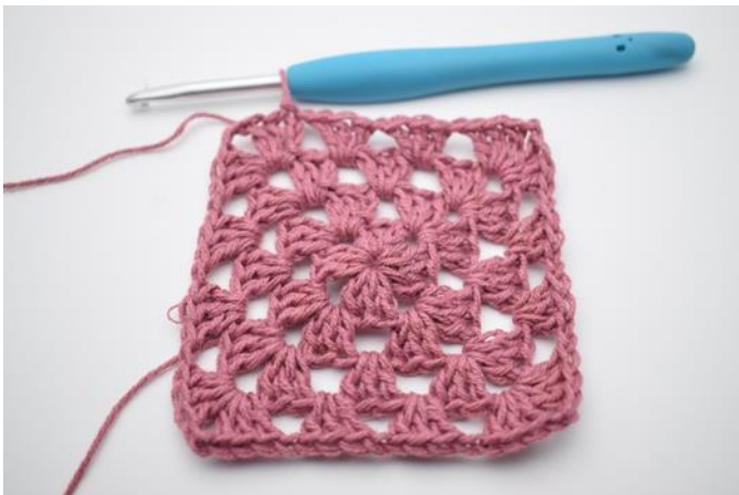
1. Herhaal deze manier zoals beschreven in het patroon.