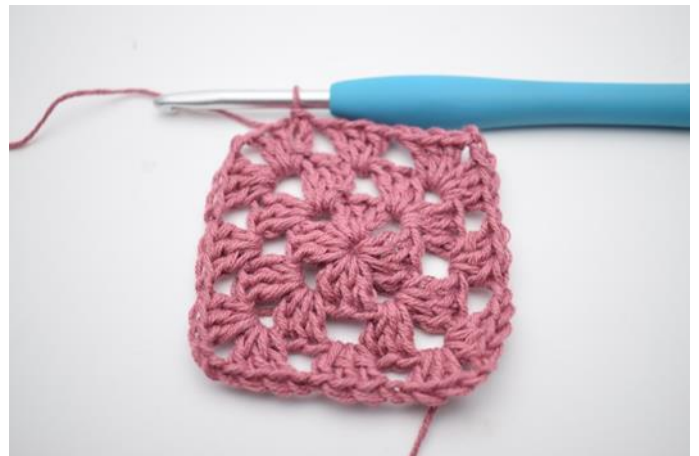
8. Sluit met 1 Hv.