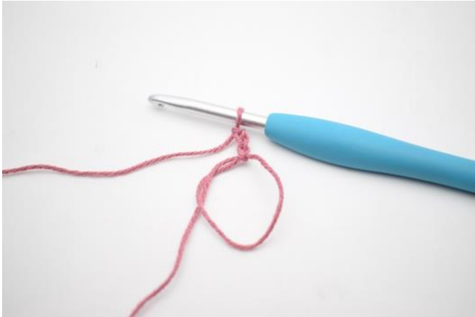
1. Maak een magische ring. Haak 3 L,