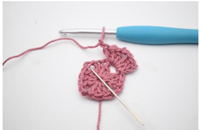
4. Haak " 3 Stk, 2 L, 3 Stk en 1 L in de volgende L-boog".