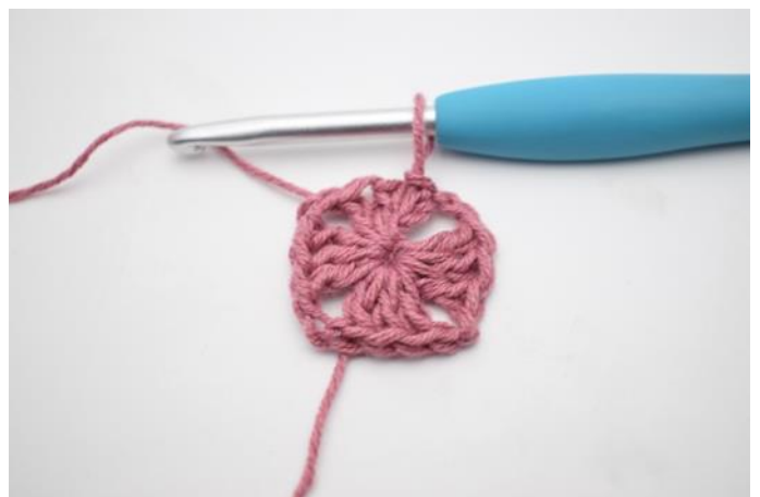
6. Sluit met 1 Hv.