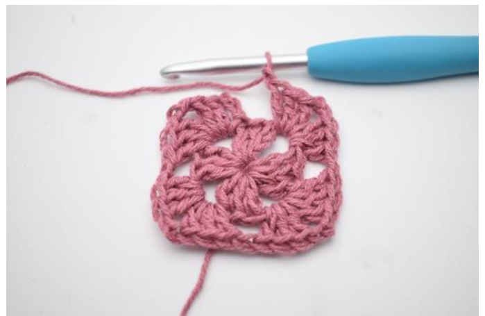
6. Herhaal "tot" in totaal 3x.