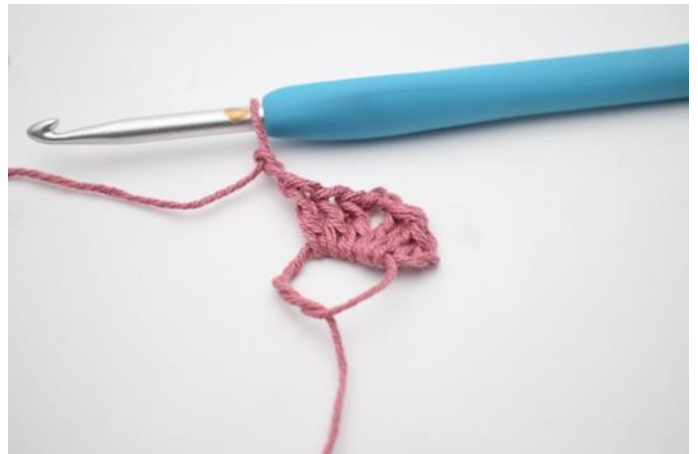
4. Haak "3 Stk en 2 L".