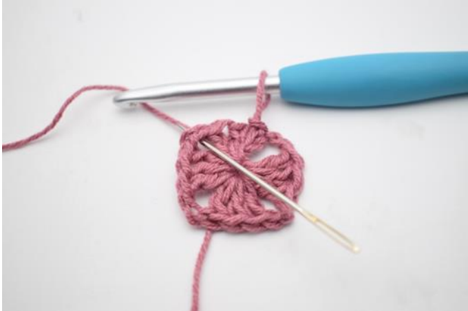
1. Haak Hv tot de L-boog.