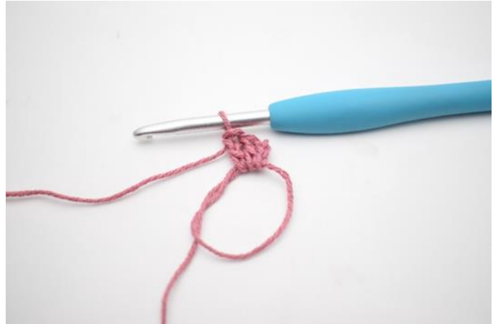
2. haak 2 Stk,