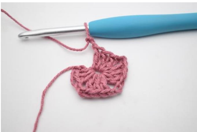
5. Herhaal "tot" in totaal 3x.