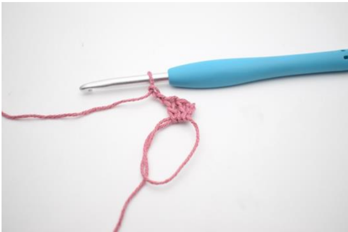
3. en haak 2 L.