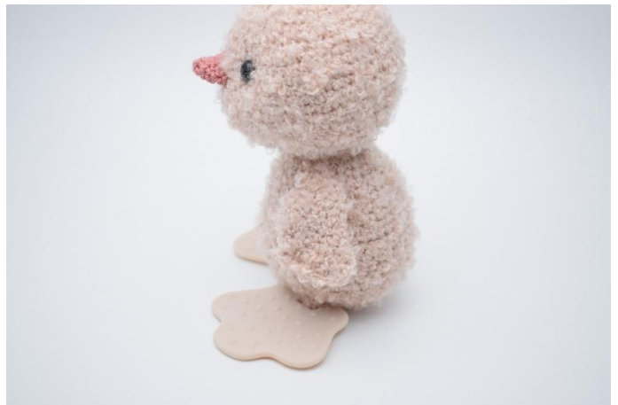
2. Naai de ene vleugel vast aan de zijkant van het lijf, ca. 3 toeren onder het hoofd.