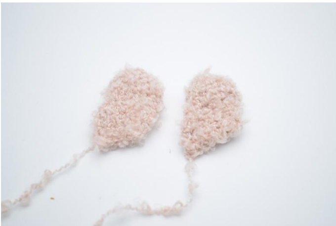
1. De vleugels er nu klaar voor montering.