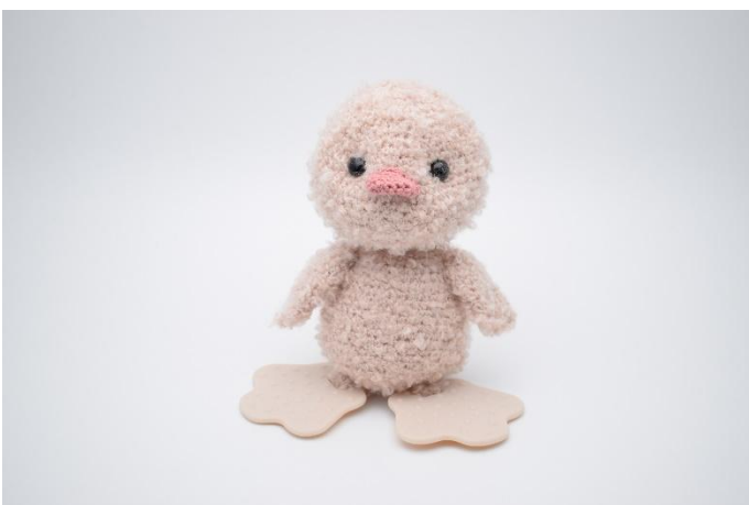
3. Herhaal aan de andere zijkant.