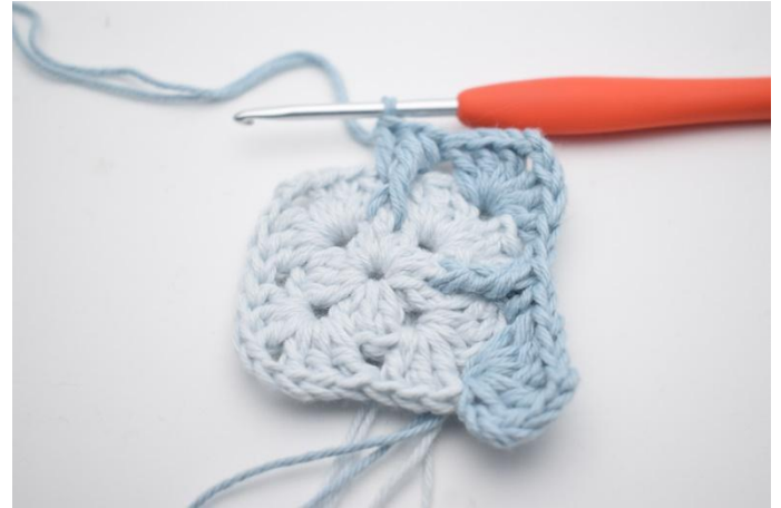
10. Haak "3 stk, 2 l en 3 stk in de volgende l-boog. Haak in de volgende tussenruimte: 1 stk, 1 vr-dbstk rondom de middelste steek van de stk-groep van toer 1 en 1 stk".