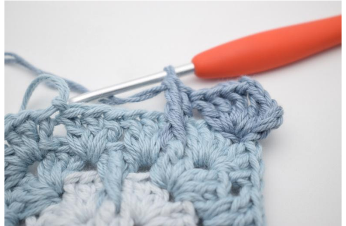
6. Zoals hier.