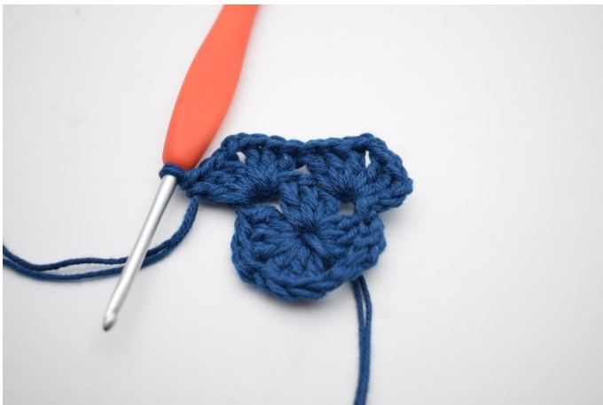
5. Zoals hier.