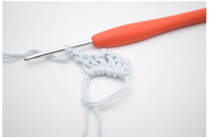
4. Haak "3 stk en 2 l".