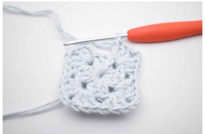
6. Herhaal van " tot " in totaal 3 keer.