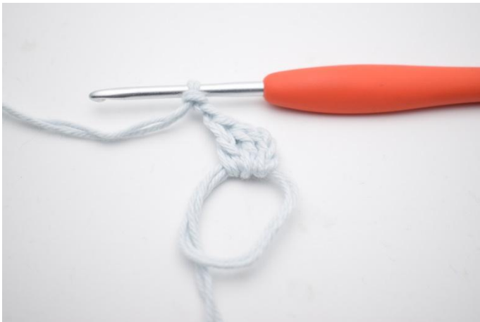
3. en haak 2 l.