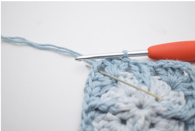
1. Haak hv tot de volgende l-boog.