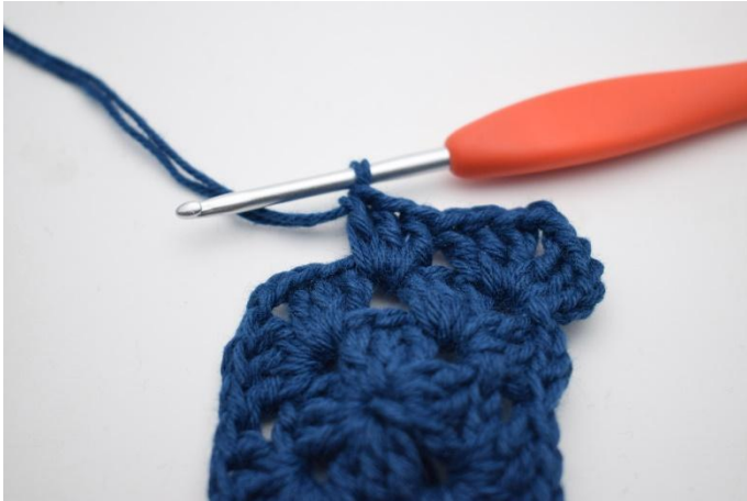
5. Zoals hier.