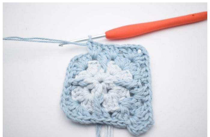
8. Haak "3 stk, 2 l en 3 stk in de volgende l-boog. Haak 3 stk in de volgende 2 tussenruimtes".