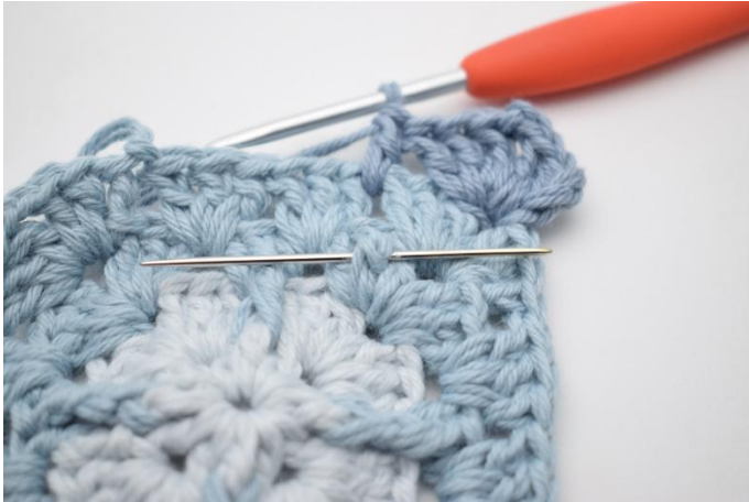
5. Haak 1 vr-dbstk rondom de middelste s van de stk-groep van toer 3. De naald markeert het pootje.