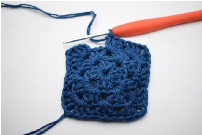
7. Herhaal van " tot " in totaal 3 keer.