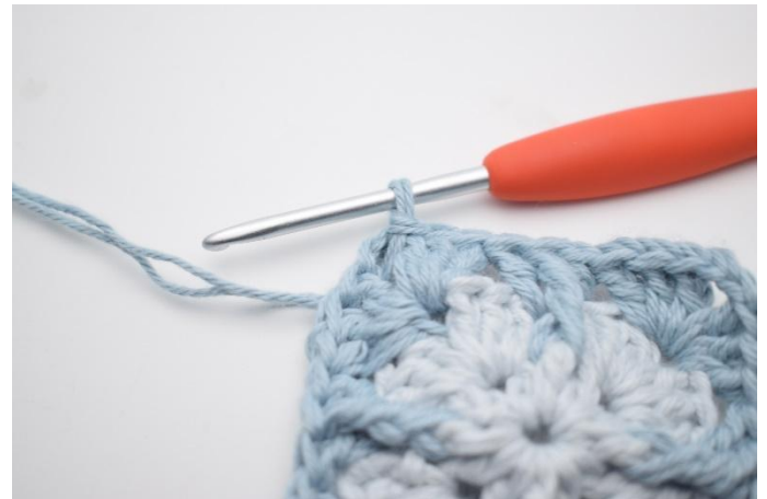
2. Zoals hier.