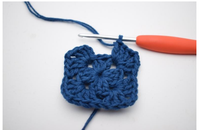
6. Herhaal van " tot " in totaal 3 keer.