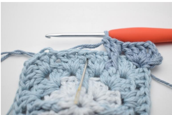
9. Herhaal dit in de volgende tussenruimte.