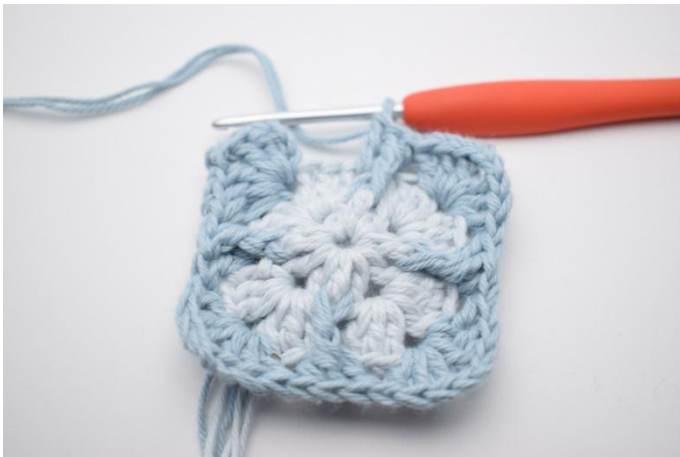
11. Herhaal van " tot " in totaal 3 keer.