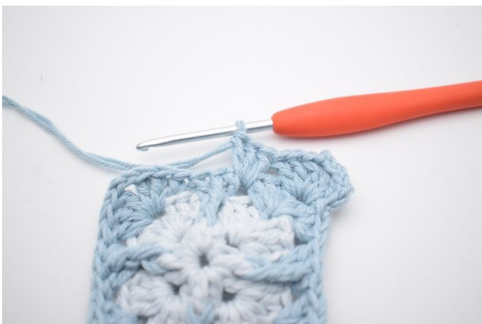
5. Zoals hier.