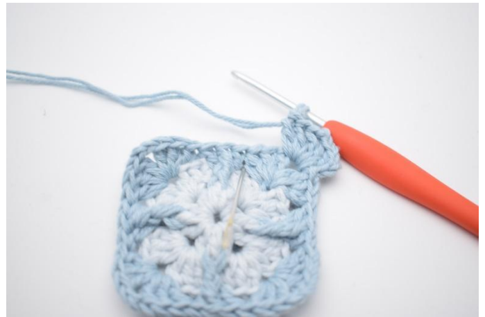
4. Haak 3 stk in de volgende russenruimte.