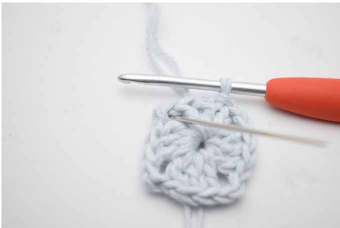
1. Haak hv tot de l-boog.