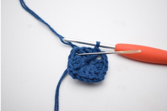
1. Haak hv tot de l-boog.