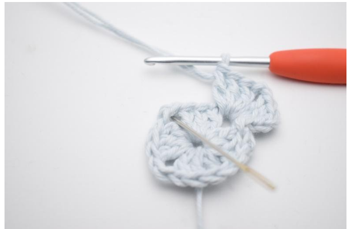
4. Haak " 3 stk, 2 l en 3 stk in de volgende l-boog".