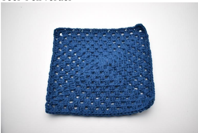
1. Herhaal zoals beschreven in het patroon. Let op: in de laatste toer worden hstk gehaakt in plaats van stk.