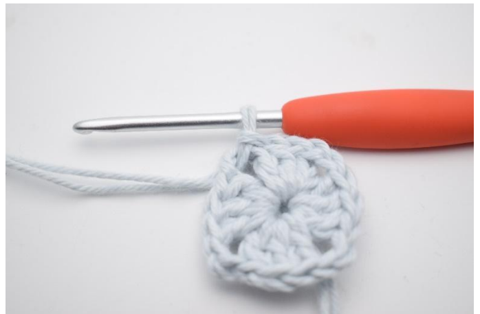
2. Zoals hier.