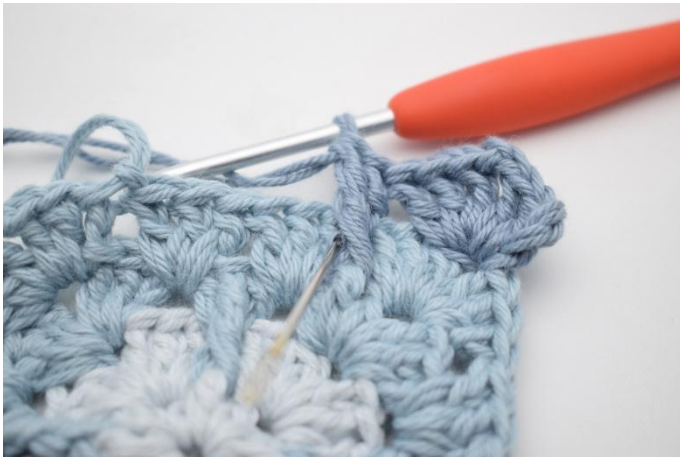
7. Haak 1 stk meer in dezelfde tussenruimte.