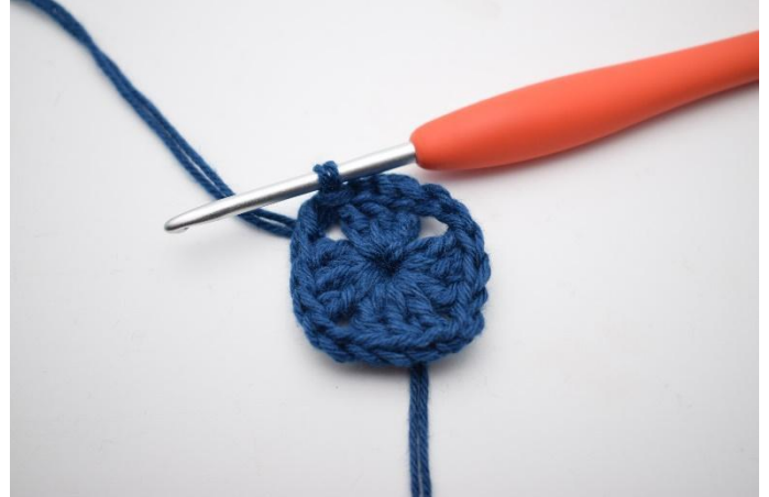
2. Zoals hier.