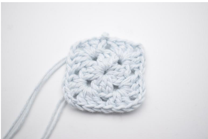
7. Sluit af met 1 hv. Knip het garen af.