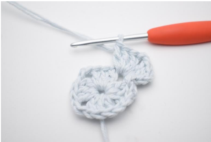
3. Haak 3 l, haak 2 st, 2 l, 3 stk in de l-boog.