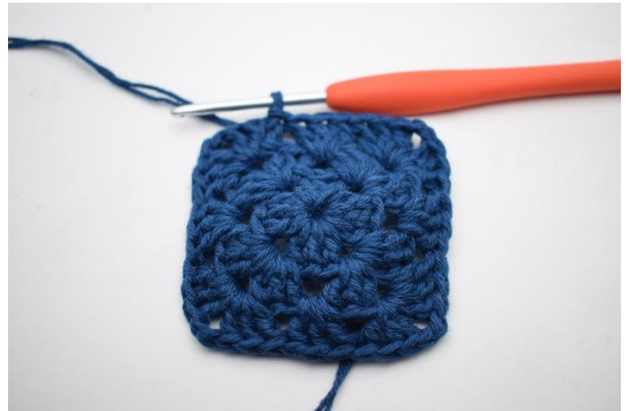
8. Sluit af met 1 hv.