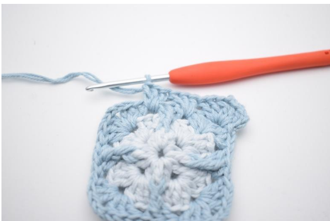
7. Zoals hier.