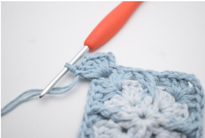
3. Haak 3 l, haak 2 stk, 2 l en 3 stk in de l-boog.