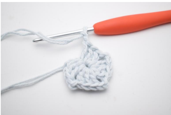
5. Herhaal van " tot " in totaal 3 keer.