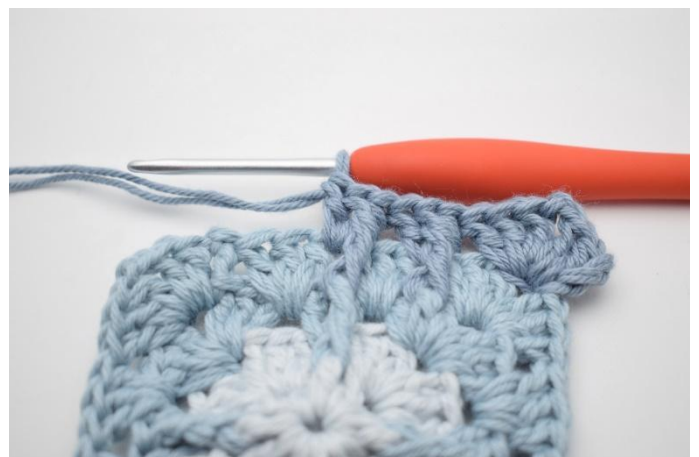
10. Zoals hier.