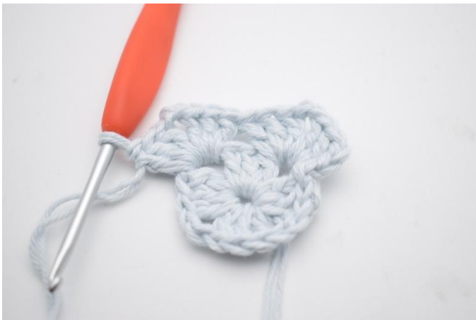
5. Zoals hier.