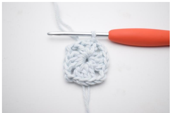
6. Sluit af met 1 hv.