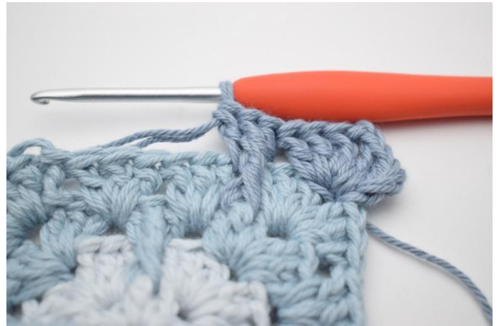
8. Zoals hier.