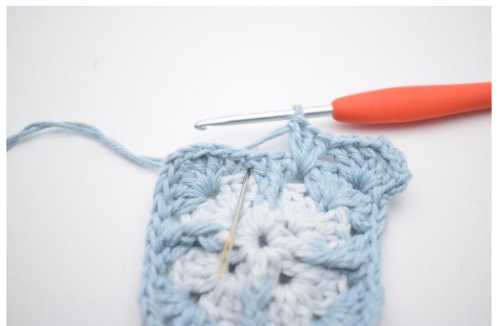
6. Haak 3 stk in de volgende tussenruimte.