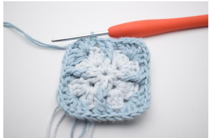
12. Sluit af met 1 hv.