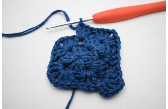
6. Haak "3 stk, 2 l en 3 stk in de volgende l-boog. Haak 3 stk in de volgende tussenruimte".