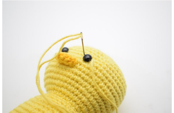
2. Steek de naald aan de andere kant van het oog weer in en trek licht aan.