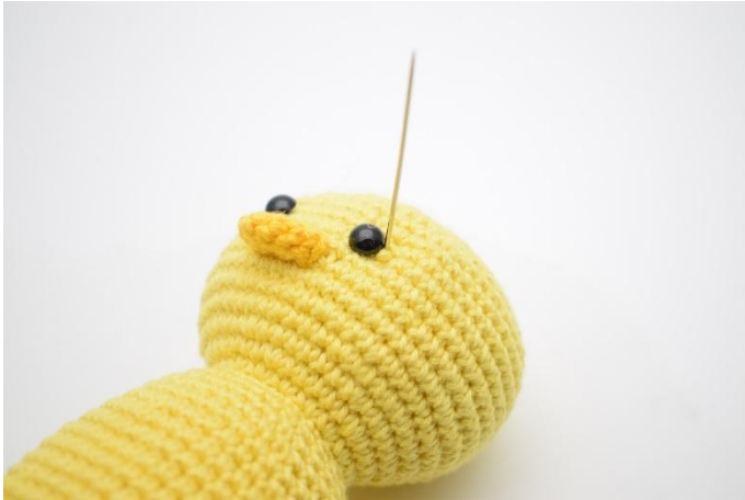
1. Met geel garen wordt de naald ingestoken naast het eerste oog,

Maak evt. verdiepingen bij de ogen op de volgende manier: