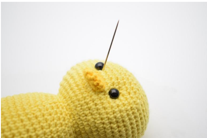
3. Steek de naald in naast het tweede oog.