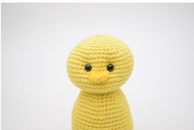
5. Trek licht aan zodat verdiepingen ontstaan.