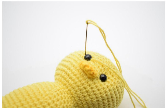
4. en weer in aan de andere kant van het oog.