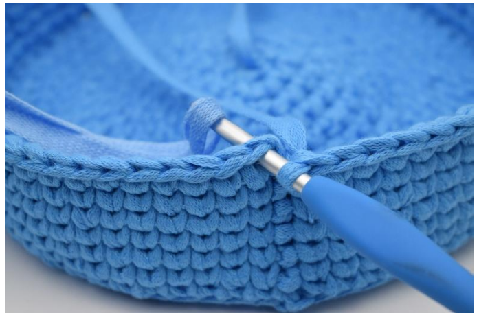
16. Wissel naar kl. 2 in de laatste doorhaling van de laatste ks van de toer in kl. 1.