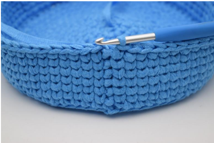
15. Herhaal de toeren met ks in kl. 1 zoals beschreven in het patronon.