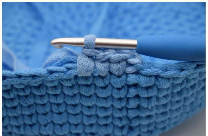
18. Haak nu verder met kl. 2 en wissel naar kl.3 zoals beschreven in het patroon.