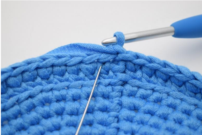
13. Haak weer ks de toer rond. De naald wijst de eerste "v" aan, waarin gehaakt wordt i.