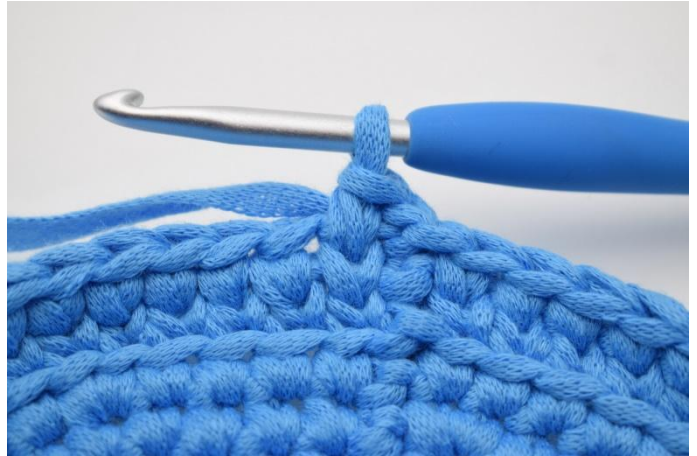
14. Zoals hier. Haak ks de toer rond en sluit af met 1 hv.