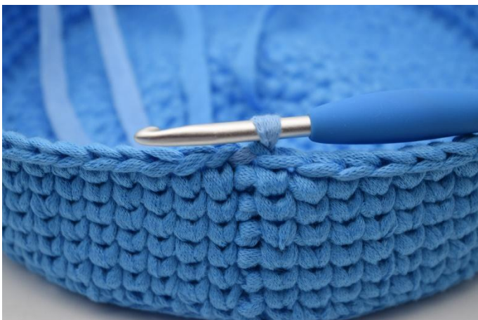
17. Zoals hier.