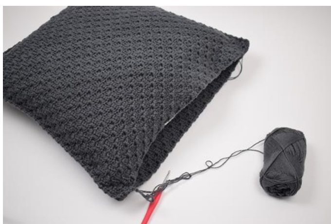
10. Stop het kussen erin, voordat het laatste deel samengehaakt wordt.