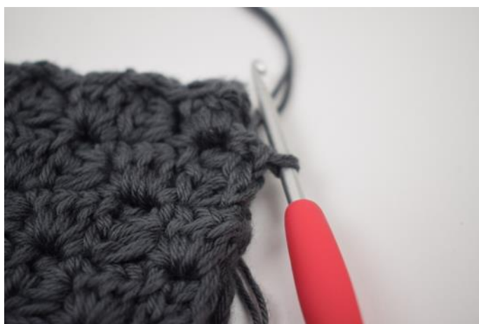
4. Haak 1 v tussen de volgende 2 "vierkanten".