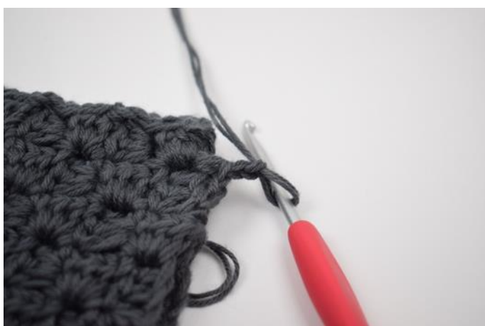
5. Haak 2 l.