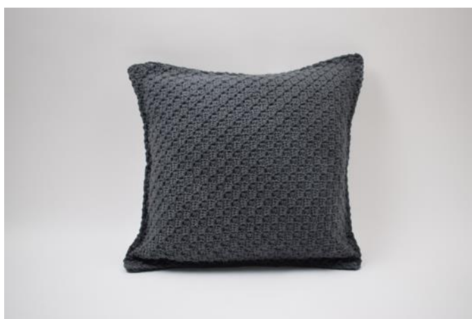
12. Knip de draad en hecht af.