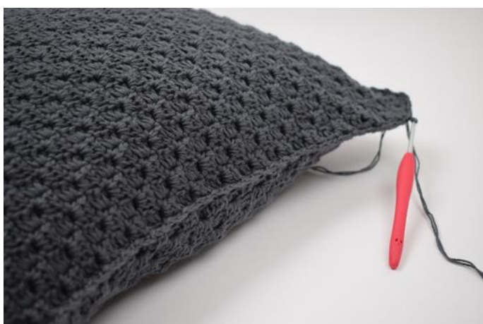
11. Ga nu verder met het laatste gedeelte. Sluit af 1 hv.