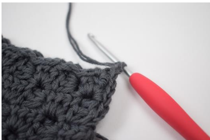
7. Haak 2 l.