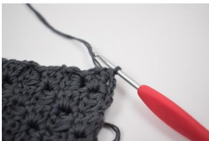
6. Haak 1 v in de hoek.