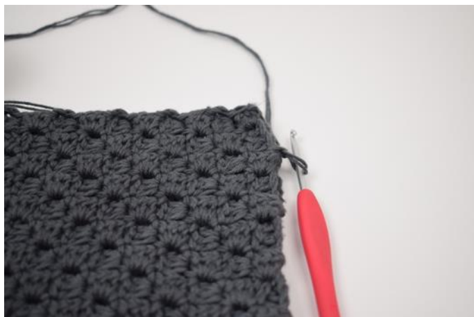
2. Haal het garen door tussen 2 "vierkanten"