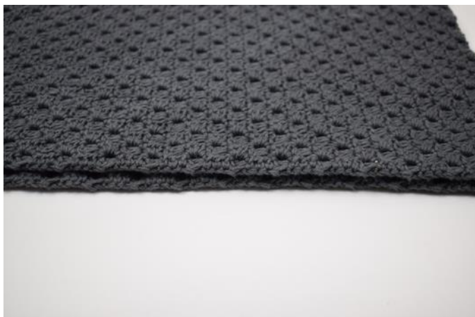
1. Leg de 2 stukken op elkaar.