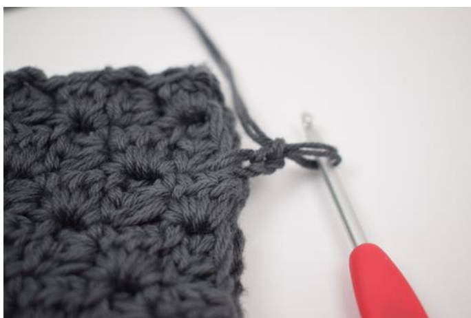
3. Haak 2 l.