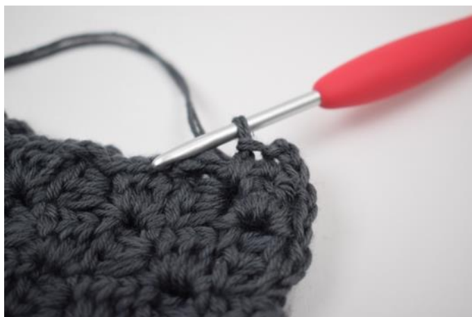
8. Haak 1 v tussen de volgende 2 "vierkanten".