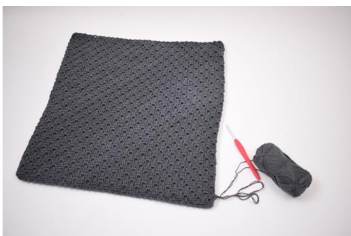
9. Ga verder rond het kussen.