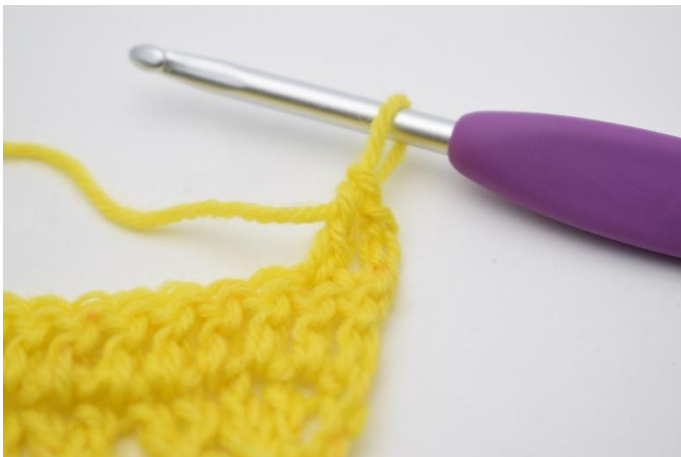
3. haak 1 stk.