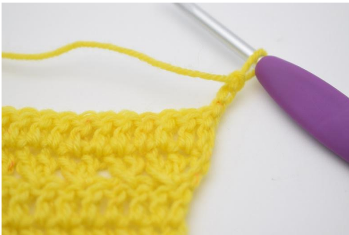
1. Keer met 3 l.

Keer met 3 l. "Sla 1 s over en haak 1 stk in de volgende s. Haak 1 stk in de s die zojuist overgeslagen is". Herhaal van " tot " tot het einde van de toer en er nog 1 s over is. Haak 1 stk in de laatste s. (24)