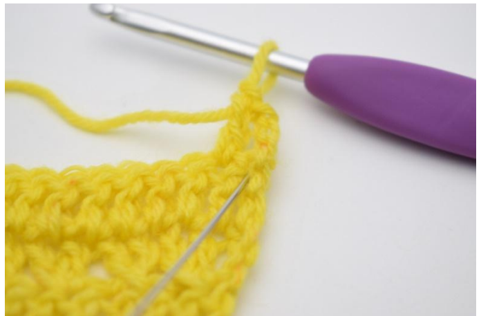
4. Haak nu 1 stk in de steek die zojuist overgeslagen is.