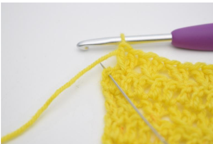
11. Haak 1 stk in de laatste s.