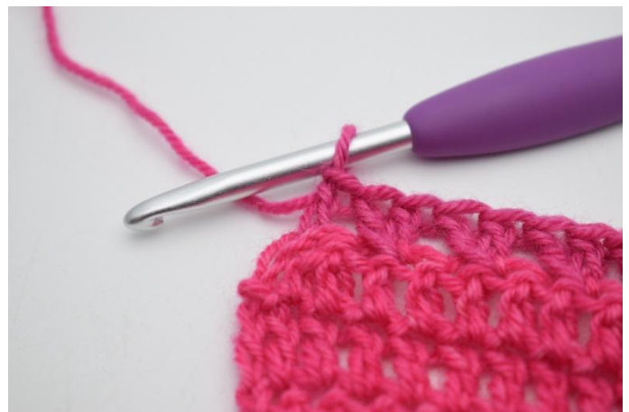
8. haak 1 stk in de laatste s.

100. Keer met 3 l. Haak de 2 volgende s sm. Haak 1 stk in iedere s tot het einde van de toer. (93)