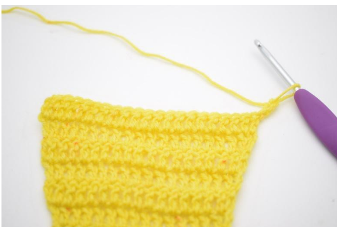
1. Keer met 3 l.

21. Haak nu in patroon met meerderingen. Deze rijen worden op de volgende wijze gehaakt: Keer met 3 l. "Sla 1 s over en haak 1 stk in de volgende s. Haak 1 stk in de s die overgeslagen is". Herhaal van " tot " tot het einde van de toer en er nog 1 s over is. Haak 1 stk in de laatste s. (22)