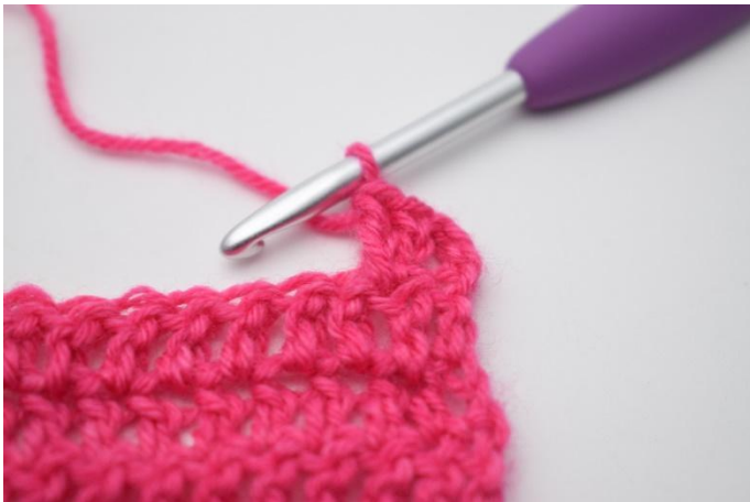
5. Zoals hier.