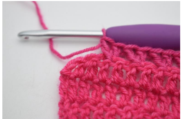
6. Haak nu in patroon verder. "Sla 1 s over en haak 1 stk in de volgende s. Haak 1 stk in de s die zojuist overgeslagen is". Herhaal van " tot " tot er nog 2 s over zijn.