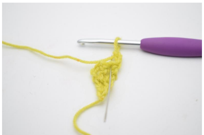
2. Haak 1 stk in de eerste s. (Dat is de s die de naald markeert.)