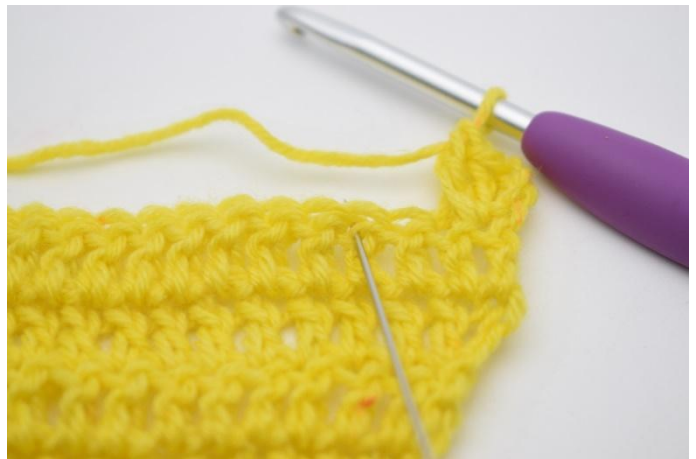
6. Sla 1 s over,