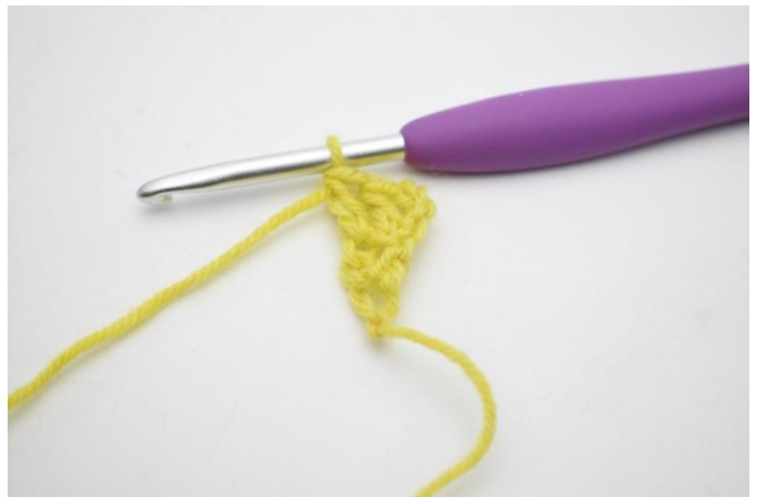
4. Haak 1 stk in de laatste s. De rij is nu met 1 s gemeenderd.