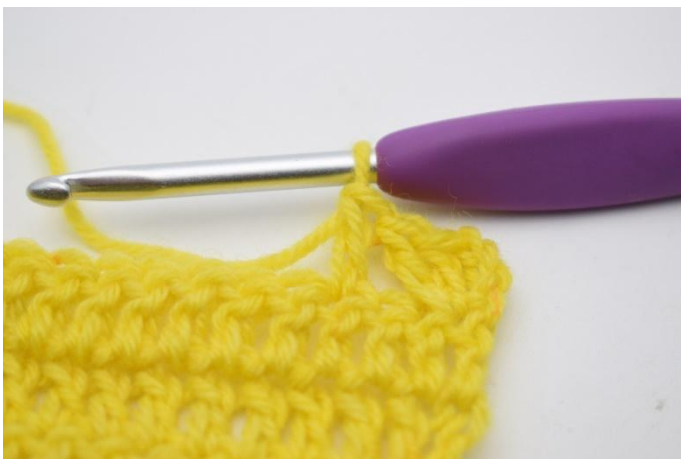
7. haak 1 stk.