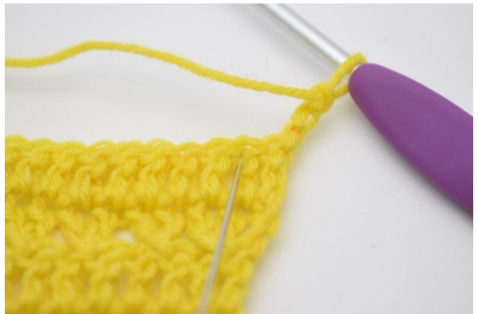
2. Sla 1 s over,