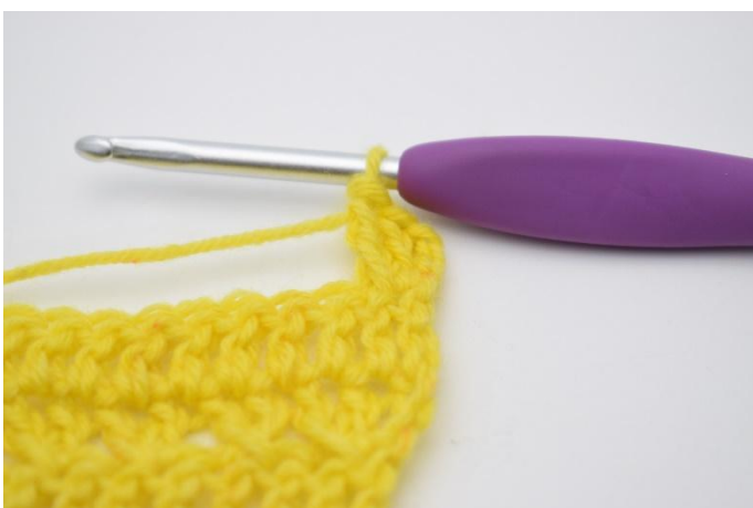
5. Zoals hier.