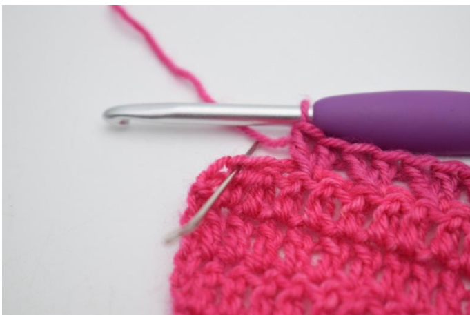
7. Sla 1 s over,