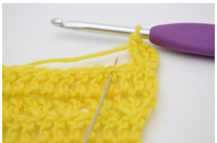
6. Sla 1 s over,