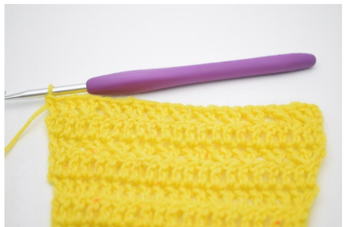
12. Er is nu 1 rij in patroon gehaakt.