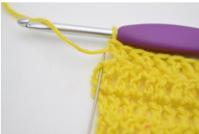
11. Haak 1 stk in de laatste s.