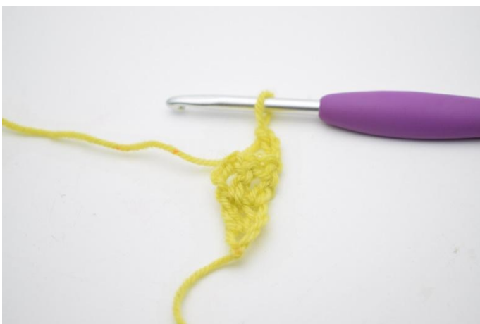
1. Keer met 3 l.