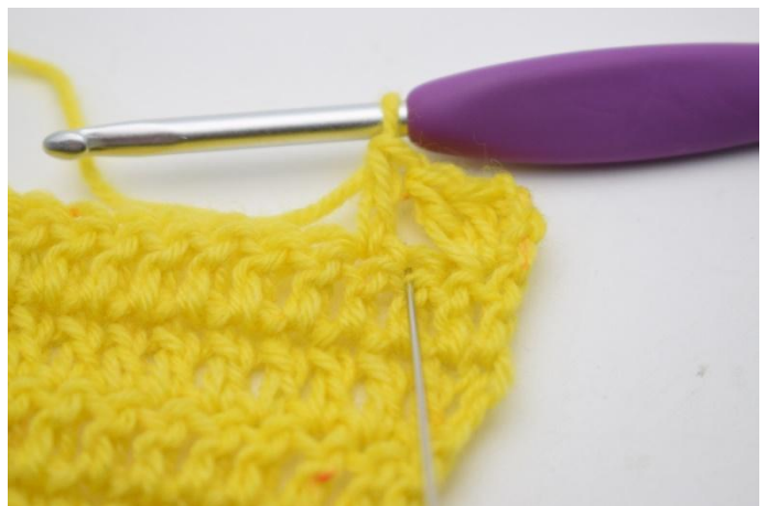
8. Haak nu 1 stk in de steek die zojuist overgeslagen is.