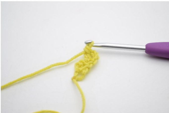
3. Zoals hier. Er zijn nu 2 stk in de eerste s, omdat de 3 keerl ook als 1 stk tellen.