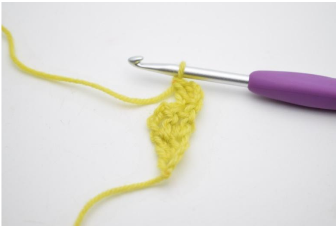
3. Zoals hier. Er is nu 1 s gemeerderd.