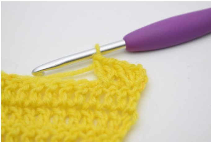
9. Zoals hier.