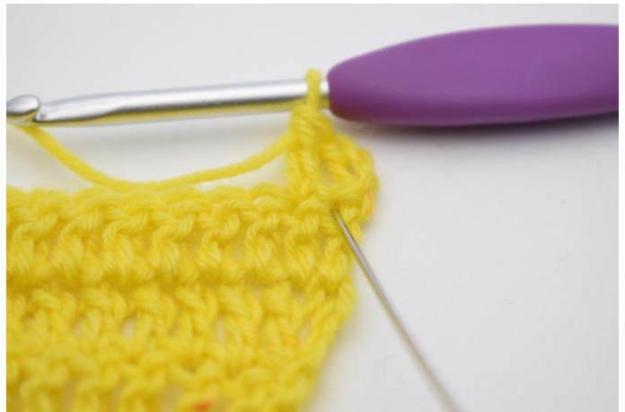
4. Haak nu 1 stk in de steek die zojuist overgeslagen is.