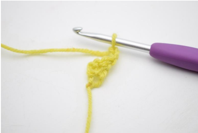
1. Keer met 3 l. (is 1e stk)