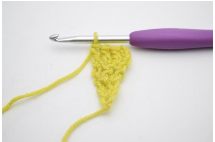
4. Haak 1 stk in de laatste 2 s.

4. -20. Herhaal " Keer met 3 l. Haak 1 stk in de eerste s. Haak 1 stk in alle s tot het einde van de rij." Tot in totaal 20 rijen. (21)