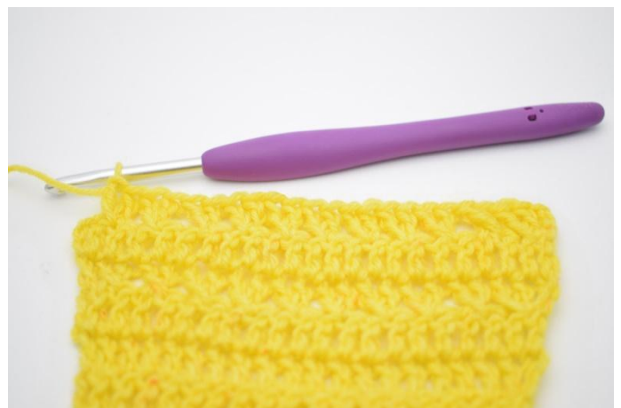
10. Herhaal met gekruiste stk tot er nog 1 s over is.