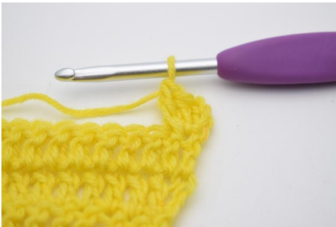
5. Zoals hier.