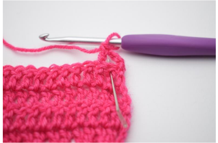
4. Haak 1 stk in de 2e steek die overgeslagen is.