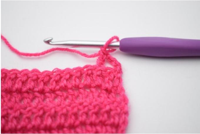
3. Haak 1 stk.