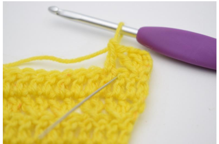
8. Haak nu 1 stk in de steek die zojuist overgeslagen is.