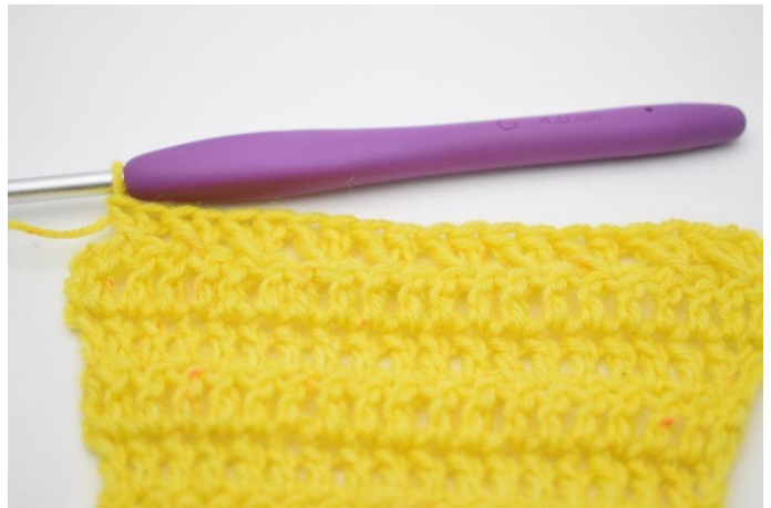
10. Herhaal met gekruiste stk tot er 1 s over is.