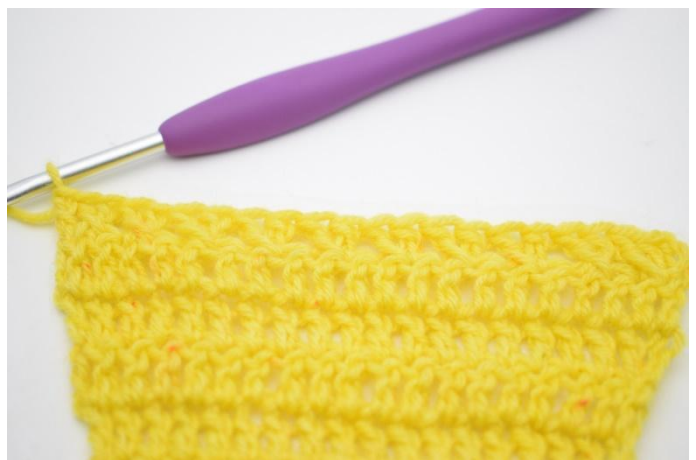
12. Zoals hier.

22. Haak nu 1 rij 'normale' stk met meerderingen aan het begin van de toer, zoals in rij 1-20. Keer met 3 l. Haak 1 stk in de eerste s. Haak 1 stk in iedere s tot het einde van de rij." (23)