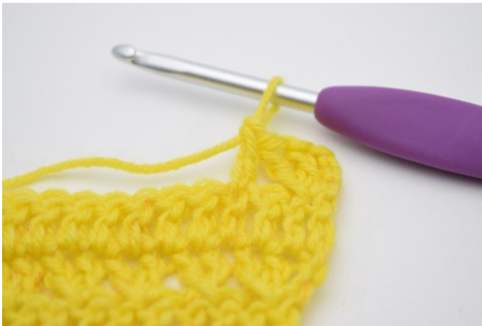
7. haak 1 stk.