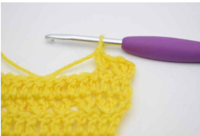
9. Zoals hier.