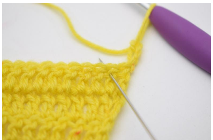
2. Sla 1 s over,