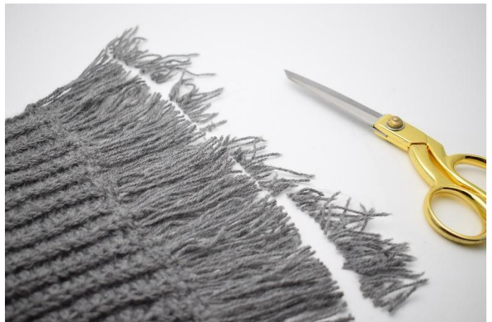
8. Knip ca. 1 cm van de franjes, zodat ze even lang zijn.