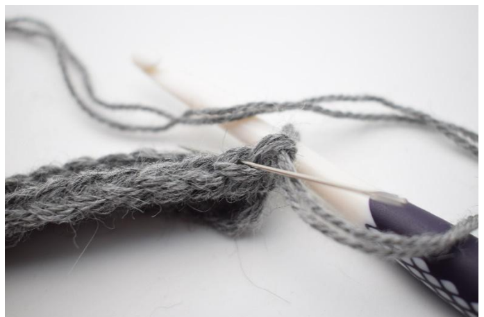
2. Haak 1 hstk Al. De naald markeert de lus waarin gehaakt wordt.