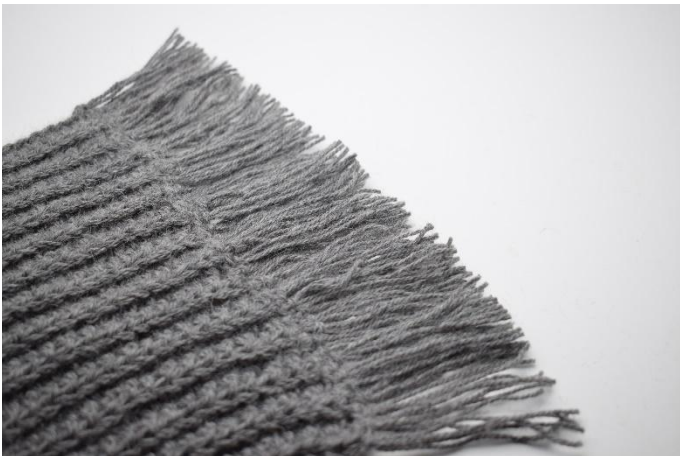
9. Herhaal bovenstaande aan de andere kant van de sjaal.