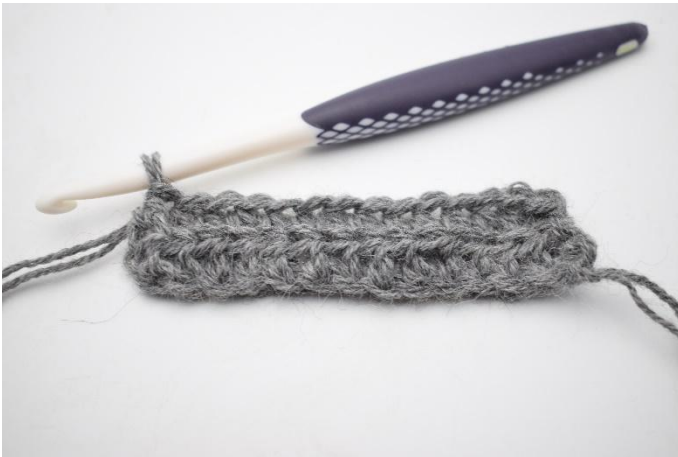
5. Zoals hier.