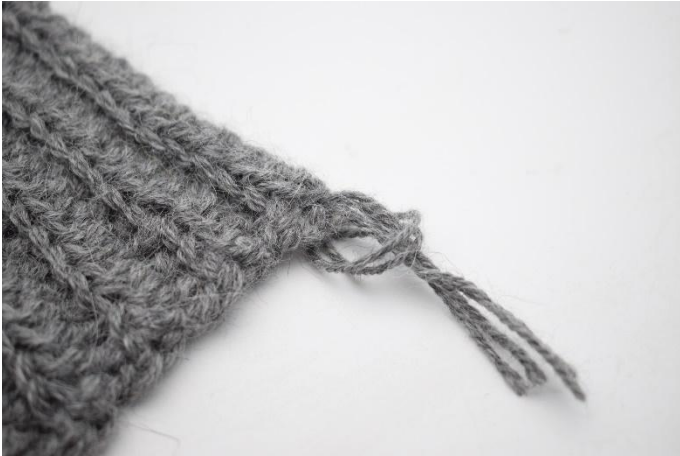
5. Trek de uiteinden door de lus.