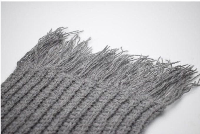
7. Herhaal langs de hele rand.