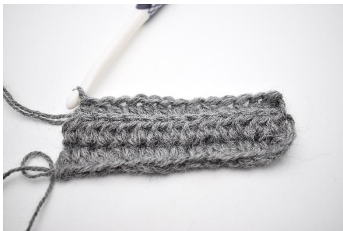
4. Herhaal tot het einde van de rij. Haak de laatste hstc door beide lussen.