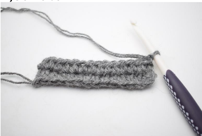
1. Herhaal zoals rij 2. Keer met 1 l.