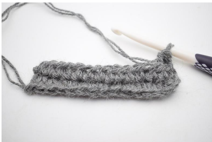
3. Zoals hier.