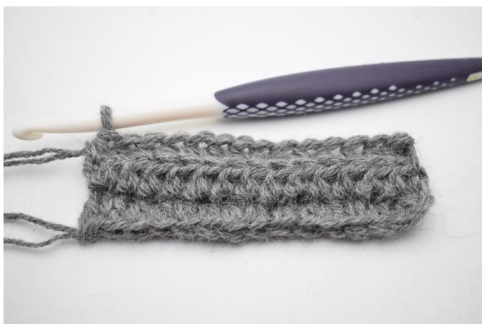
5. Zoals hier.