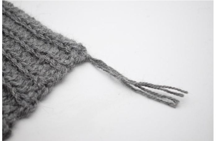
6. Trek de draden niet te strak aan.