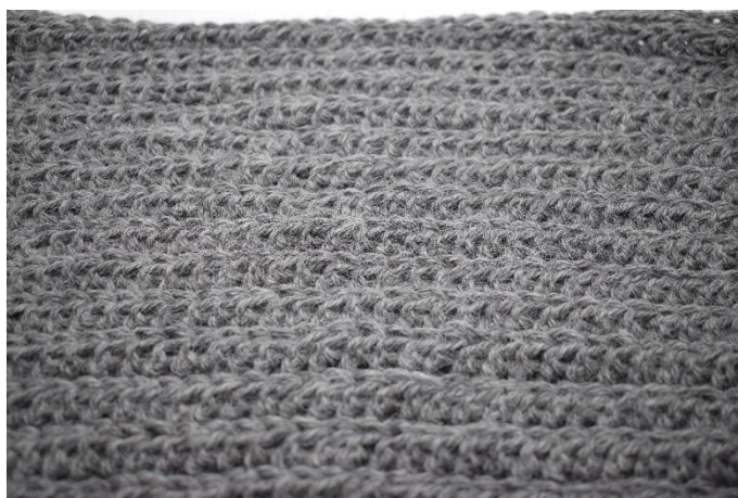
6. Herhaal rij 2 in totaal 27 keer.