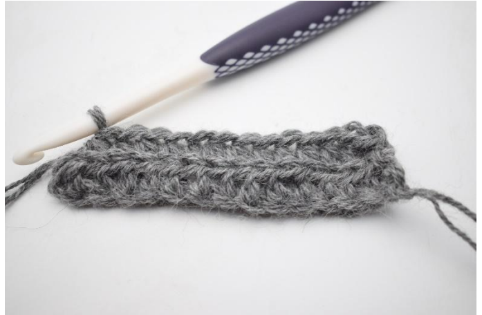
4. Haak 1 hstk Al in alle steken. Haak in de laatste s 1 hstk door beide lussen, om gaten aan de rand te voorkomen.