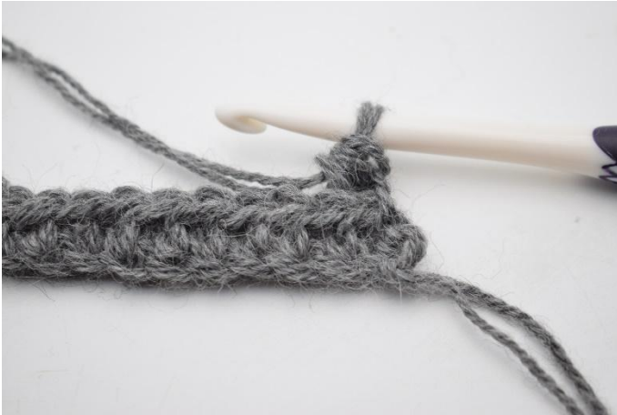
3. Zoals hier.