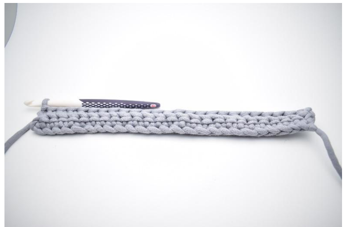
6. Herhaal de rij uit.