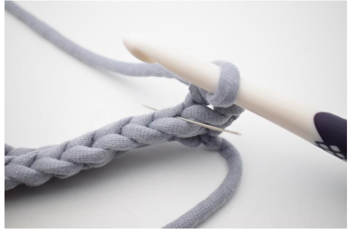
4. Haak 1 v in A1 van de volgende s. De naald markeert de lus waar in de v gehaakt wordt.