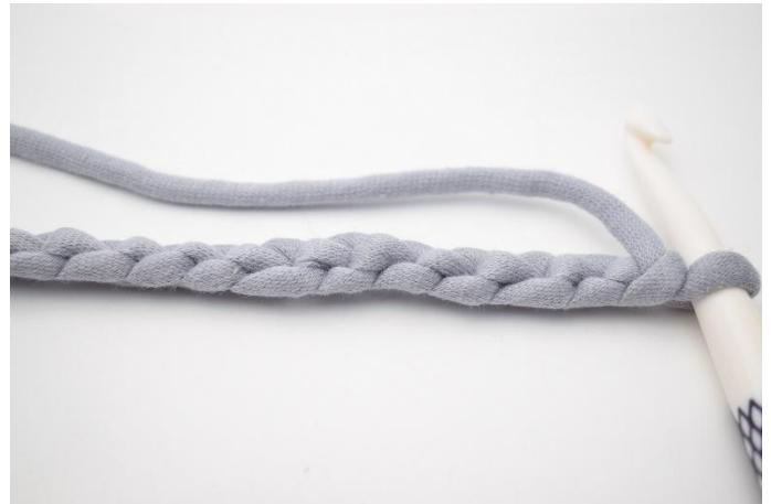
2. Draai l-rij zodat de achterkant naar boven wijst.