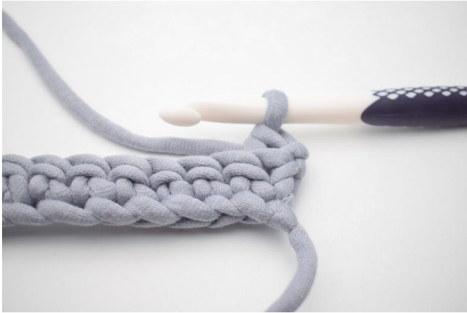
3. Zoals hier.