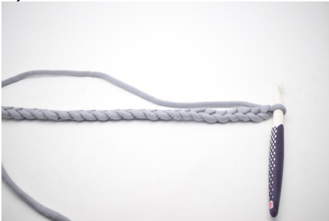
1. Zet l op.