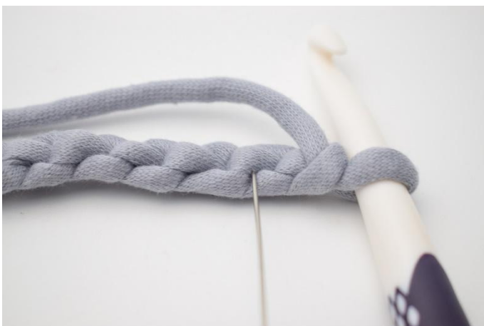
3. Om een mooiere kant te krijgen, kan je de v haken in de horizontale lussen. De naald markeert de lus waarin de eerste v gehaakt wordt.