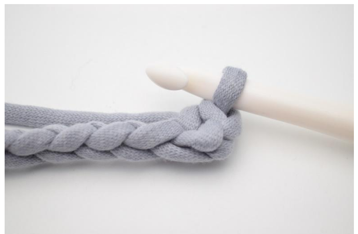
4. Zoals hier.