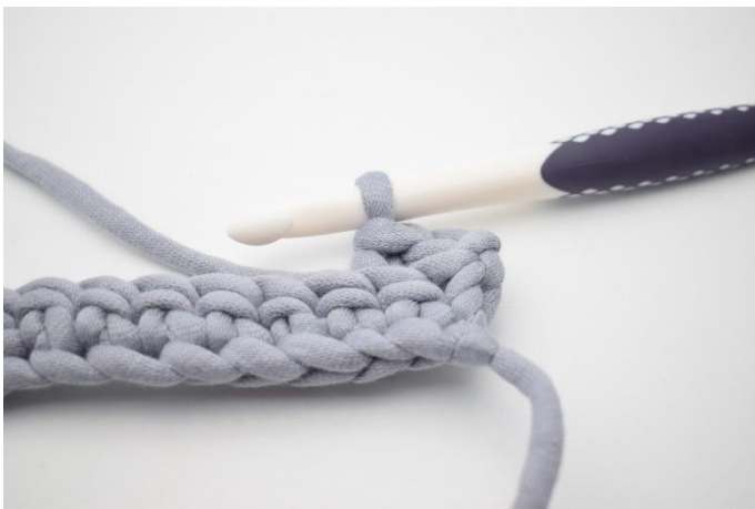
5. Zoals hier.