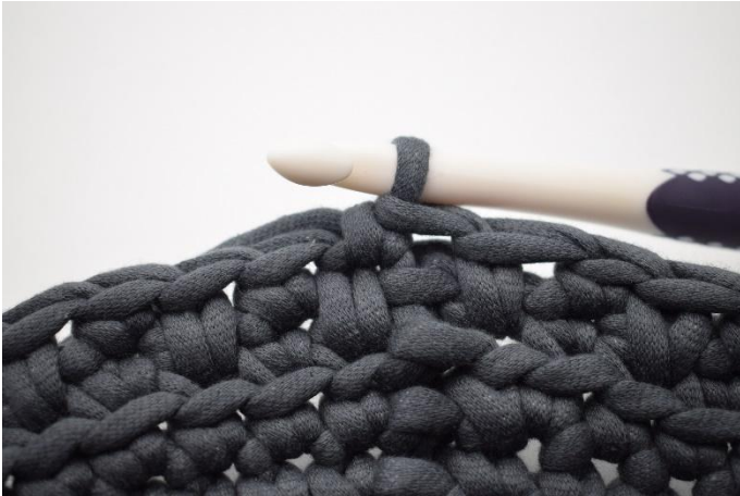
13. Haak 1 v in de volgende s.