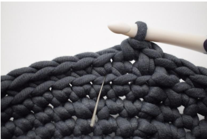
9. Haak 1 dv. De naald markeert waar de dv gehaakt wordt.