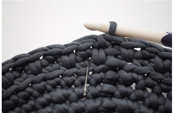
14. Haak 1 dv. De naald markeert waar de dv gehaakt wordt.