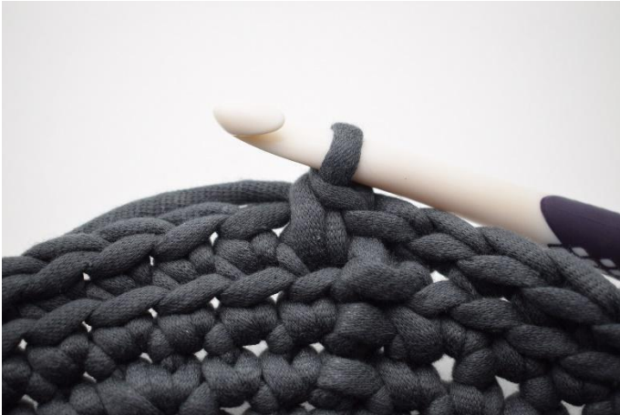
7. Zoals hier. Er is nu 1 dv gehaakt.