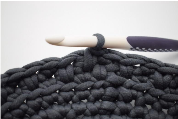
15. Zoals hier.