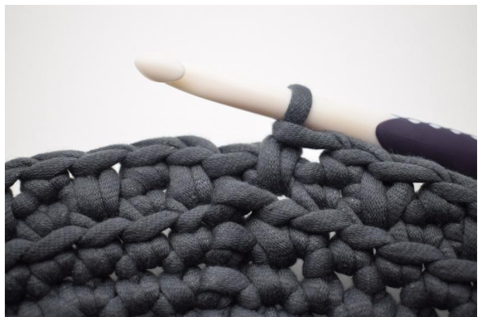
12. Herhaal "1 dv, 1 v" tot het einde van de toer. Sluit af met 1 dv.