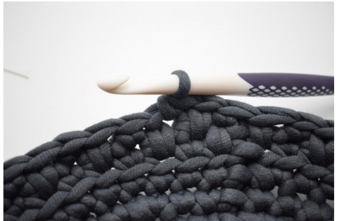
16. Haak 1 v.