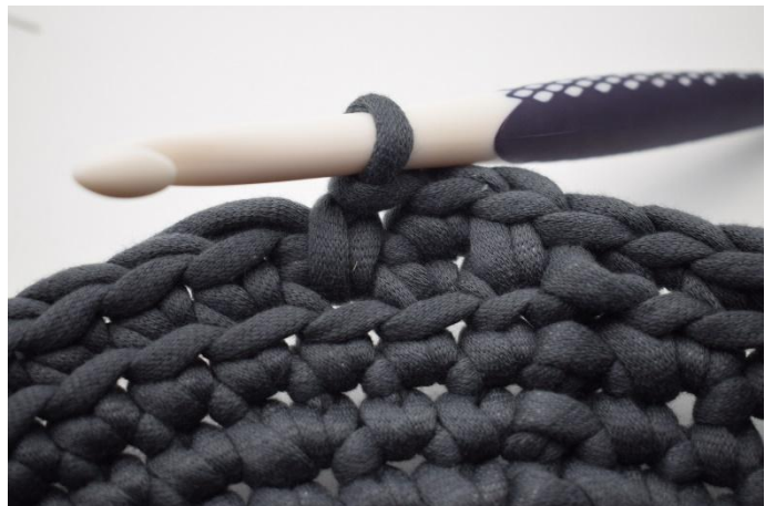
10. Zoals hier. Er is nu 1 dv gehaakt.