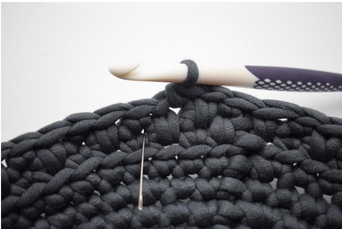
17. Haak 1 dv. De naald markeert waar de dv gehaakt wordt.