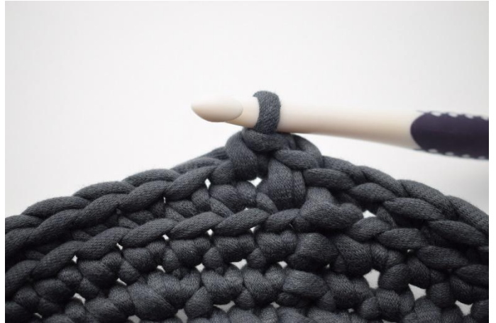
8. Haak 1 v in de volgende s.