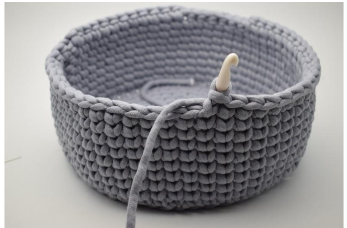
4. Haak Ks in de volgende 21 steken.