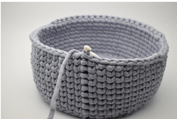
7. Haak Ks in de laatste 10 steken. Sluit met 1 Hv.