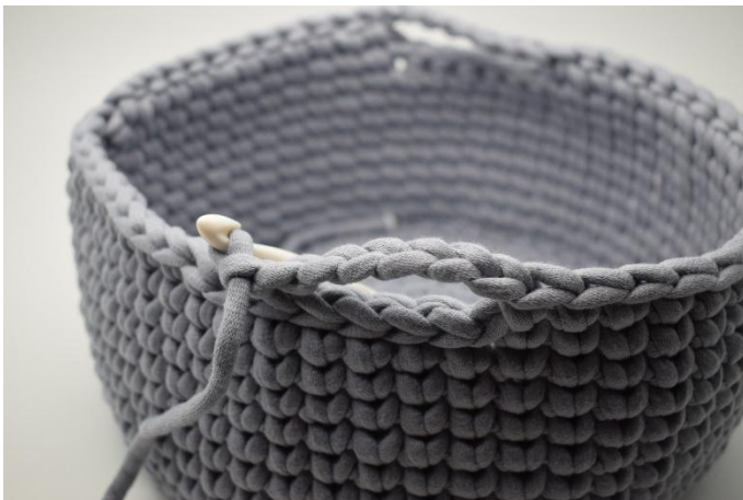
5. Haak 7 L, sla de 6 Hv over.