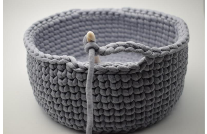
2. Haak 7 L. Sla de 6 Hv over.