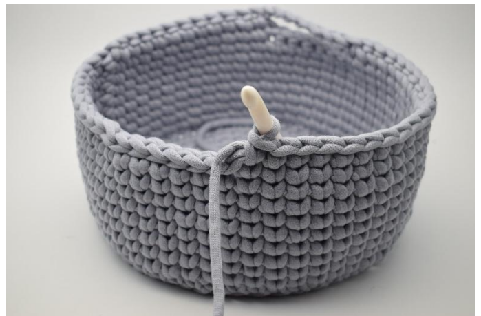
4. Haak Ks in de volgende 21 steken.