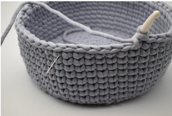
5. Haak nu Hv over de volgende 6 steken.