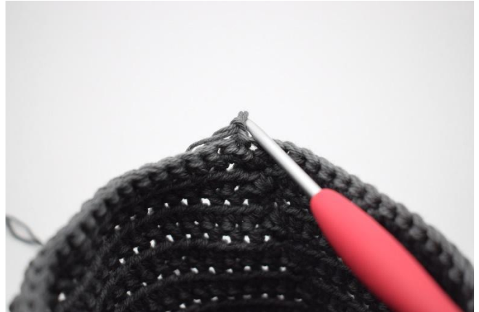
10. Keer/draai de mand, zodat je vanaf de binnenkant haakt.