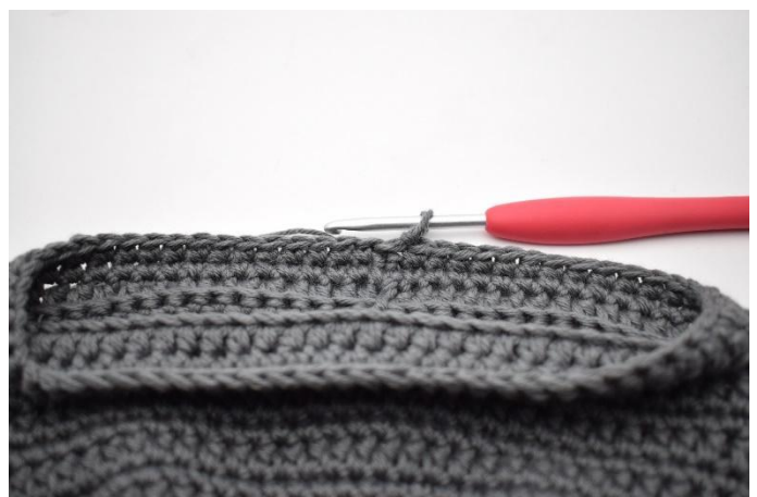
14. Haak 1 l en haak 1 v in iedere s tot het einde van de toer. Sluit af met 1 hv.