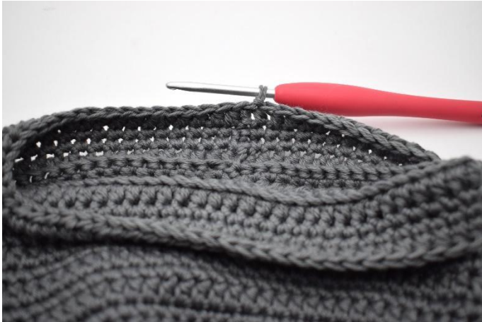
15. Haak 1 l en haak 1 hstm in iedere s tot het einde van de toer. Sluit af met 1 hv.