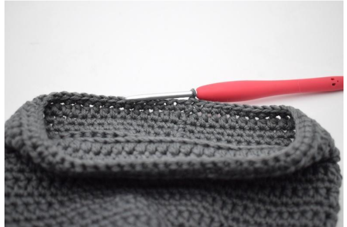
16. Haak 1 l en haak 1 v in iedere s tot het einde van de toer. Sluit af met 1 hv.