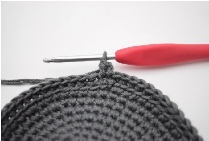
5. Haak 1 hstk.