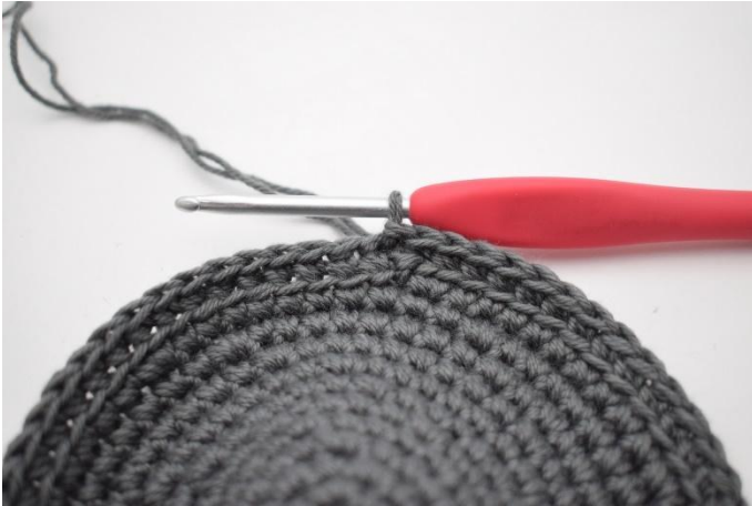
3. Haak 1 v in de achterste lus van iedere steek tot het einde van de toer en sluit af met 1 hv.