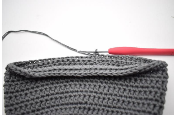
12. Sluit af met 1 hv.