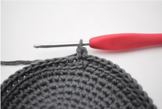
5. Haak 1 hstk.