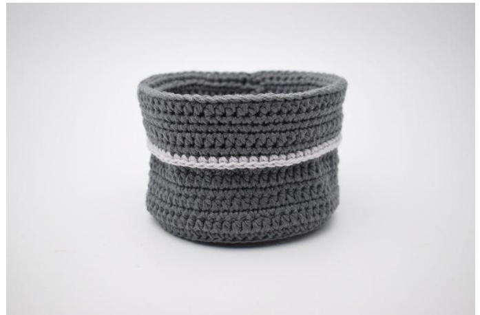
14. Vouw de rand om naar buiten en monteer de ophanglus.