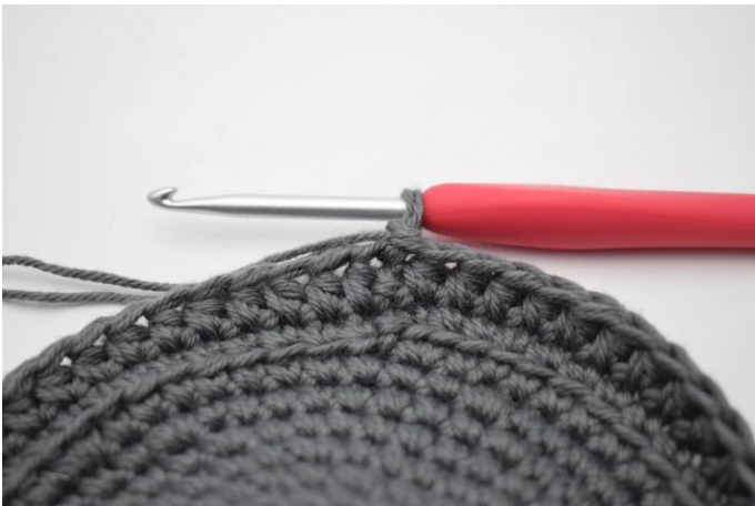
7. Haak 1 l.