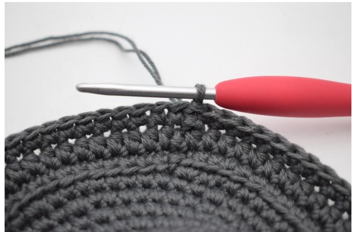
8. Haak 1 v in iedere s tot het einde van de toer en sluit af met 1 hv.