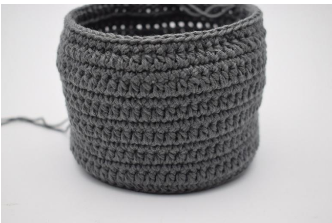
9. Herhaal deze 2 toeren zoals beschreven in het patroon.