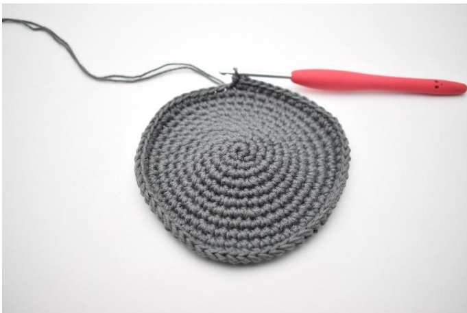
1. Hier is de bodem klaar en afgesloten met 1 hv.