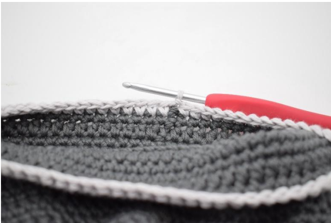
13. Wissel naar een contrastkleur. Haak 1 l en haak 1 v in iedere s tot het einde van de toer. Sluit af met 1 hv. Knip de draad en hecht af.