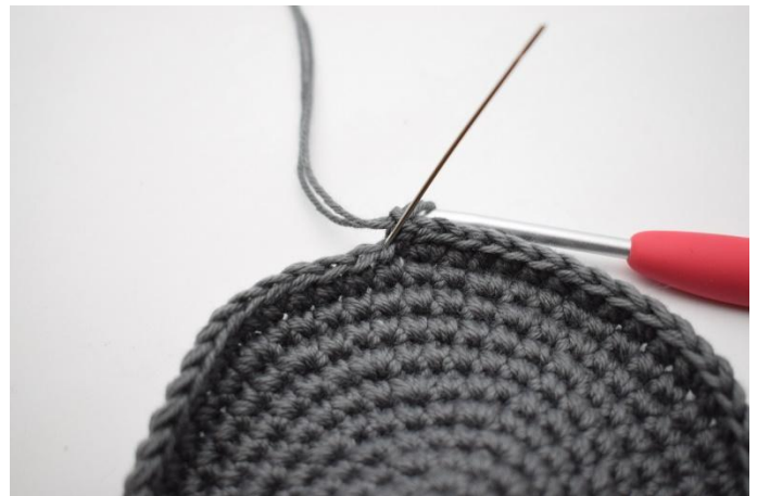
2. Haak 1 l, haak nu v in de achterste lus. De naald markeert de achterste lus.