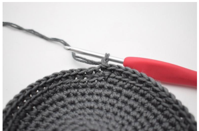
4. Haak 1 l.