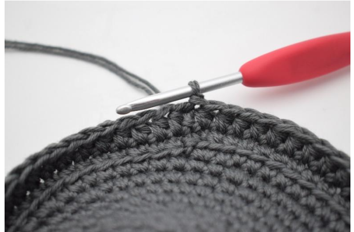
6. Haak 1 hstk in iedere s tot het einde van de toer en sluit af met 1 hv.