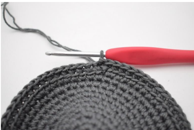
3. Haak 1 v in de achterste lus van iedere steek tot het einde van de toer en sluit af met 1 hv.