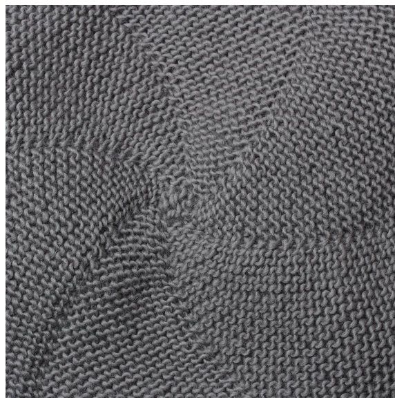
Mand na het wassen