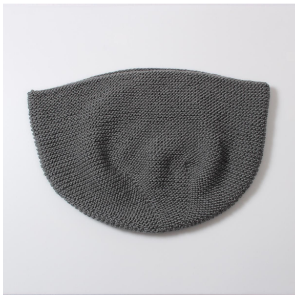
Mand voor het wassen

Was de mand in de wasmachine op 60 graden. Breng nat in model.