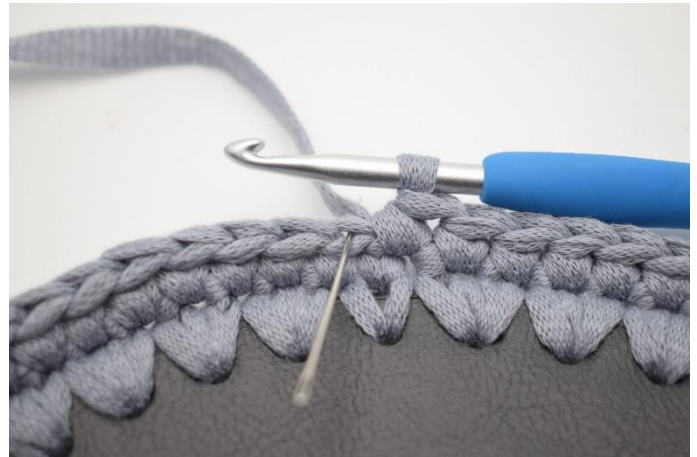
4. Nu haak je V in Avl. De naald markeert waar je moet haken.