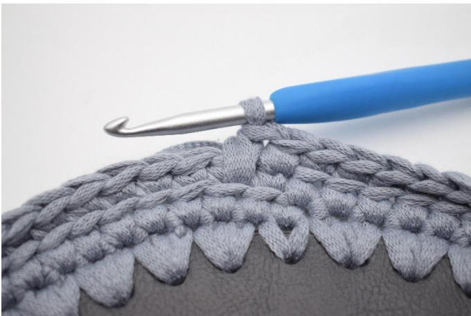
9. Zodanig. Nu is er 1 V en 1 Vv gehaakt.