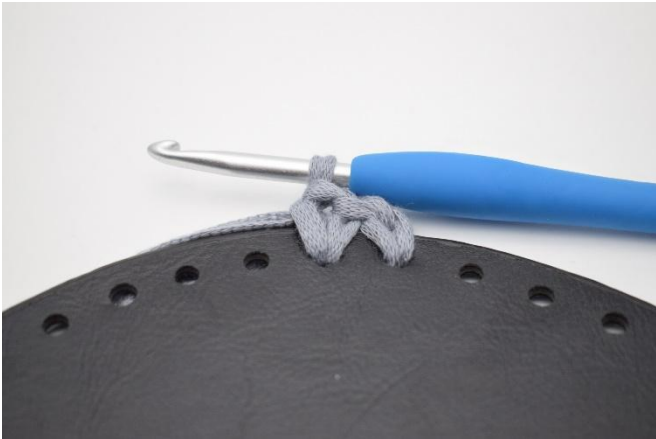
1. Haak V rond de bodem in alle gaatjes zoals beschreven in het patroon.