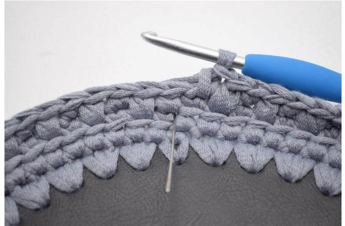
14. Nu haak je om en om Vv en V. Haak 1 Vv in de volgende steek. De naald markeert waar je haakt.