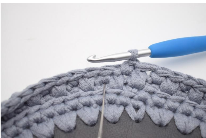
17. Haak 1 Vv in de volgende steek. De naald markeert waar je moet haken.