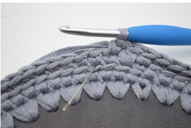
11. Haak 1 Vv in de volgende steek. De naald markeert waar je haakt.