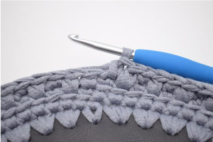
13. Ga verder met V en Vv tot het einde van de toer. Sluit de toer af met 1 V.