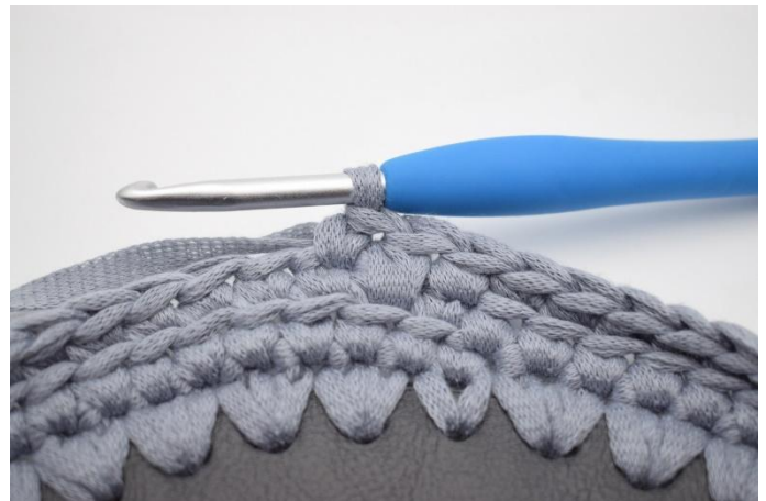
10. Haak 1 V in de volgende steek.