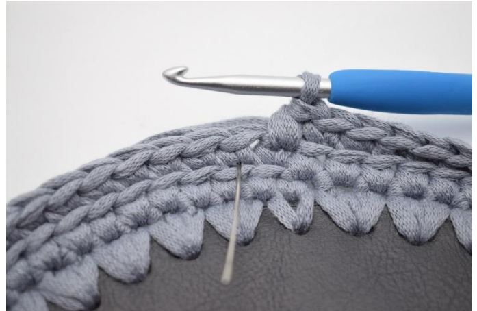
8. Haak 1 Vv in de volgende steek. De naald markeert waar je de Vv moet haken.