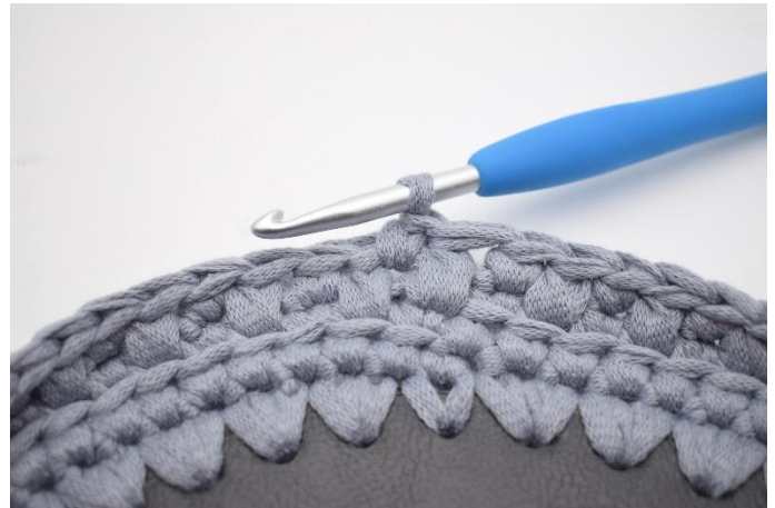
16. Haak 1 V in de volgende steek.