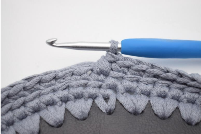
7. Nu haak je om en om V en Vv. Start met een V.