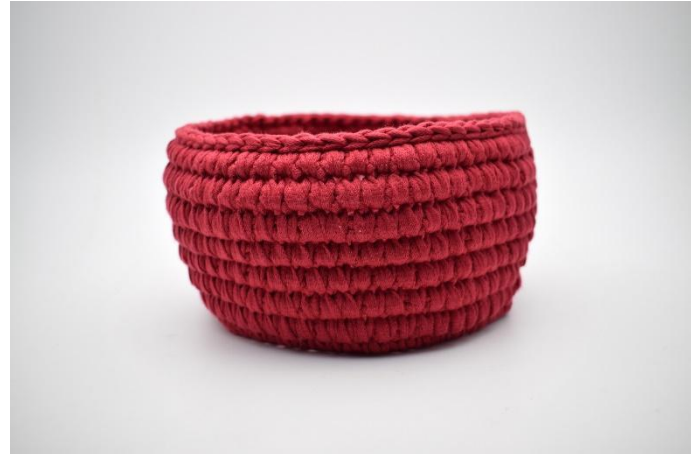
14. Herhaal de toeren zoals beschreven in het patroon. Sluit af met een toer Hv.