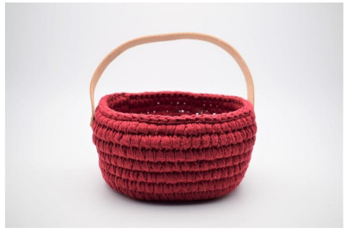
16. Zet het hengsel aan de mand met klinknagels die je makkelijk vast maakt met een hamer.