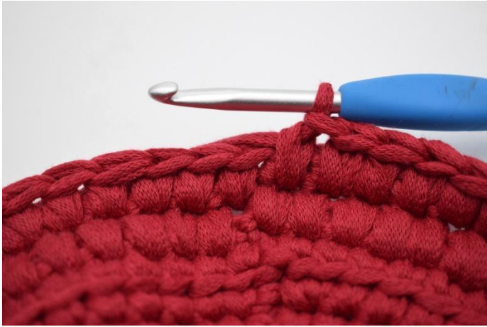
13. Herhaal Vv de gehele toer.