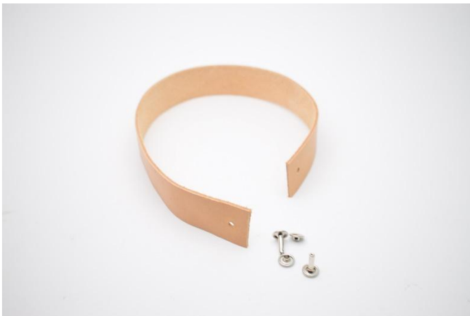
15. Knip het leer op maat. Maak gaatjes voor de klinknagels.