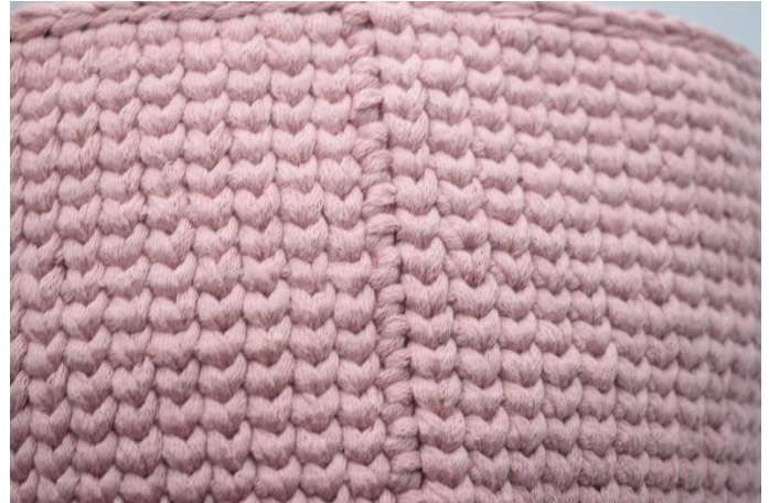
22. Herhaal zoals beschreven in het patroon. Sluit af met 1 toer Hv. Het sluiten van de toer ziet er zo uit.