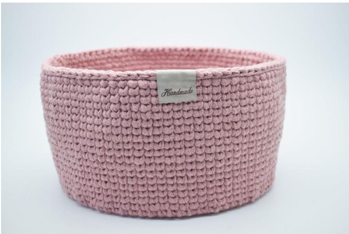
23. Naai of lijm evt. een mooi "Handmade" label vast. Het label is over de rand van de mand gevouwen.