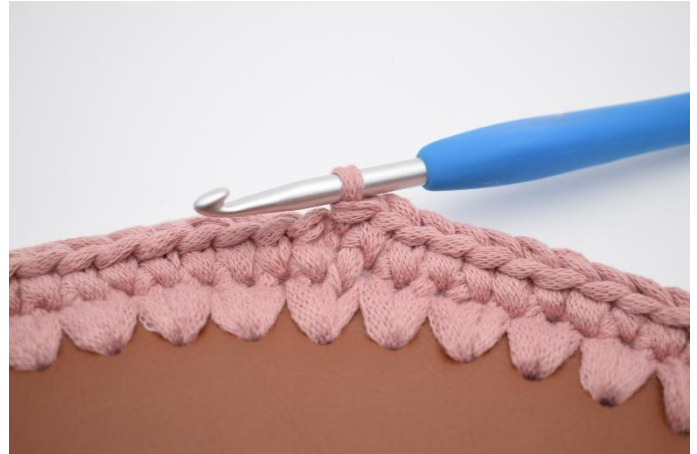
4. Sluit de toer met 1 Hv.