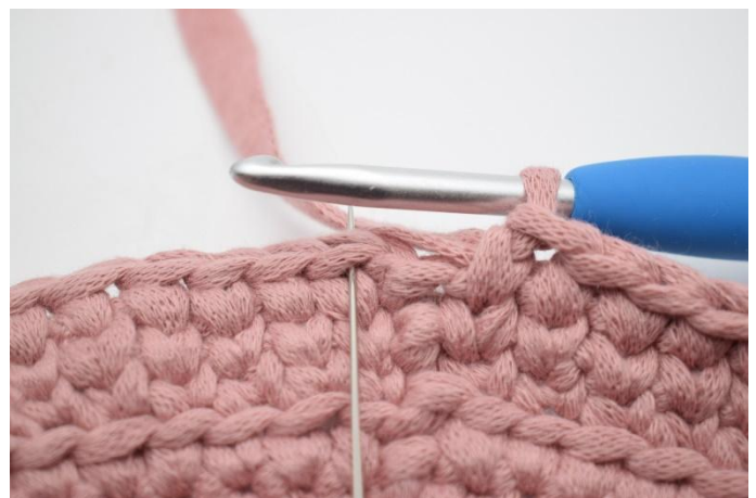
20. Sluit met 1 Hv in de 1e steek van de toer.