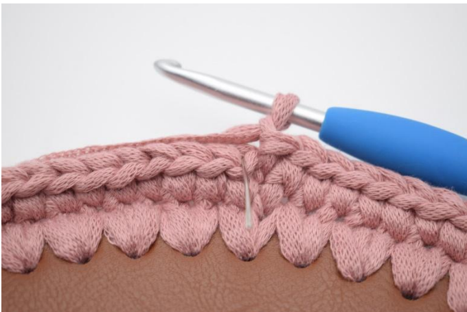
5. Haak 1 L. Nu haak je V in de Al. De naald hier markeert waar je moet haken.