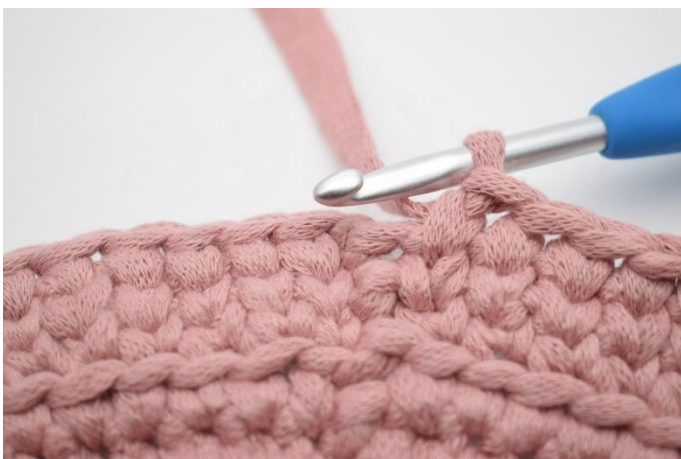
19. Herhaal dit de hele toer.