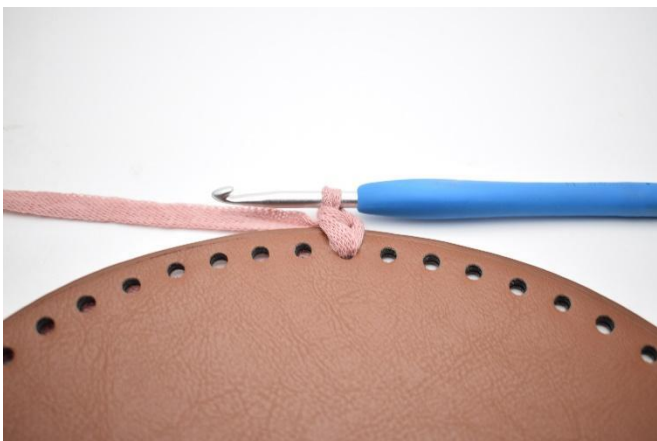
1. Haak V rond in alle openingen zoals beschreven in het patroon.