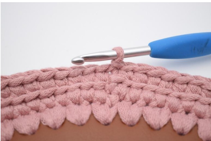
7. Herhaal de hele toer en sluit met 1 Hv.