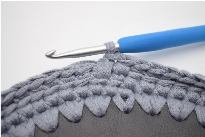
9. Zodanig. Nu heb je 1 V en 1 Vv..