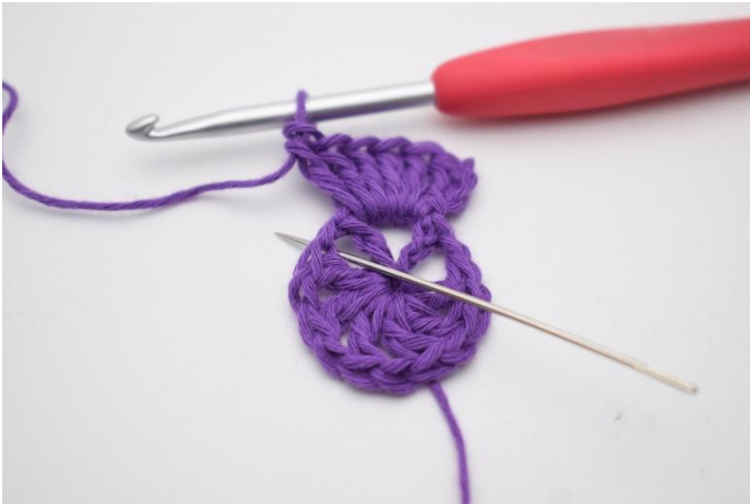
5. In de volgende losseruimte haak je 1 V.