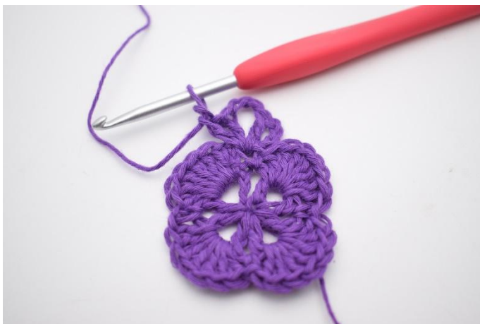
5. Haak 1 Stk, 1 L en 1 Stk in dezelfde steek. Nu is er weer een V-steek gemaakt met 3 L er tussen. Dit is een hoek.