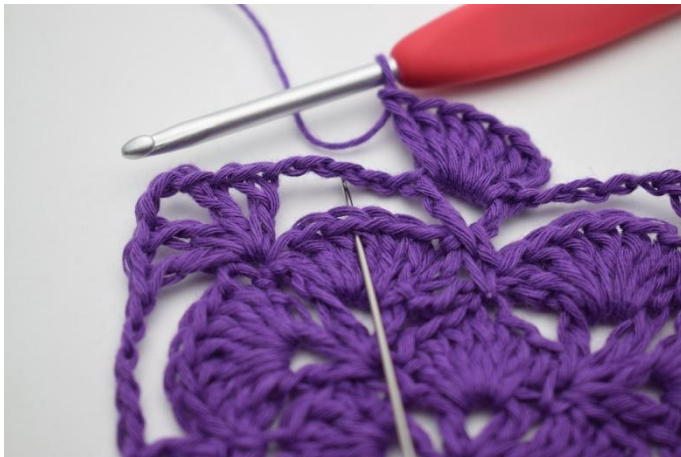
3. Nu moet de grote L-boog vastgezet worden . Dit doe je door 1 V in het 4e Stk van de waaier van de vorige toer te haken.