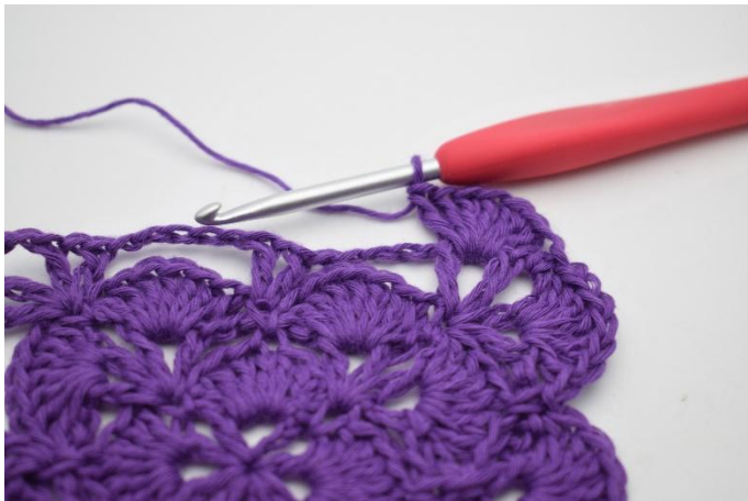
9. Zodanig. Nu heb je 2 waaiers gehaakt in de 1e hoek.