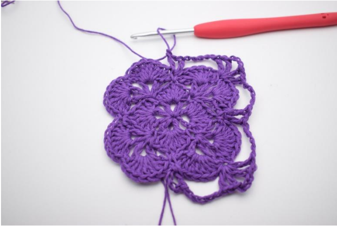
13. Haak 5 L. In de volgende V haak je 1 Stk, 1 L en 1 Stk. Dit is een V-steek.