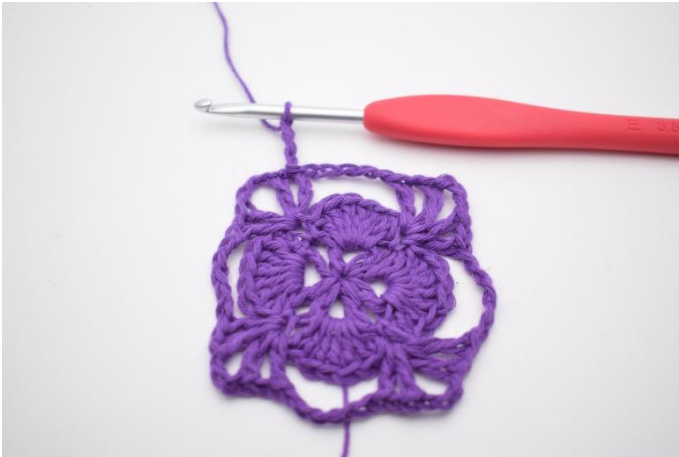
1. Haak 3 L.