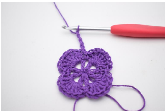
1. Haak 4 L.