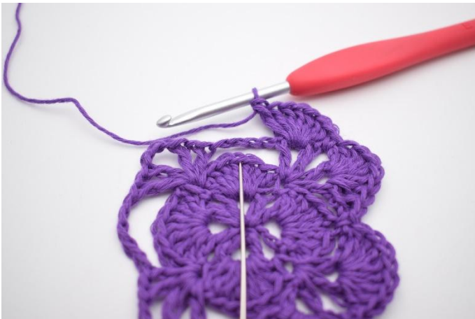
15. Nu moet de grote L-boog vastgezet worden. Dat doe je door 1 V te haken in het 4e Stk van de waaier van de vorige toer. De naald markeert waar je de V moet haken.