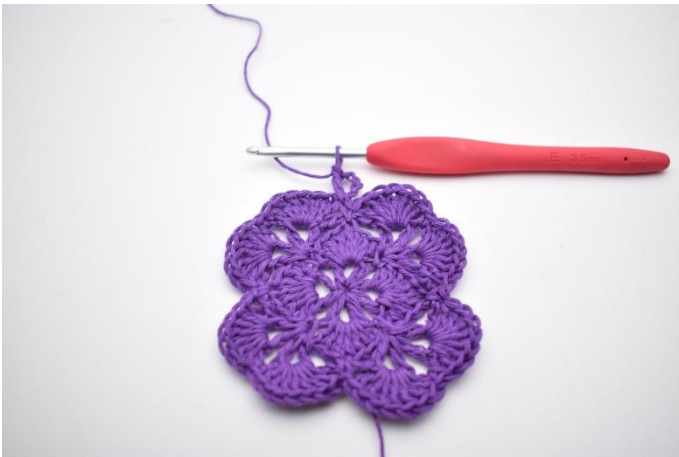
3. Nu is er 1 V-steek gemaakt.