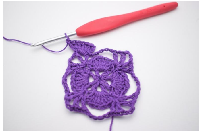
2. Haak 6 Stk in de 1e losseruimte van de V-steek van de vorige toer.