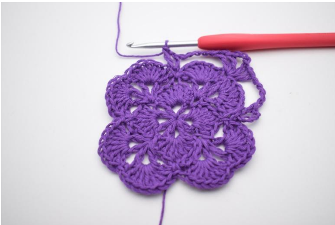
9. Nu heb je 1 V-steek gemaakt.