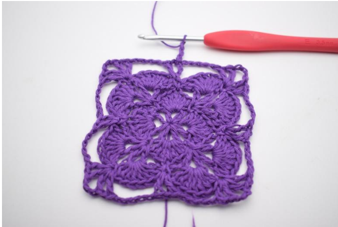
1. Haak 3 L.