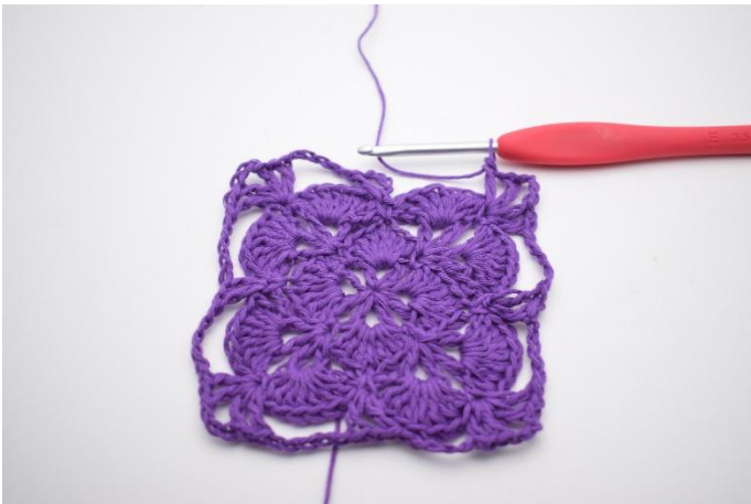
15. Herhaal tot het einde van de toer.