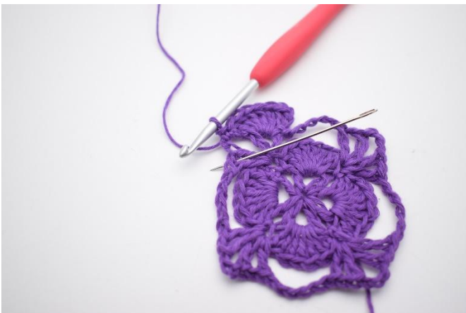
5. In de volgende V-steek haak je 7 Stk.