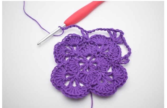
10. Haak 5 L.