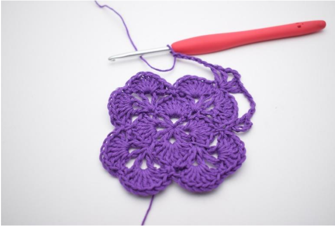
7. Haak 5 L.