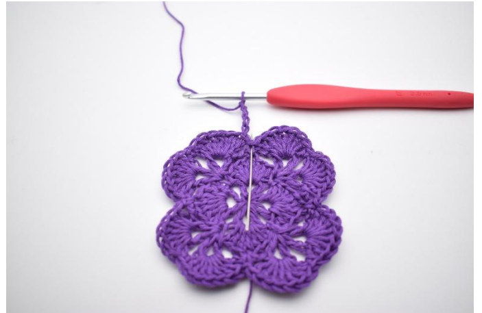
2. In de V ernaast haak je 1 Stk.