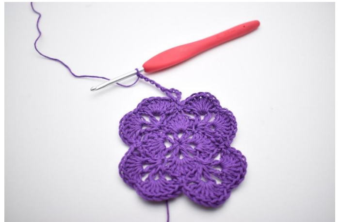
4. Haak 5 L.