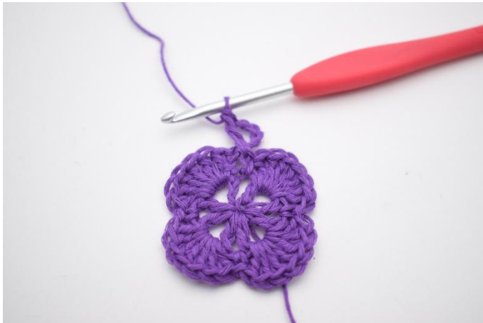
3. Zodanig. Nu is er 1 V-steek gemaakt.