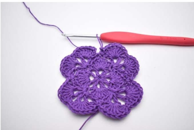
17. Herhaal tot het einde van de toer.