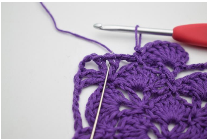
5. Nu haak je waaiers in de 1e hoek. In de volgende V-steek haak je 7 Stk.