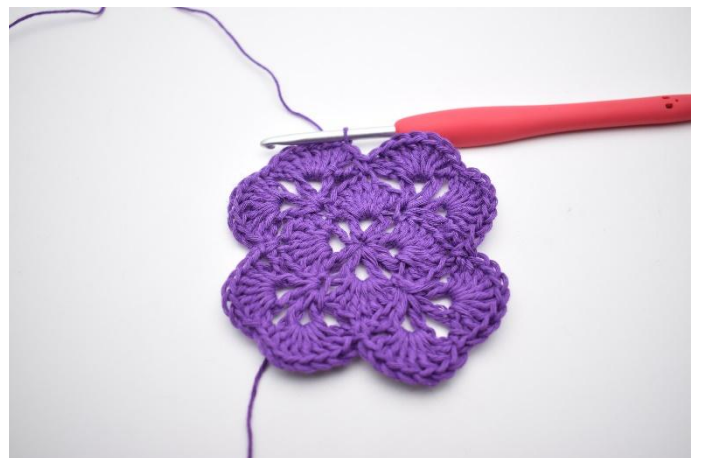
18. Sluit met 1 Hv in de bovenste van de 3 L van het begin.