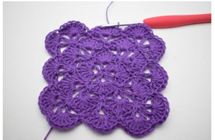
16. Sluit met 1 Hv in de bovenste van de 3 L van het begin.