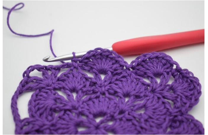
14. Zodanig. Nu is er een waaier gehaakt in de V-steek van de zijkant..