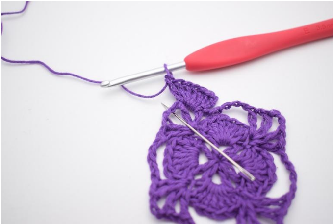
3. In de L-boog haak je 1 V.