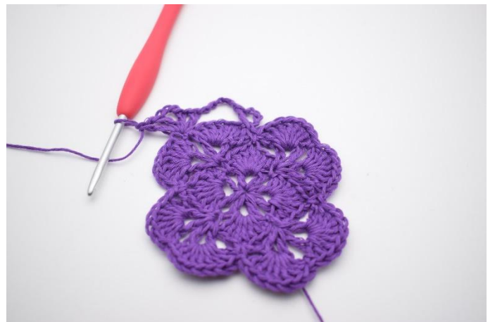
6. Zodanig. Nu zijn er 2 V-steken gemaakt met 3 L er tussen, dat is een hoek.