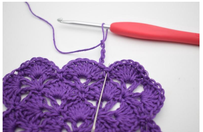
2. In de V er naast haak je 1 Stk.