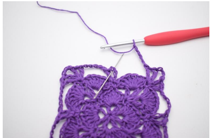
16. Haak 5 L, en sluit met 1 Hv in de losseruimte van de 1e V-steek.