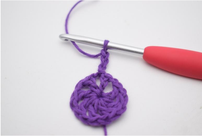
3. Haak 3 L, haak 6 Stk in de losseruimte.