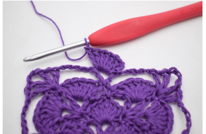
2. Haak 6 Stk in de 1e V-steek.