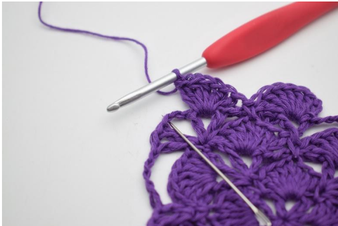
7. In de losseruimte haak je 1 V.