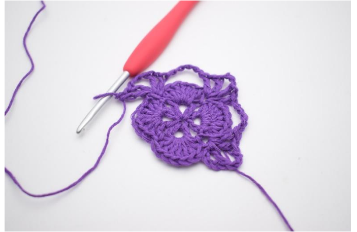
10. In de volgende V haak je 1 Stk, 1 L, 1 Stk, 3 L, 1 Stk, 1 L en 1 Stk. Er is weer een hoek gemaakt.