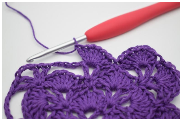
12. In de volgende V-steek haak je 7 Stk.