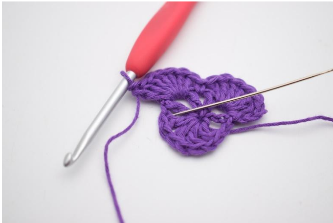
9. In de volgende losseruimte haak je 1 V.