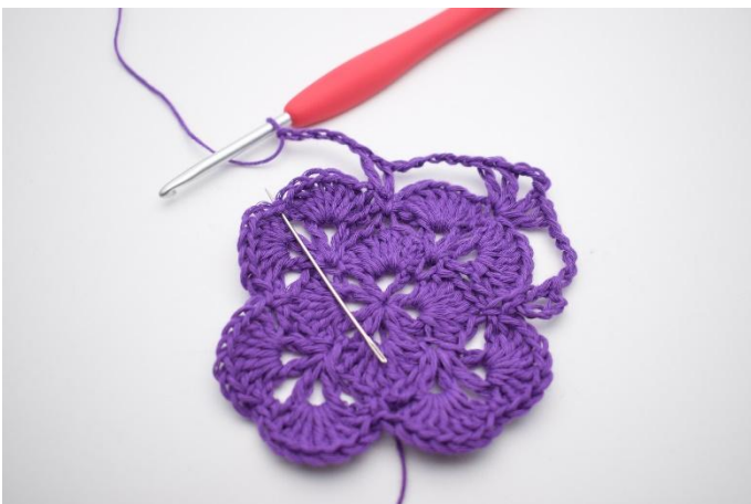
11. In de volgende V haak je 1 Stk, 1 L, 1 Stk, 3 L, 1 Sk, 1 L en 1 Stk.