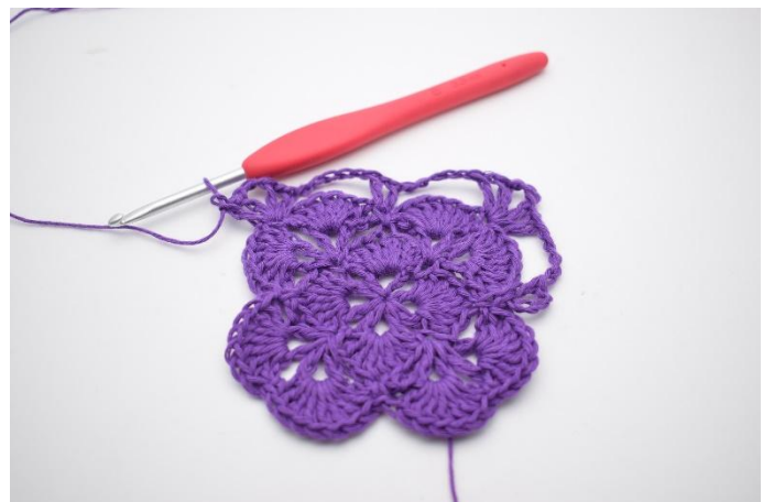
12. Zodanig. Nu zijn er 2 V-steken gemaakt met 3 L er tussen, en dat is weer een hoek.