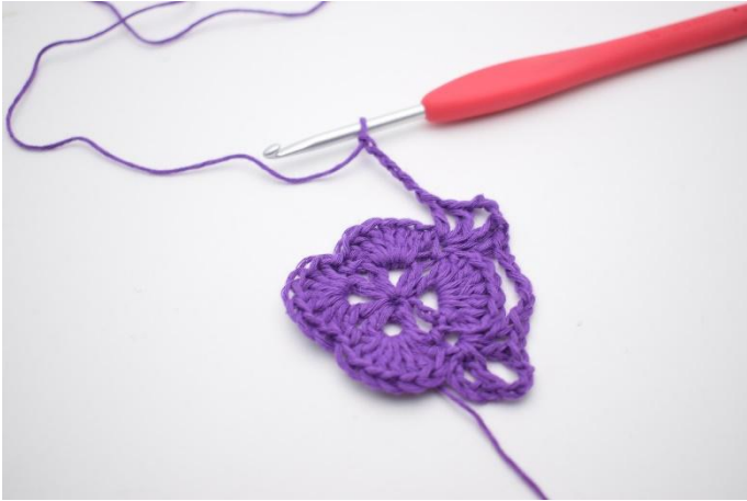
9. Haak 5 L.