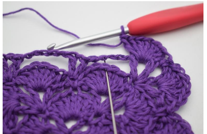
10. De volgende grote L-boog moet nu vastgezet worden. Haak 1 V in het 4e Stk van de waaier van de vorige toer.