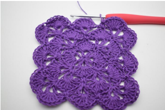
15. Herhaal tot het einde van de toer.