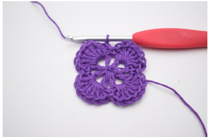
12. Sluit af met 1 Hv in de bovenste van de 3 L.