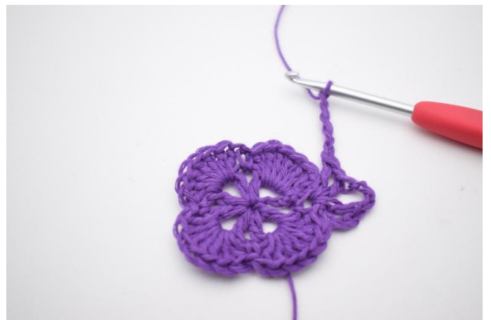
6. Haak 5 L.