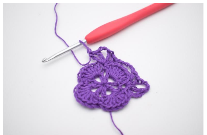
8. Zodanig. Nu zijn er 2 V-steken gemaakt met 3 L er tussen, en is er weer een hoek gemaakt.