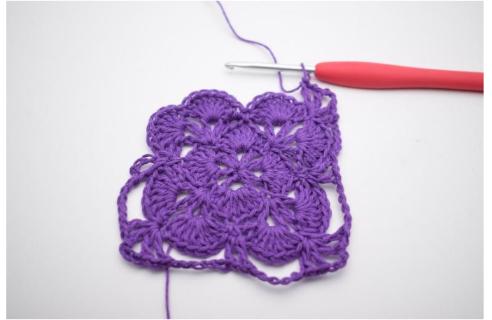
14. Haak 5 L, in de volgende V haak je 1 Stk, 1 L, 1 Stk, 3 L, 1 Stk, 1 L en 1 Stk. Dit is weer een hoek