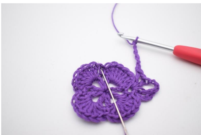
7. In de volgende V haak je 1 Stk, 1 L, 1 Stk, 3 L, 1 Stk, 1 L en 1 Stk.