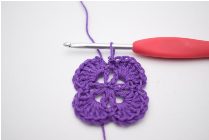
11. Herhaal tot het einde van de toer.