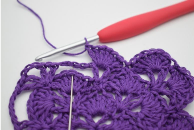
13. De volgende L-boog moet vastgezet worden. Haak 1 V in het 4e Stk van de waaier van de vorige toer