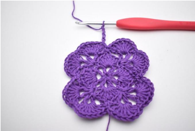
1. Haak 4 L.