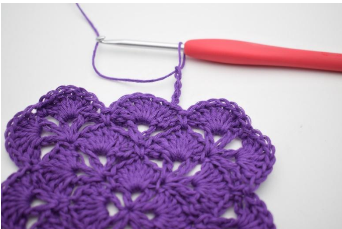
1. Haak 4 L.