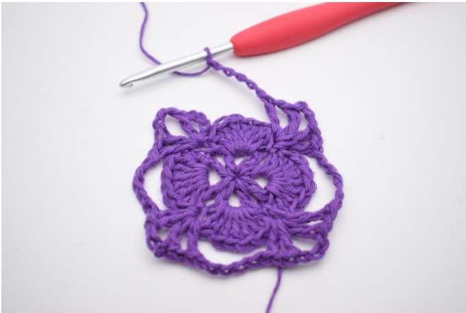
11. Herhaal tot het einde van de toer.