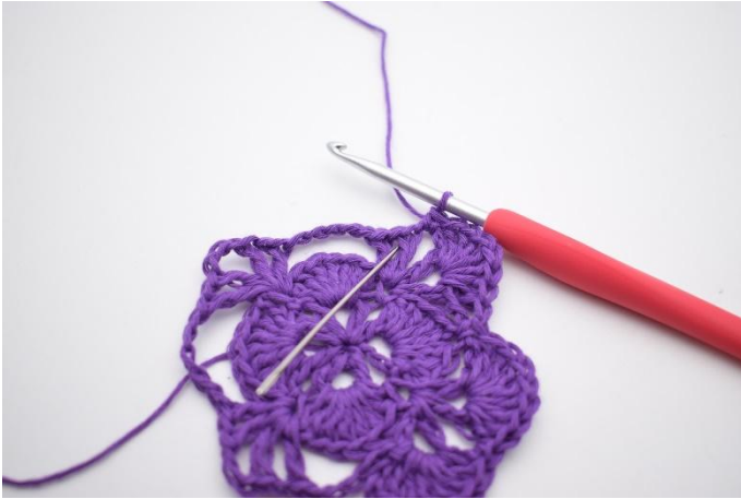
13. In de volgende V-steek haak je 7 Stk.