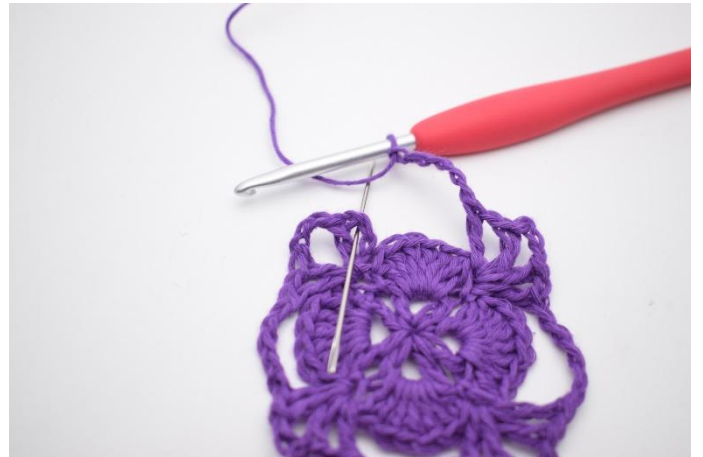
12. Sluit met 1 Hv in de losseruimte van de 1e V-steek.