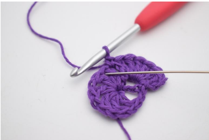
7. In de volgende losseruimte haak je 7 Stk.