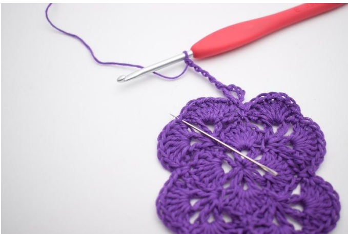
5. In de volgende V haak je 1 Stk, 1 L, 1 Stk, 3 L, 1 Stk, 1 L en 1 Stk.