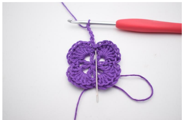
2. In de V ernaast haak je 1 Stk.