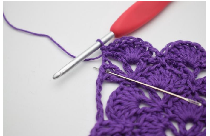
8. In de volgende V-steek haak je 7 Stk.