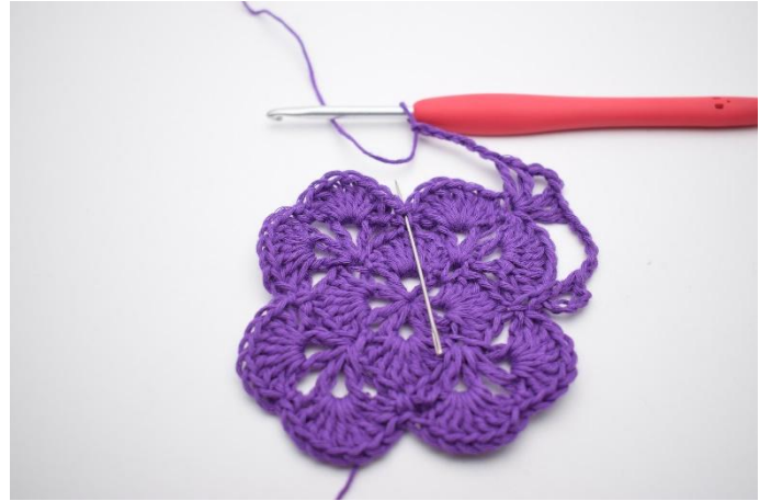
8. In de volgende V haak je 1 Stk, 1 L en 1 Stk..