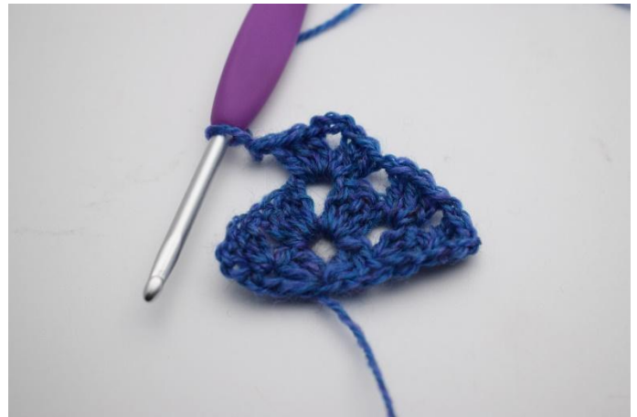
12. Haak *1 Stk gr, 3 L, 1 Stk gr in de L-boog*.