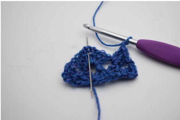
11. Haak 1 L. Nu haak je in de L-boog (punt van de sjaal).