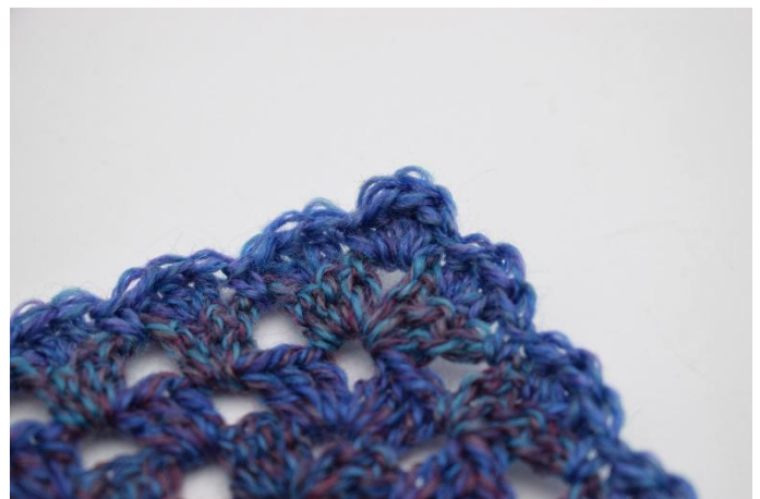
12. Herhaal nu "Sla 1 steek over, haak 3 Stk in de middelste steek van het Stk gr. Sla 1 steek over en haak 1 V in de losseruimte" tot het einde van de toer. Knip het garen af en hecht af.