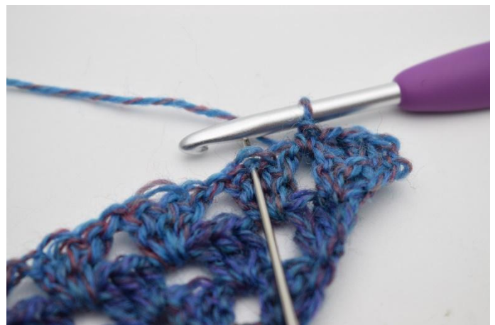
6. Sla 1 steek over, haak 3 Stk in de middelste steek van het Stk gr.