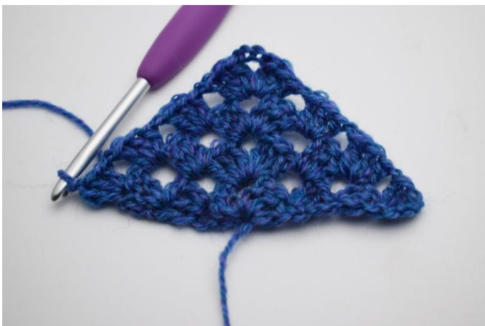
17. Herhaal dit. Haak 3 L (vervangen 1e Stk) Haak 2 Stk in de 1e steek en haak 1 L. Haak *1 Stk gr en 1 L* in elke losseruimte. In de punt haak je *1 Stk gr, 3 L, 1 Stk gr, 1 L*. Herhaal dit aan de andere kant, en sluit af met 1 Stk gr in de 3e L van de vorige toer.