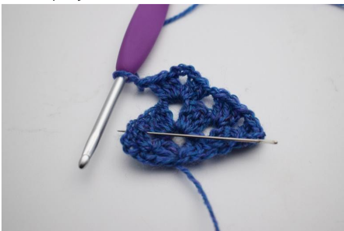
13. Haak 1 L, nu haak je in de volgende losseruimte