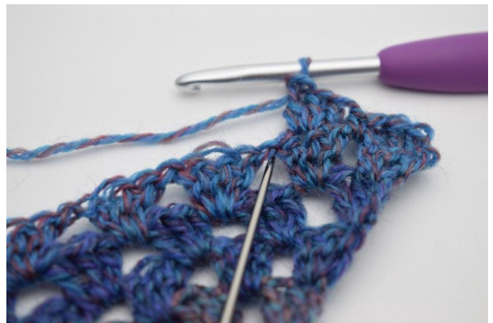
8. Haak 1 V in de losseruimte.