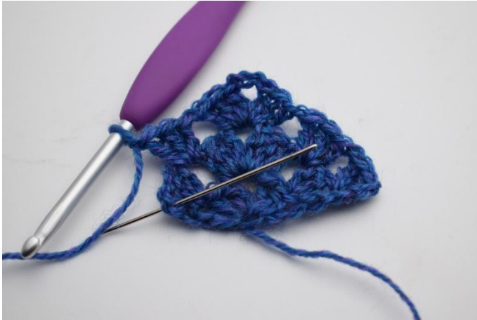
15. Haak 1 L. Nu haak je in de 3e L van de vorige toer.