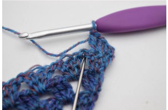
4. Haak 1 V in de losseruimte.