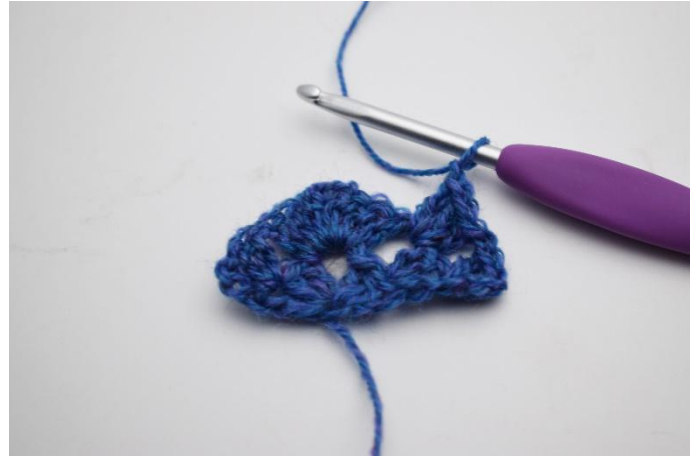
10. Haak 1 Stk gr in de volgende losseruimte.