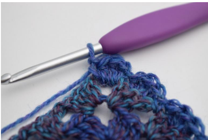
11. Haak 1 V, 3 Stk en 1 V in de L-boog.