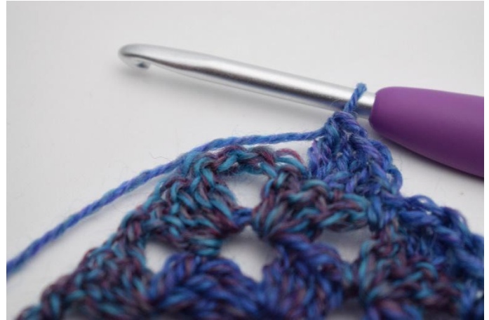
10. Herhaal tot de punt.