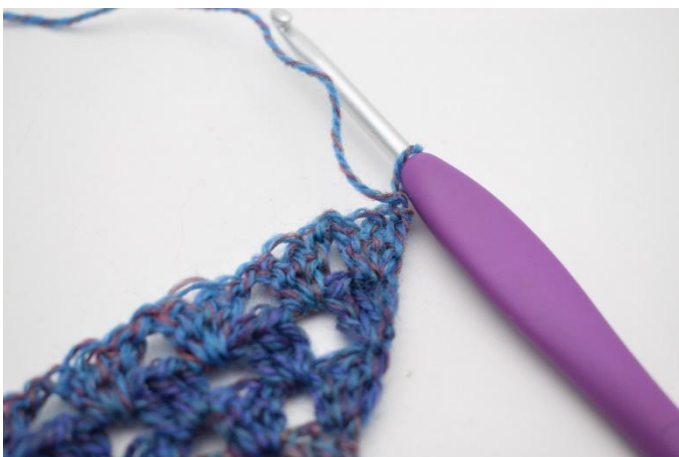
1. Keer met 1 L.