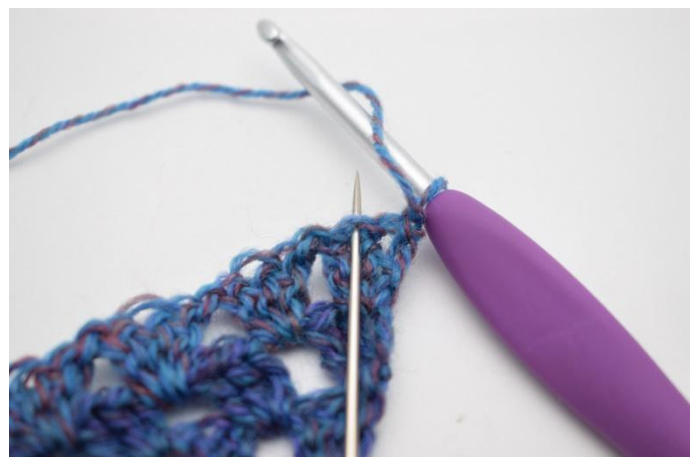
2. Sla 1 steek over, haak 3 Stk in de middelste steek van het Stk gr.