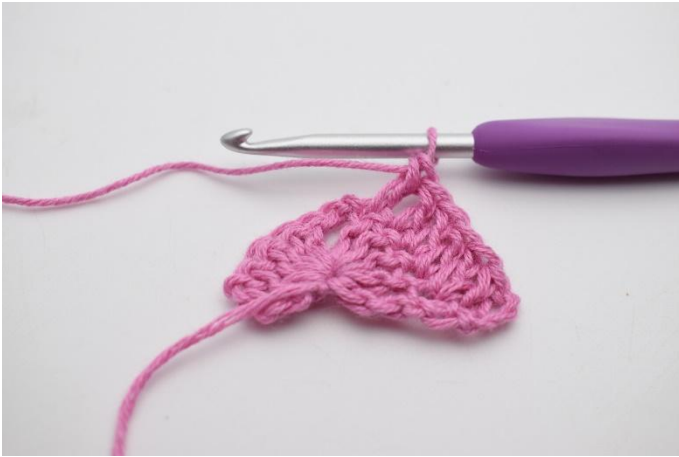
3. Haak 1 Stk in de volgende 4 steken.