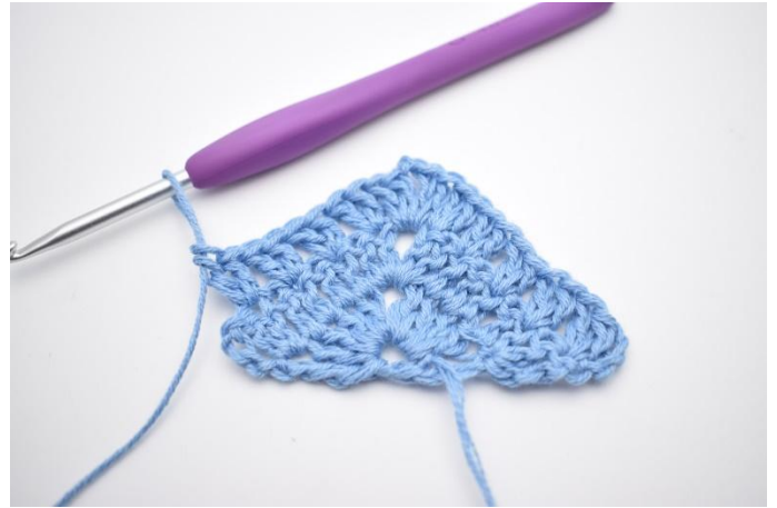
6. Herhaal "tot" in totaal 4x.