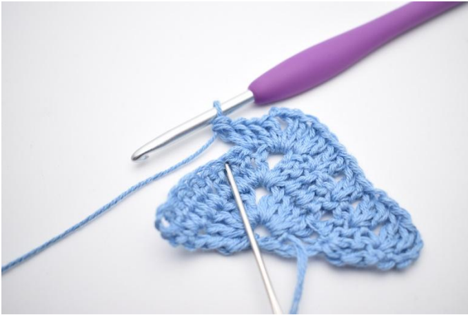
5. Haak "2 Stk, sla 1 steek over".