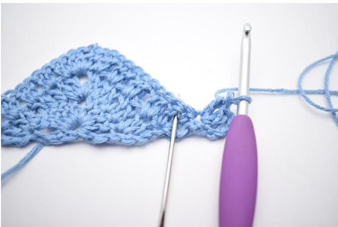
1. Keer het werk met 4 L (vervangen 1 Dbstk). Haak 2 Stk in de 1e steek. "Haak 2 Stk tussen 2 Stk van de vorige toer". De naald markeert de 1e stokjes waar tussen je haakt..