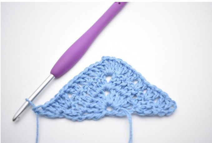
7. In de laatste steek haak je 2 Stk en 1 Dbstk