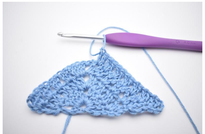
2. Herhaal "tot" in totaal 6x.