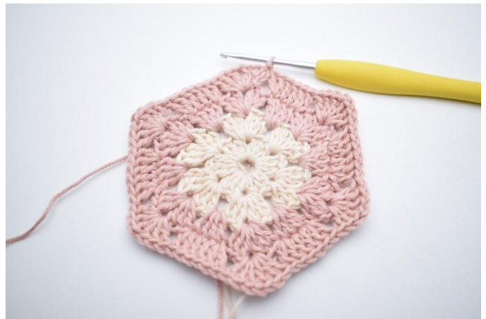
10. Herhaal *tot* in totaal 5x. Sluit met 1 Hv. Knip het garen af.