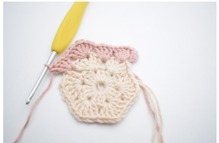
6. haak 4 Stk in de volgende ruimte*.