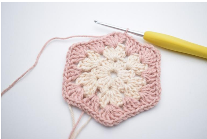
7. Herhaal *tot* in totaal 5x. Sluit met 1 Hv.