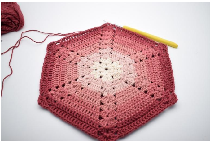
11. Herhaal *tot* in totaal 5x. Sluit met 1 Hv.