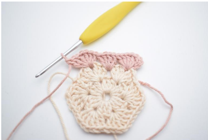
5. *Haak 3 Stk, 1 L, 3 Stk om de volgende losse,