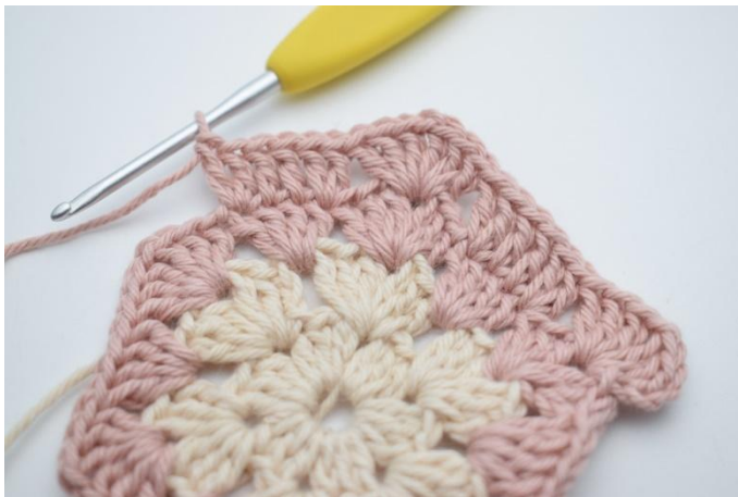
9. sla 3 steken over, haak 2 Stk in de volgende steek, 1 Stk in de volgende 2 steken, 2 Stk in de volgende steek*.