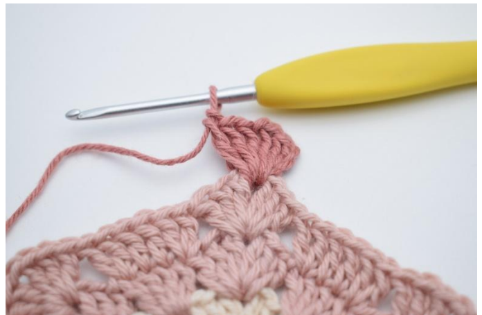
2. Haak 3 L. Haak 2 Stk, 1 L, 3 Stk om de losse.