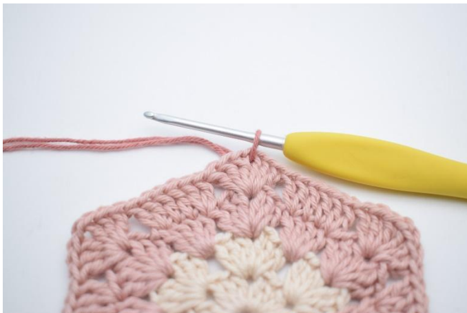
1. Wissel naar kleur 3. Hecht aan in een losserruimte.