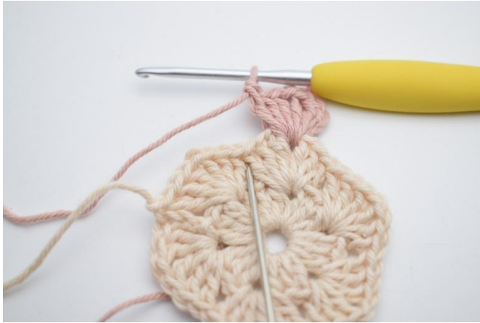
3. In de volgende ruimte haak je 4 Stk.