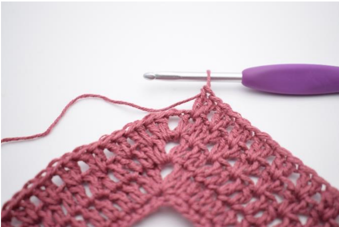
5. Herhaal "-" in totaal 29 (30) 32 (33) keer.