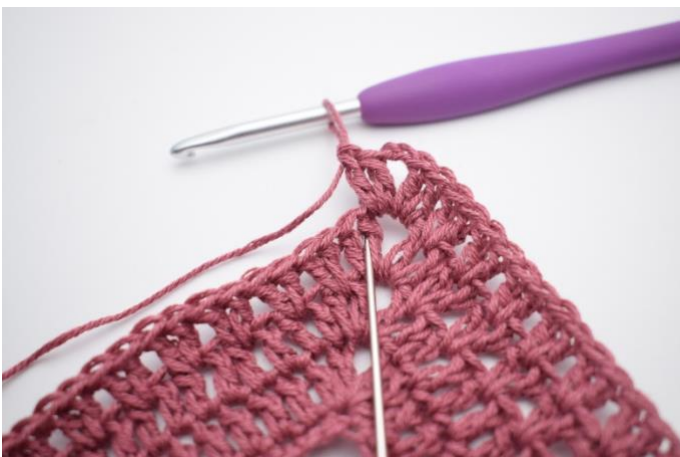
7. " Haak 2 stk tussen 2 stk van de vorige ronde ".