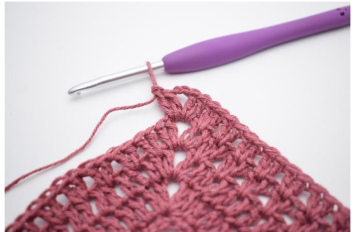
6. Haak " 2 stk, 2 l, 2 stk " in de l-tussenruimte.