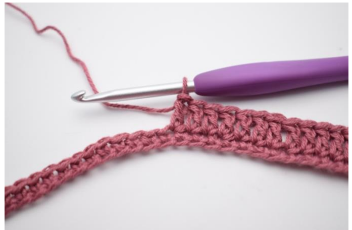
4. Haak 1 stk in de volgende 46 (48) 52 (54) s.