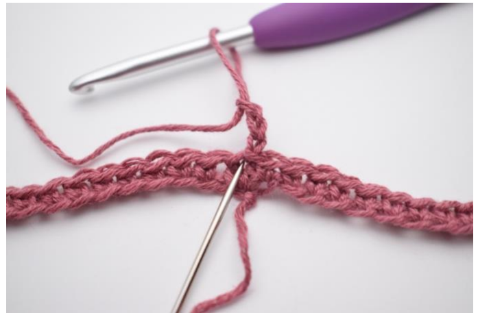
2. Haak 1 stk, 2 l, en 2 stk in dezelfde s. (De naald markeert de steek)