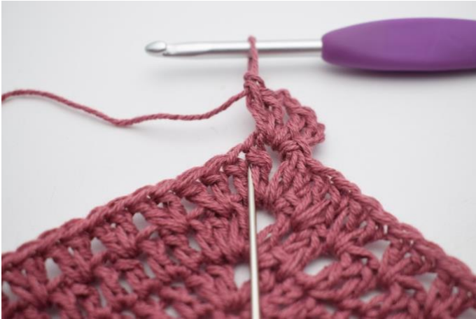
3. Haak " 2 stk tussen de eerste 2 stk van de vorige rij ".