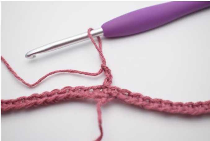
1. Haak 3 l (vervangt 1e stk).