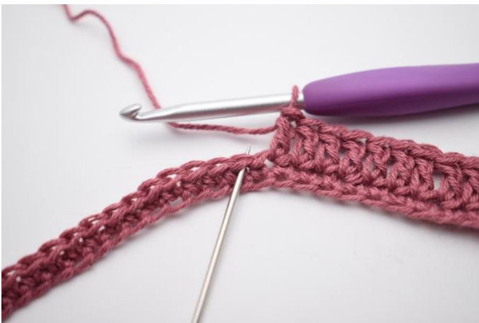
5. In de volgende s haak je " 2 stk, 2 l, 2 stk ".