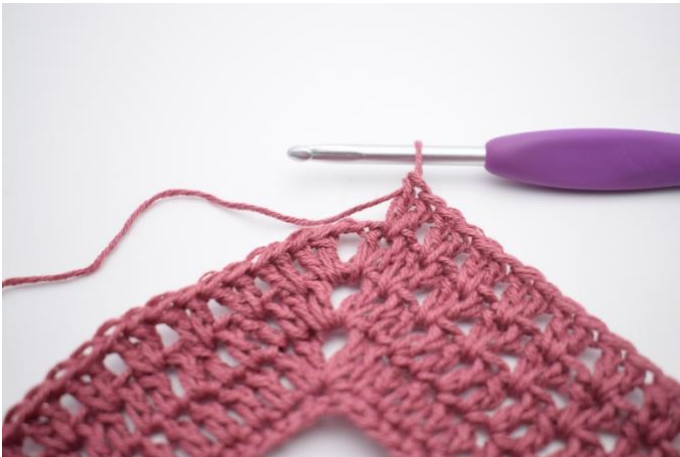
5. Herhaal "-" in totaal 37 keer.