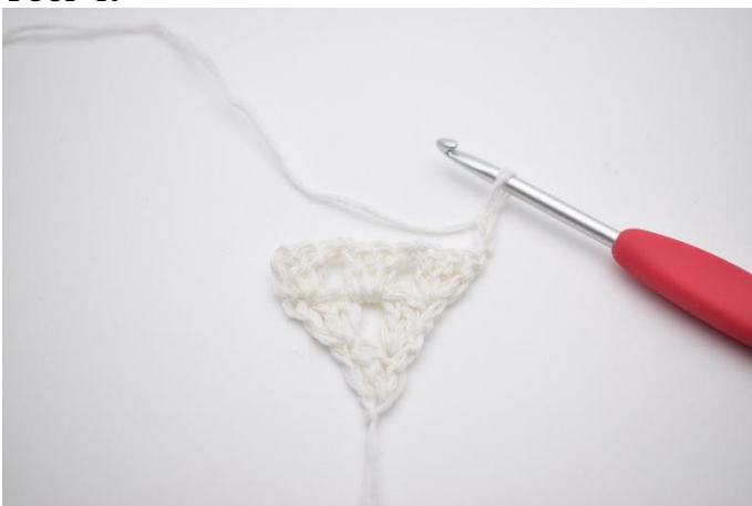
1. Keer het werk met 3 L (vervangen 1e Stk)