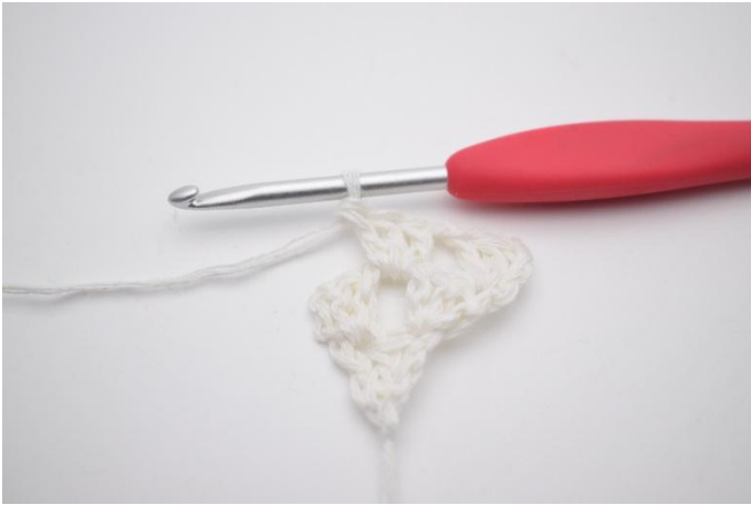
5. Haak 1 Stk-gr in de losseruimte.