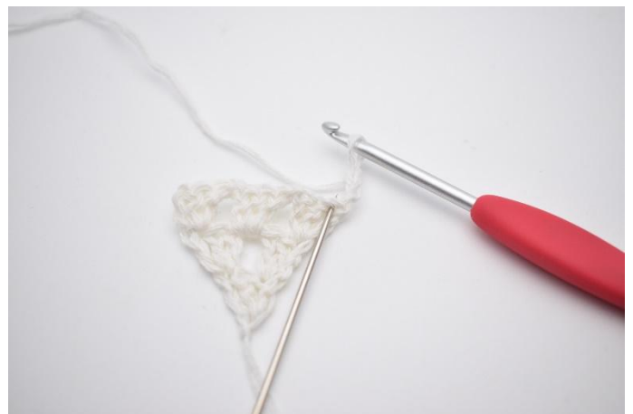
2. In de 1e steek, gemarkeerd door naald,