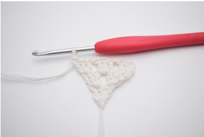
7. Haak 1 Stk-gr in de laatste steek.