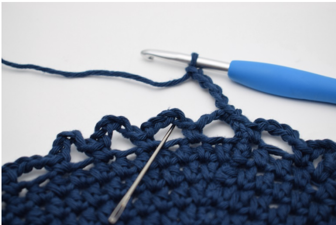
9. In het volgende l-bochtje (De naald toont waar)