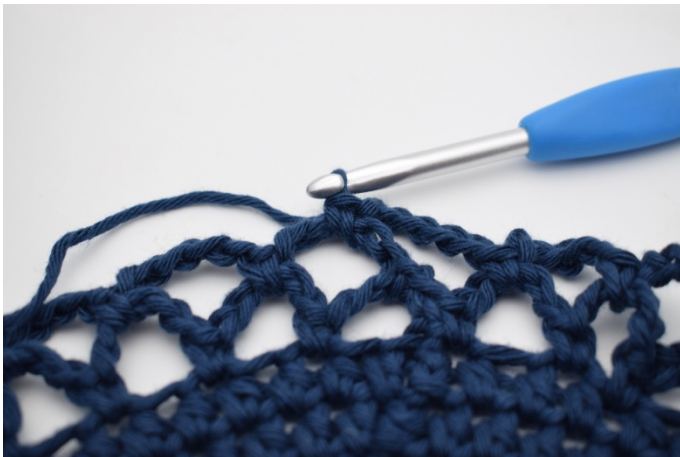
15. Zo haak je alle rondes rond. Je verandert van kleur zoals beschreven.