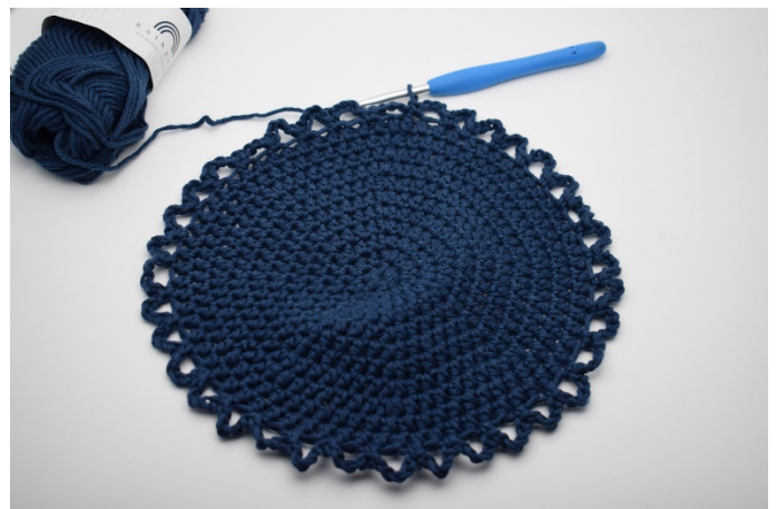
6. Zo ga je door, de ronde rond. Je haakt 36 l-bochtjes rond je bodem.