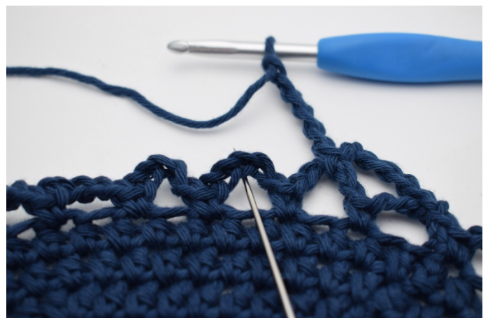
12. In het volgende l-bochtje (De naald toont waar)