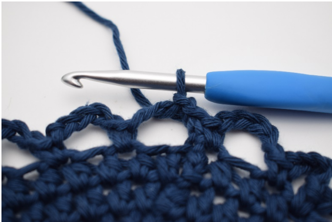
7. Haak 3 hv langs het eerste l-bochtje, zodat je kan starten in het midden van een bochtje.