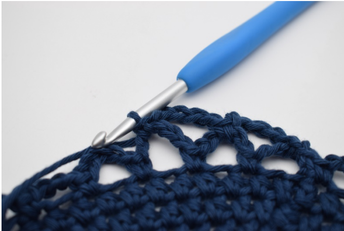
13. haak je 1 v.