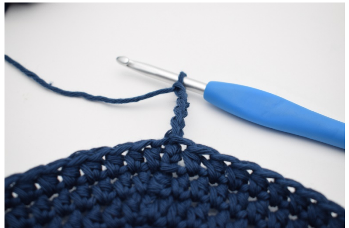
2. Haak 5 l.