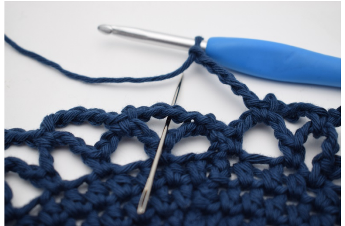
14. Zo ga je de ronde rond. De ronde sluit je af met 1 v in het eerste l-bochtje van de ronde.