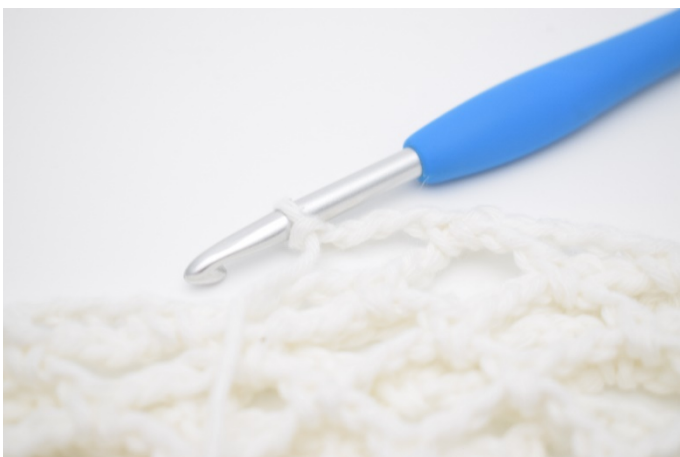
17. Er wordt nu nog 1 ronde gehaakt met kleur 4. Deze ronde haak je zoals normaal, maar dan met 4 l in plaats van 5.