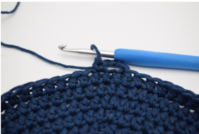
3. Sla 1 s over, en haak 1 v in de volgende s.