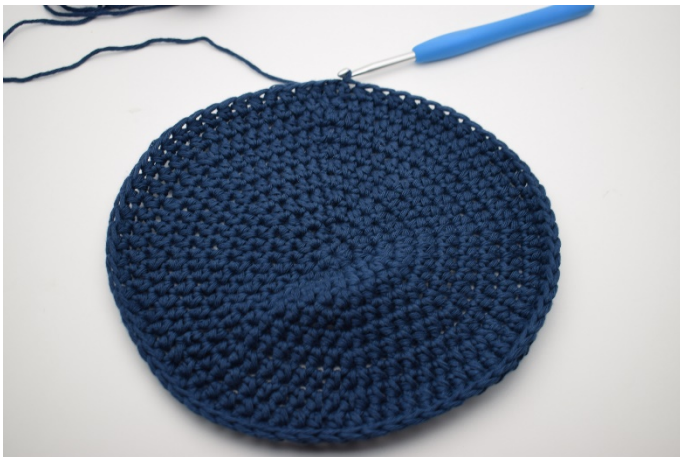
1. Hier is de bodem net afgemaakt.