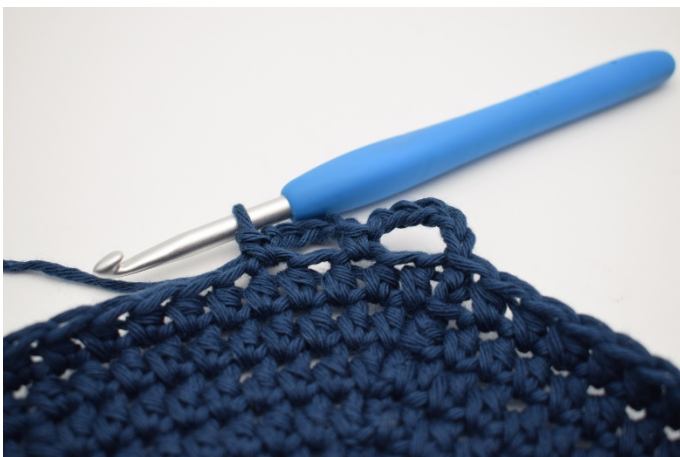
5. Sla 1 s over, en haak 1 v in de volgende s.