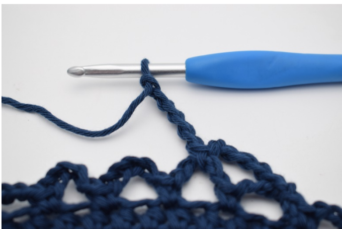
11. Haak 5 l.