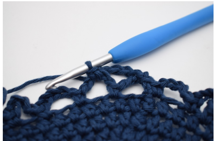
10. haak je 1 v.