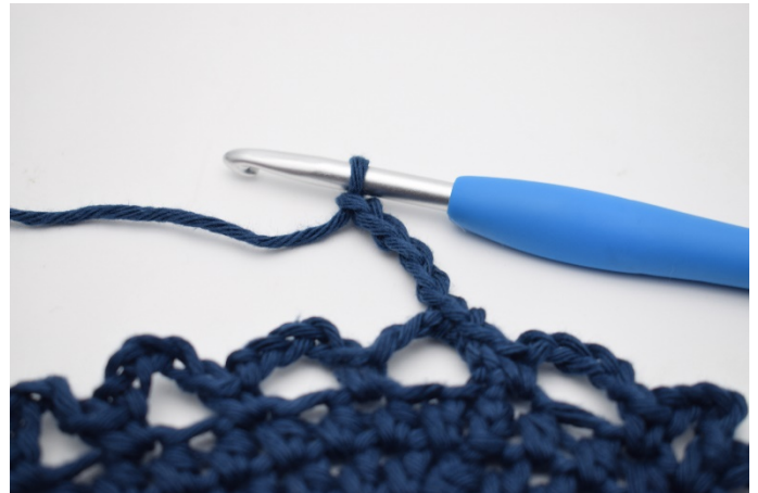
8. Haak 5 l.