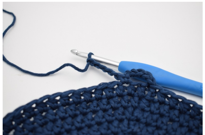
4. Haak 5 l.