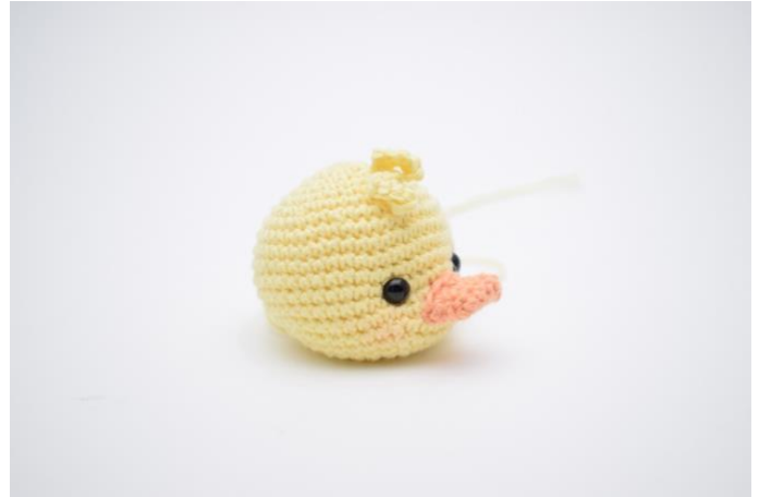
2. Naai de krulletjes vast op het voorhoofd.