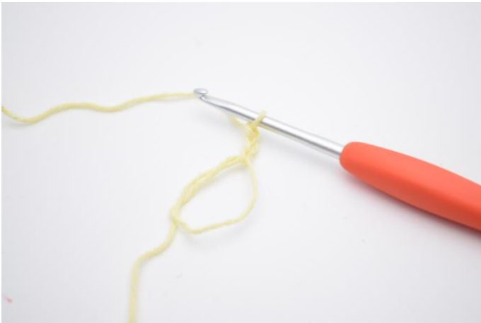
1. Maak een mr, en haak 3 l (vervangt 1 stk).