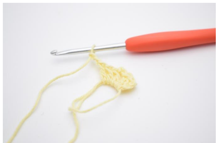
4. Haak " 3 stk en 2 l".