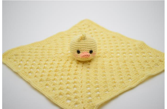
10. Naai het hoofdje vast in het midden.