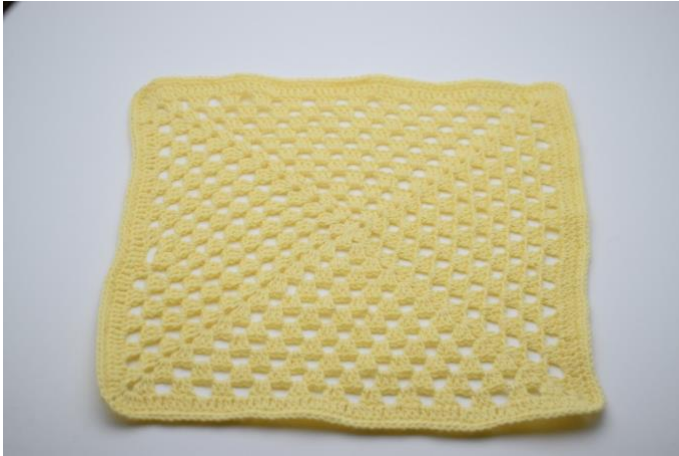
9. Je lapje is nu klaar.