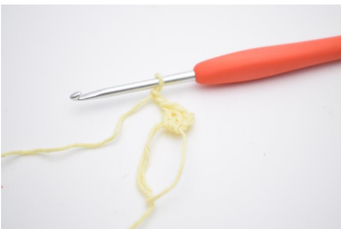
3. Haak 2 l.