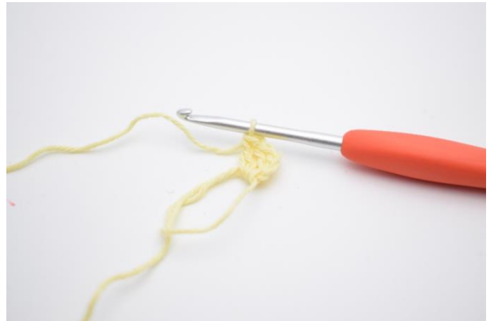
2. Haak 2 stk in de ring.