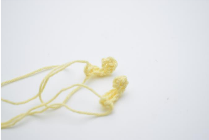
1. Hier zijn de krulletjes klaar.