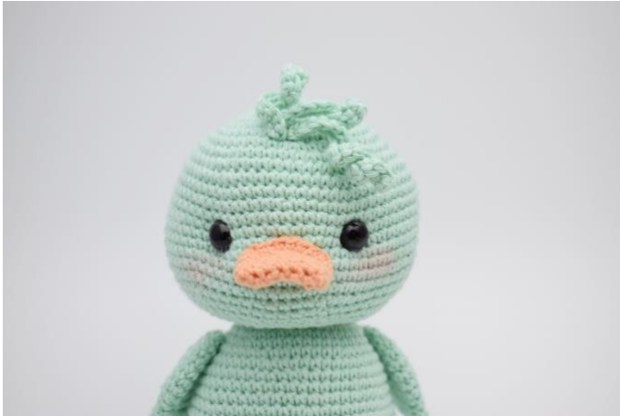
1. Naai de krulletjes vast op het hoofd,