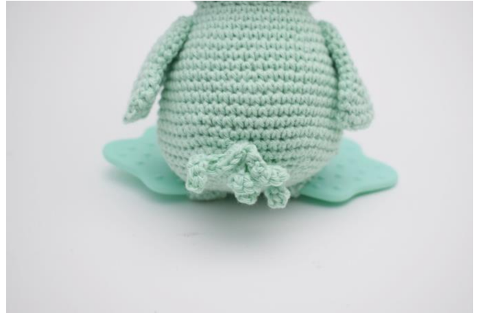
2. en op de achterkant.