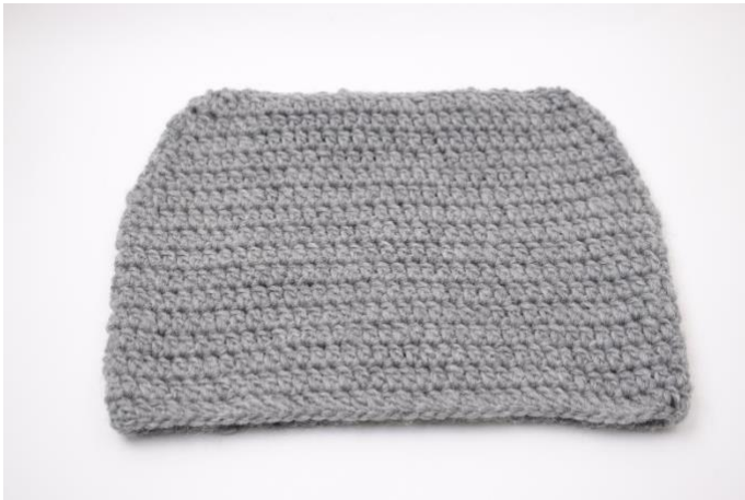
Zo ziet de muts eruit voor het vilten. Formaat ca. 43x30 cm

Het vilten gebeurt in een gewoon wasprogramma op 40 graden in de wasmachine. – gebruik GEEN snel programma. Was eventueel mee met een handdoek of een spijkerbroek. Als het niet genoeg gevilt is, kan je hem eventueel nog eens wassen. Het resultaat van vilten kan wat variëren van wasmachine tot wasmachine, en daarom kan het een goed idee zijn om een testlapje te maken en deze te wassen.