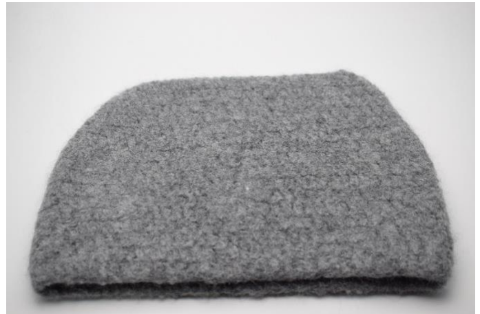
En na het vilten. Formaat ca. 33x24cm