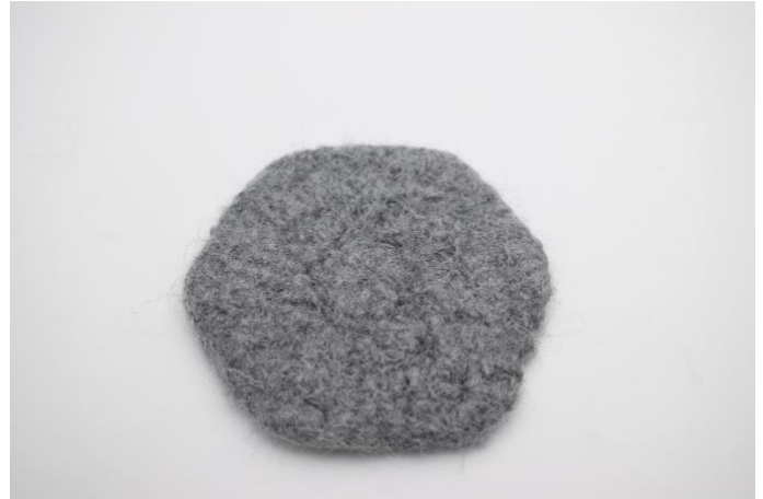
Zo na het vilten Formaat ca. 10x11 cm