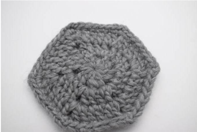
Zo ziet het eruit voor het vilten. Formaat ca. 14x15 cm