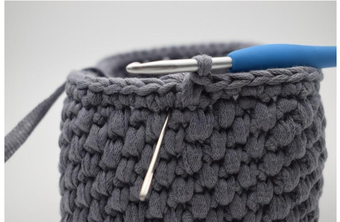
4. De naald markeert waar je de volgende Vv haakt.