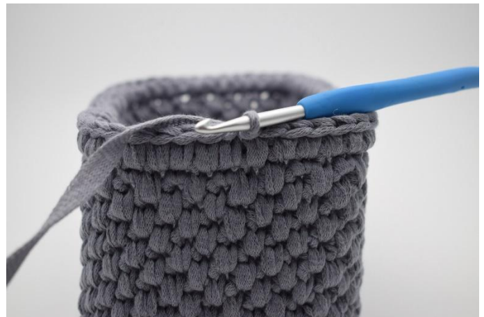
6. Herhaal dit de hele toer en sluit met 1 Hv.