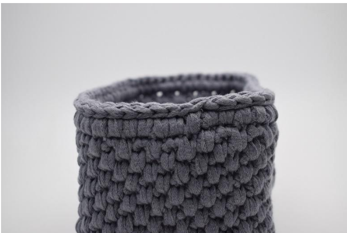
7. Als laatste haak je een toer Hv.