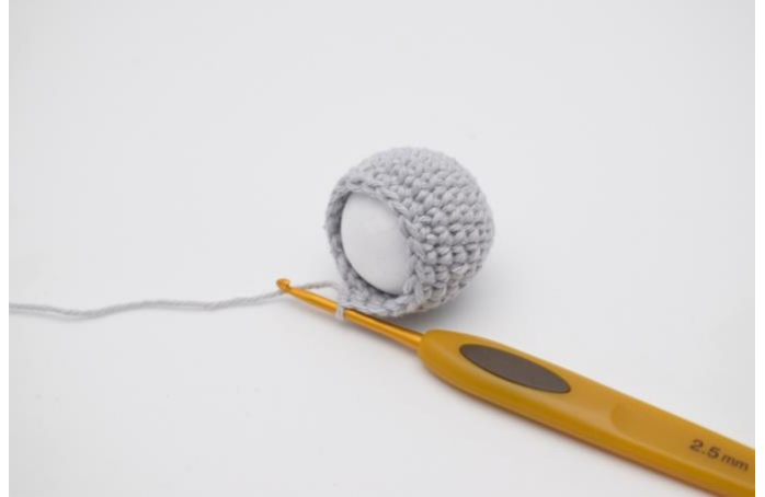
2. stop je de piepschuimen bal in je werkje.