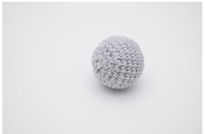
4. Naai het gaatje dicht en bevestig de eindjes.