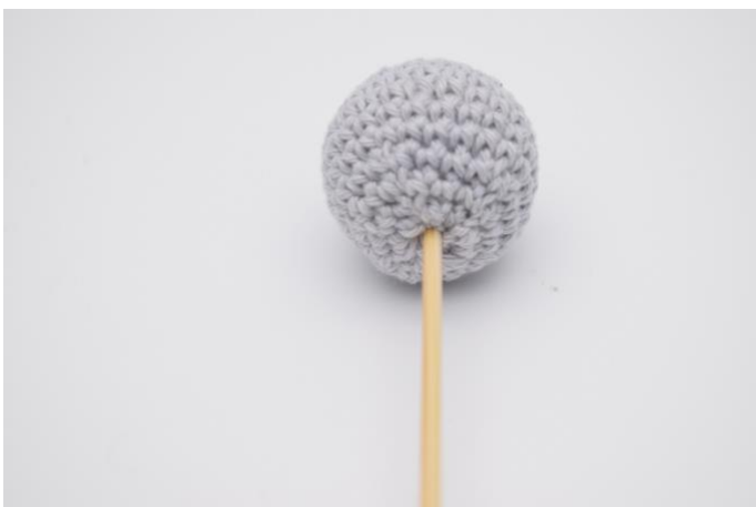
5. Prik de satéprikker in de bal.