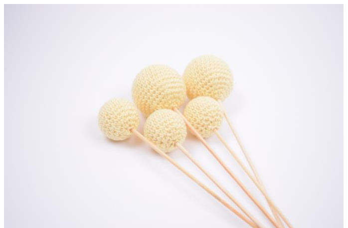
6. Ze zijn nu klaar om je huis te decoreren!