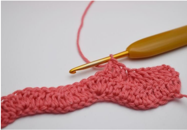
13. Haak 1 stk i de volgende 3 s.