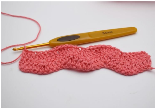
15. " Haak 1 stk in de volgende 3 s. Nu haak je 3 stk samen. Haak 1 stk in de volgende 3 s, en in de daaropvolgende s haak je 3 stk in dezelfde s." Herhaal de rij door, totdat je nog 4 s over hebt. Haak 1 stk in de volgende 3 s.