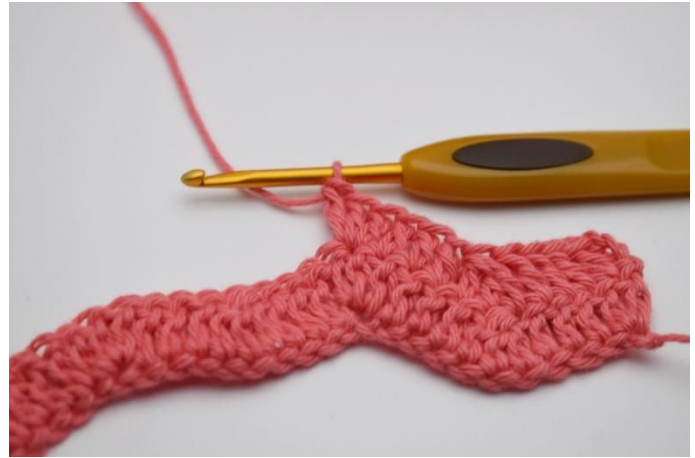
14. In de daaropvolgende l haak je 3 stk in dezelfde s.