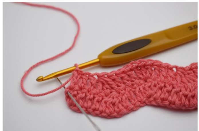
16. In de draaisteek haak je 2 stk.