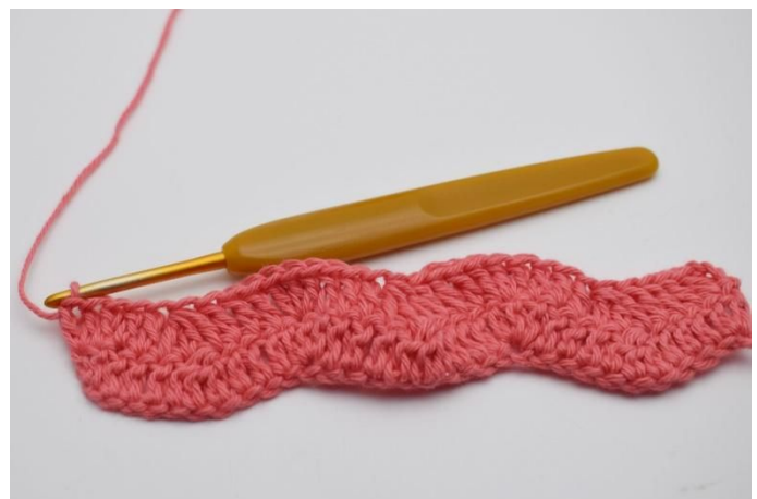
18. Op deze wijze herhaal je de rijen.