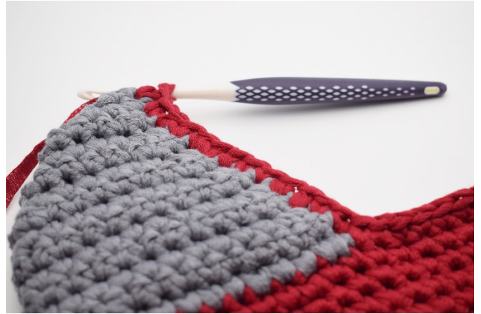
Haak nu 14 v langs de ene kant van de hiel