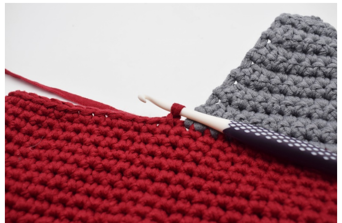
Zet het rode garen in.