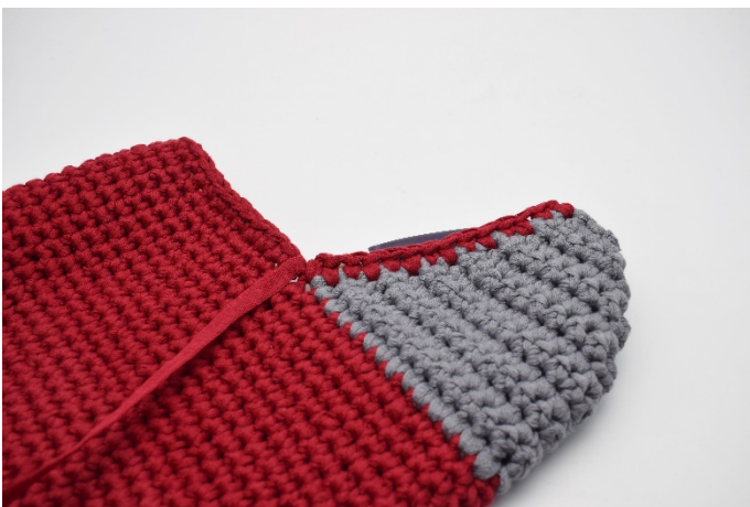
En 14 v langs de andere zijde van de hiel.