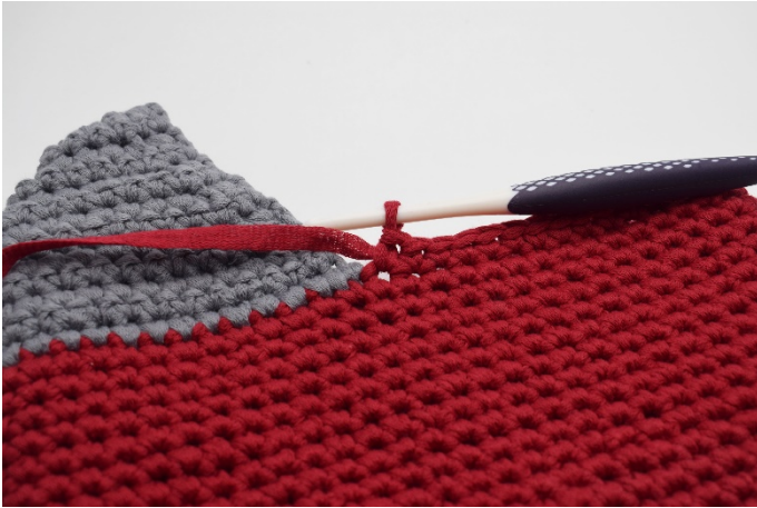
Haak 1 v in 32 s tot aan daar waar de hiel begint.