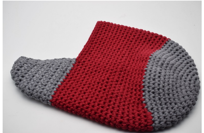
Naai de einden samen aan de verkeerde kant. De hiel is nu klaar.