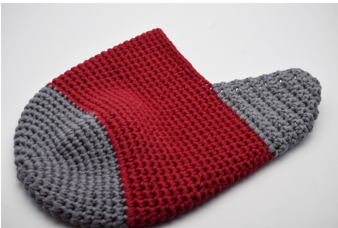
Keer de sok.