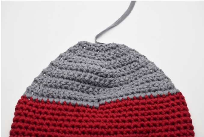
Zo ziet de hiel er nu uit.