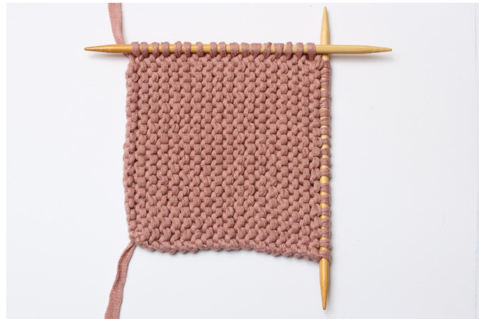
2. 17 s op de 2e naald.