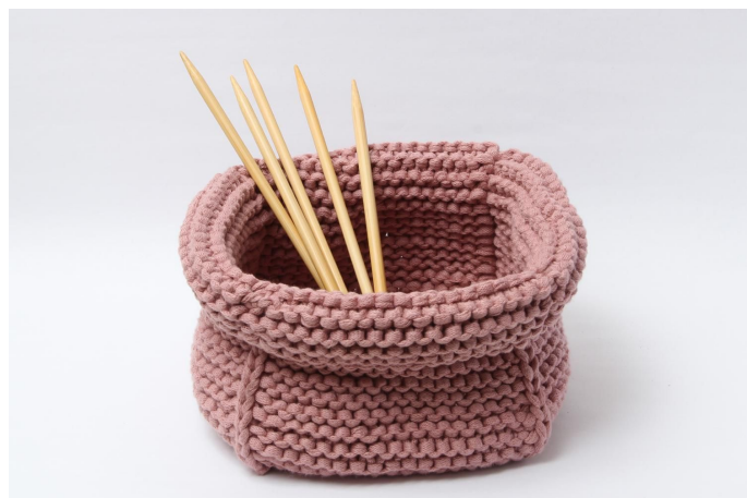
Mandje met omslag