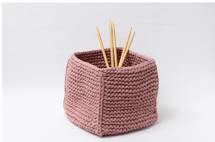
Mandje zonder omslag