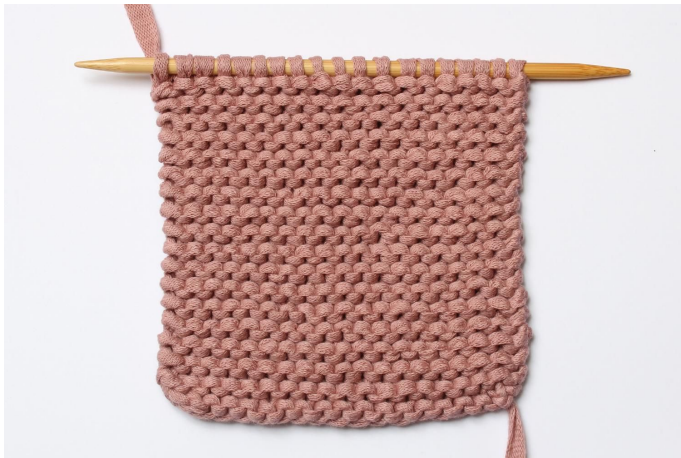
1. 19 s op de 1e naald.