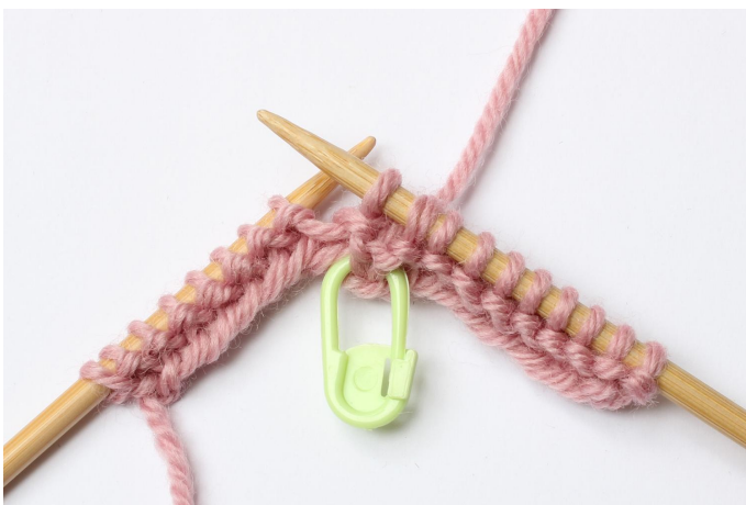
5. Brei deze steken recht samen.