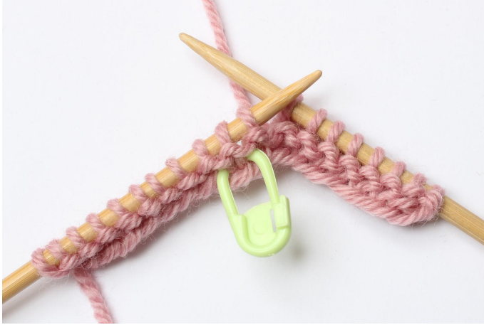
1. Brei tot 1 s voor de markeerder.