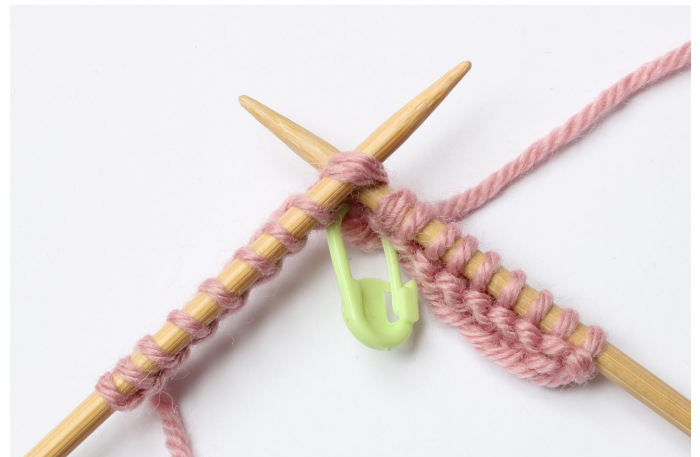
4. Steek de naald er in 2 steken in, van links naar rechts.