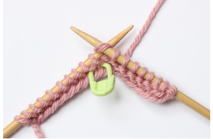
2. Steek de naald in recht, in de steek.