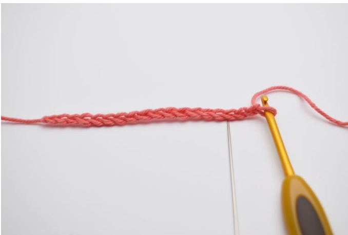
1. Begin met een aantal l, (deelbaar door 3) De eerste s haak je in de 3e steek vanaf de haaknaald.