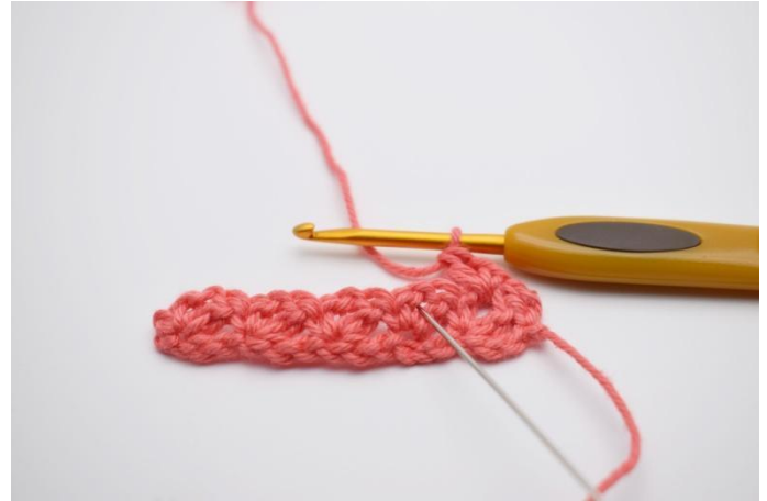
12. Ga naar het volgende gaatje.