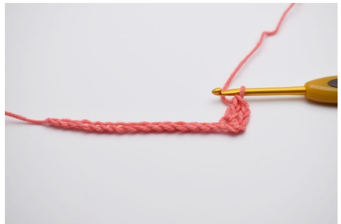
2. Haak 1 v, 1 l, 1 st in de 3e l vanaf de naald.