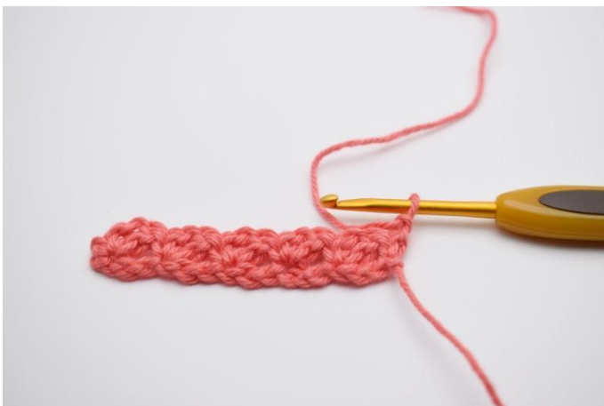
9. Keer om met 1 l.