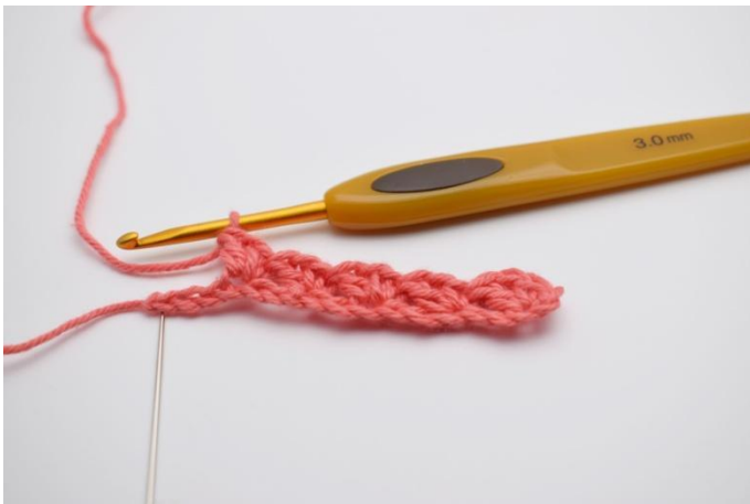
7. Herhaal *sla 2 l over, haak 1 v, 1 l, 1 st* in de volgende l, tot er 3 s over zijn.