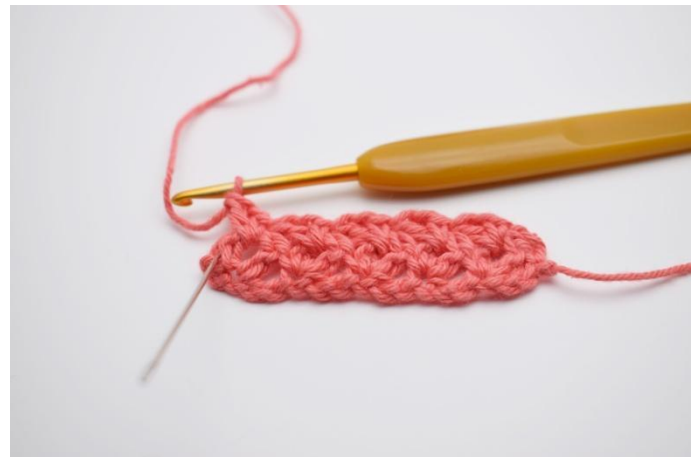
14. Herhaal tot het einde van de toer.