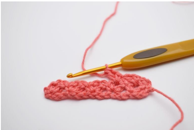
13. Haak *1 v, 1 l, 1 st,* in het volgende gaatje.