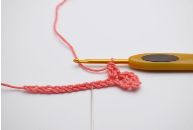
5. Sla 2 l over.