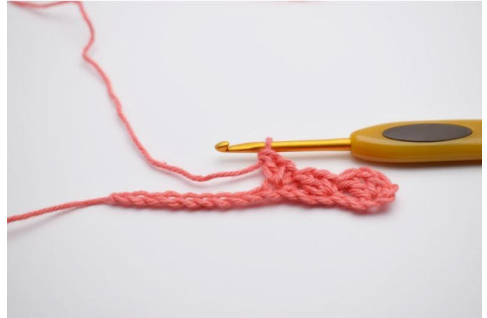
6. Haak *1 v, 1 l, 1 st* in de volgende l.