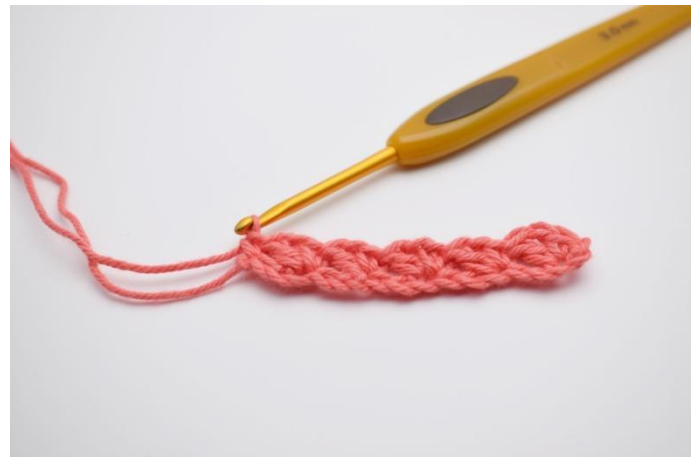
8. Haak 1 v in de laatste l.