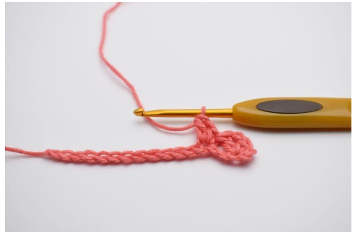
4. Haak *1 v, 1 l, 1 st* in de volgende l.