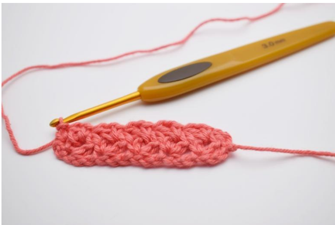
15. Haak 1 v in de s van het omkeren. Ga verder tot de gewenste afmeting van het vaatdoekje.