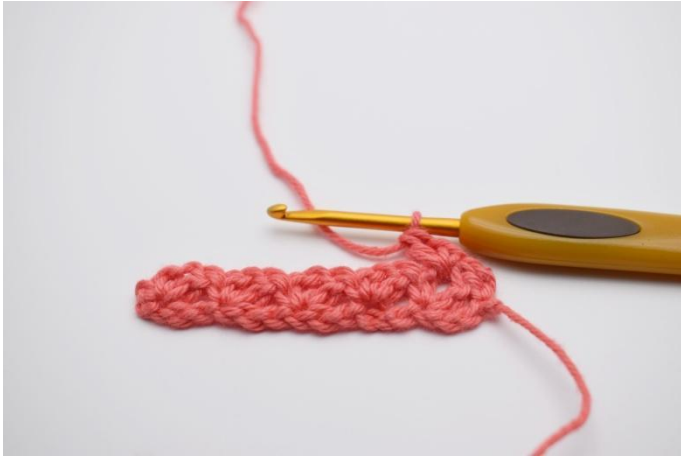
11. Haak *1 v, 1 l, 1 st* in het l-gaatje.