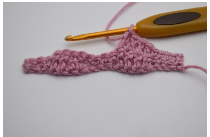
8. Haak 1 Stk in de daarna volgende 4 steken.