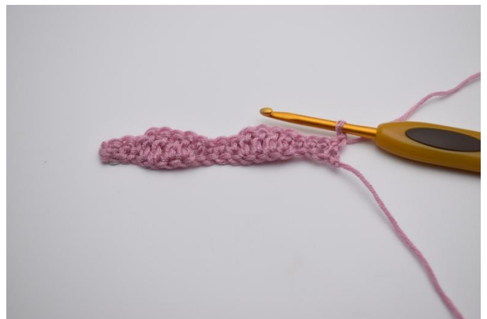
6. Keer het werk met 1 L (vervangt NIET de 1e V).