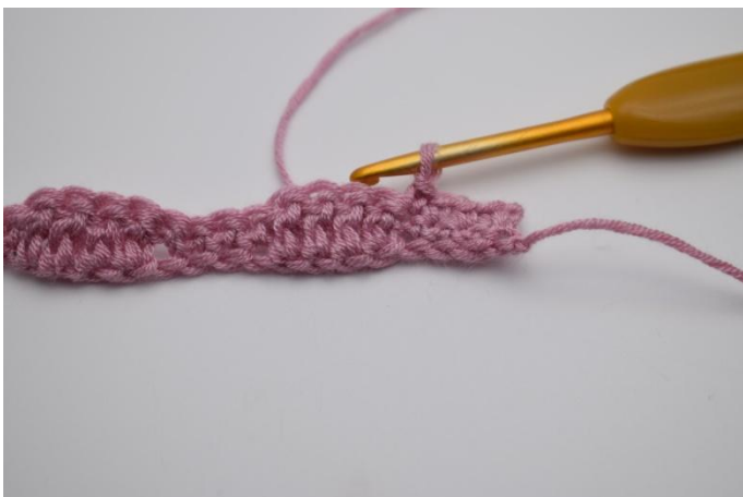
7. Haak 1 V in de volgende 4 steken.