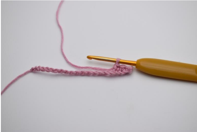
3. Haak 1 V in de volgende 3 L.