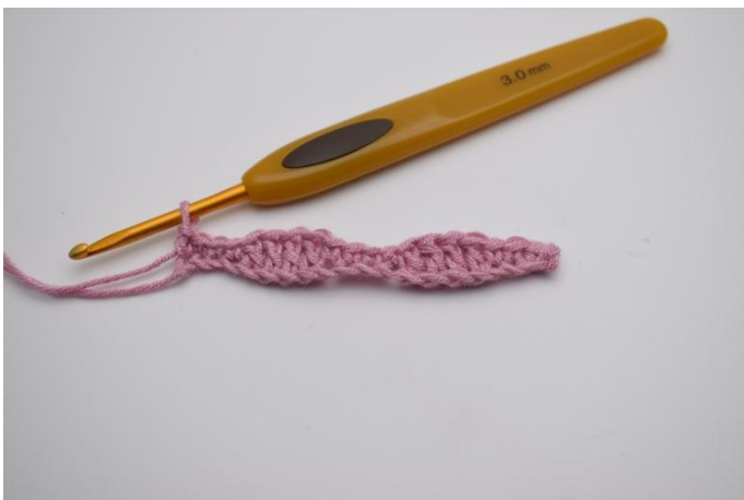
5. Haak *1 V in de volgende 4 L, 1 Stk in de daarna volgende 4 L*. Herhaal *tot* tot het eind van de lossenketting en sluit af met 1 V in de laatste 4 L.