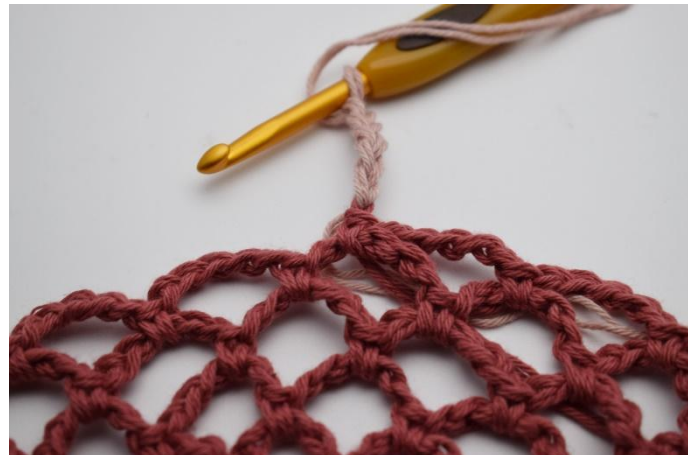
18. Ga over op Oudroze. Haak je volgende 5 l met deze nieuwe kleur.