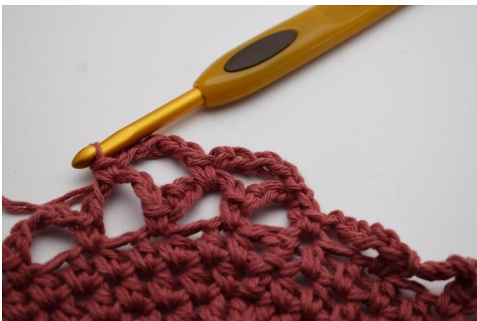
13. Haak je 1 v.