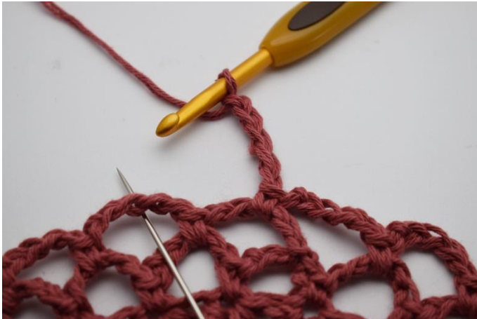
15. Zo kan er nog een ronde worden gehaakt. Haak 5 l.