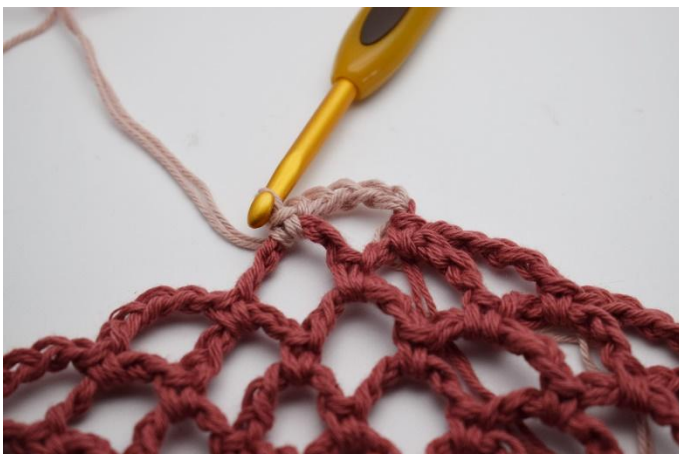
19. Haak 1 v in de volgende l-bocht. Nu herhaal je de rondes tot je 5 rondes met Oudroze hebt. Ga dan over op Huidskleur, en haak 5 rondes