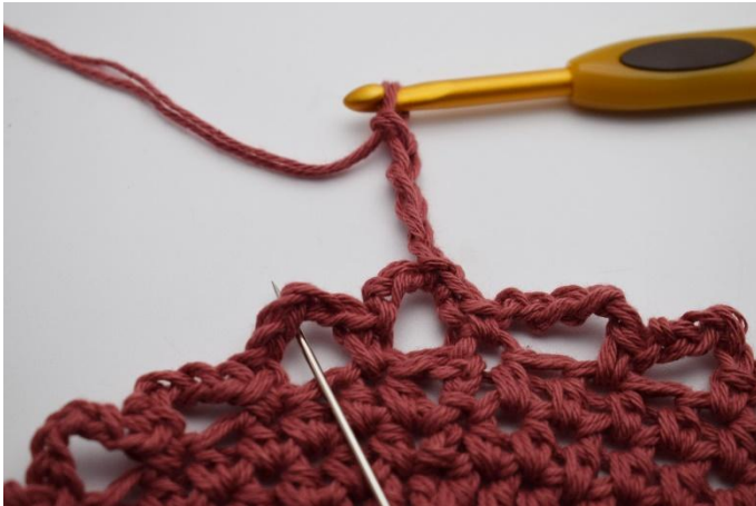
9. In de volgende l-bocht, (die de naald toont)