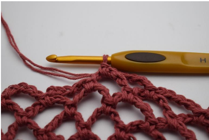
17. De 5e ronde met Donker oudroze is hier nu af.