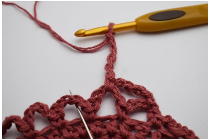
12. In de volgende l-bocht, (die de naald toont)