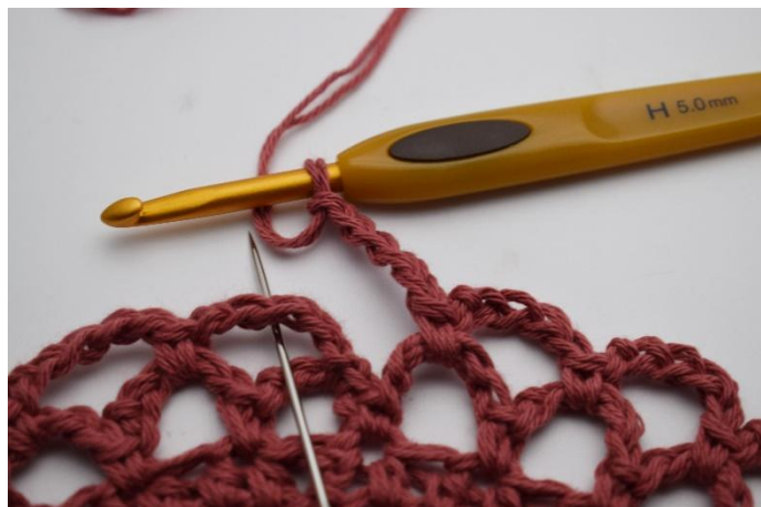
14. Zo herhaal je, de ronde rond. De ronde wordt afgesloten met 1 v in de 1e l-bocht die werd gemaakt in deze ronde.