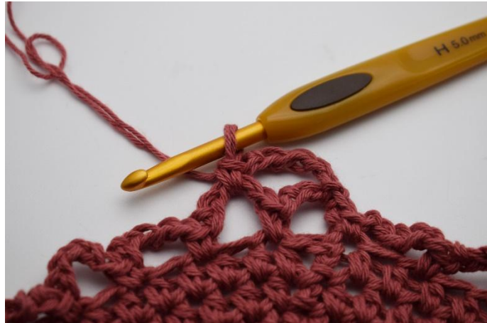
10. haak je 1 v.