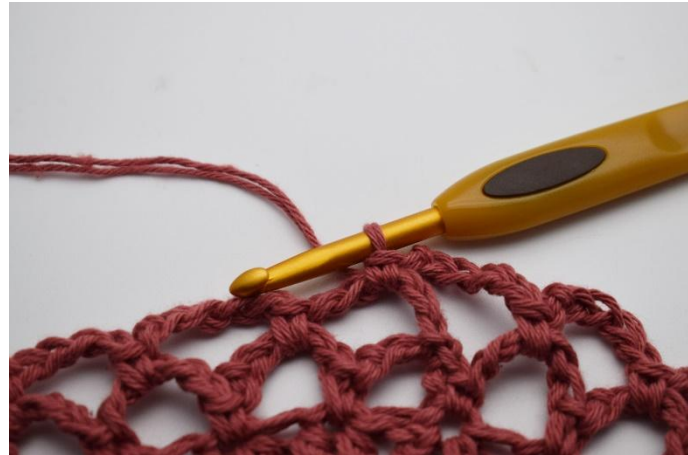
16. Haak 1 v in de volgende l-bocht. Zo ga je de ronde rond tot je in totaal 5 rondes hebt met donker oudroze.