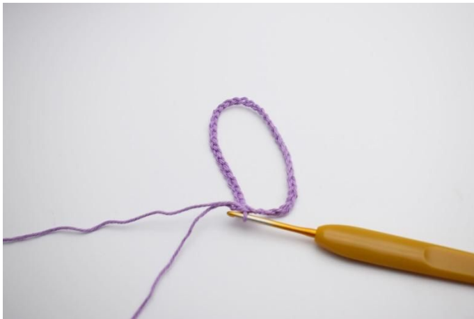
1. Start met een rij lossen, en maak er een ring van met 1 hv.

Naai nu rond in de steken, en trek aan, zodat het gat bovenin de muts dichtgetrokken wordt. Bevestig de eindjes.