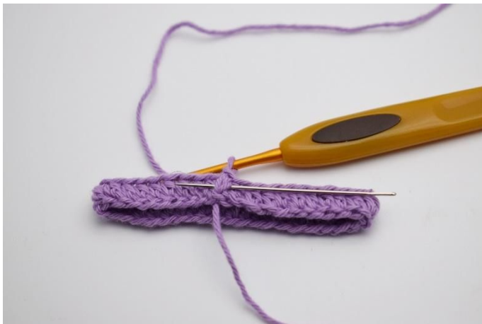
3. Haak 1 l en haak 1 vrhstk. De naald markeert hier hoe hstk gehaakt wordt, rond de hstk van de vorige ronde.