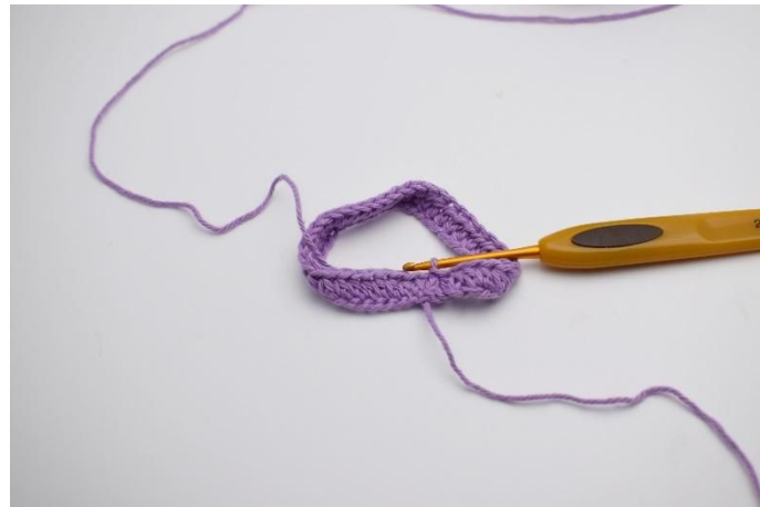
2. Haak 1 l, en haak nu hstk, de ronde rond. Sluit af met 1 hv.