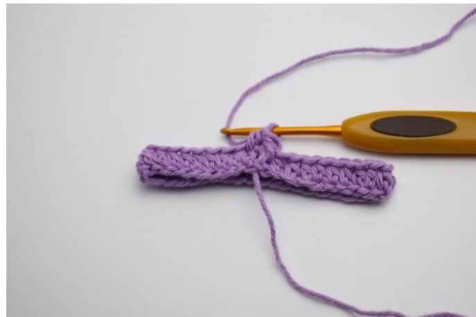
4. In de volgende s haak je 1 normale hstk.