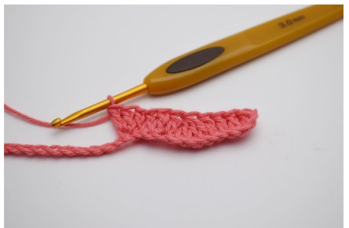
6. In de daaropvolgende l, haak je 3 stk in dezelfde l.