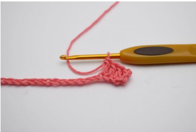
3. Haak 1 stk in de volgende 3 l.