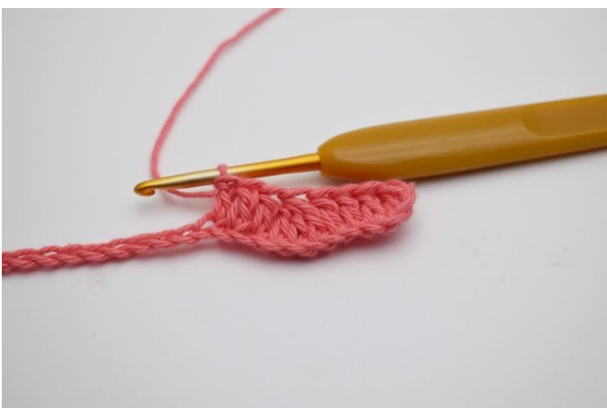
5. Haak 1 stk in de volgende 3 l.