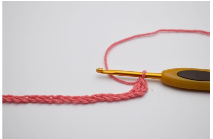
2. Haak 1 stk in de 3e l vanaf de naald.