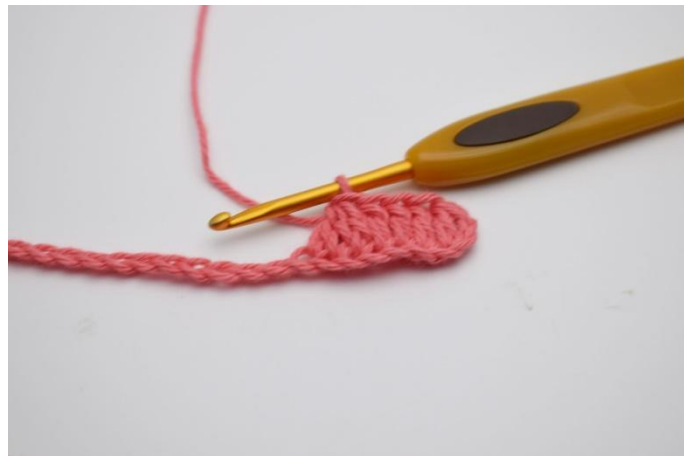
4. Nu haak je 3 stk samen.